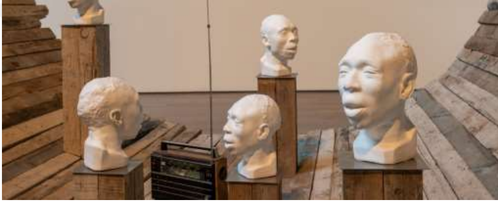
Görsel 20: Radcliffe Bailey, 'Nommo', 2019, İKSV, 16. İstanbul Bienali, (Detay)

ticareti sırasında batık bir gemi, yasadışı bir gemi olan Clotilda'ya bazı göndermeler var. Bu gemi Mobile Bay'de battı. (...) İstanbul sokaklarında bir kamyonun arkasında oynadığı bir performans sergiledi. Geminin tepesinde alçı büstler görülüyor; Bunlar Belçika'daki bir antika satıcısından topladığım büstler. Kalıbı ondan aldım ve kendim döktüm. Büstün kendisinin bir ölüm maskesi olması gerekiyordu ve Belçika'dan olması, gerçek büstün muhtemelen Kongo'dan biri olduğu anlamına geliyordu” (Soboleva, 2021). (URL 13) 13