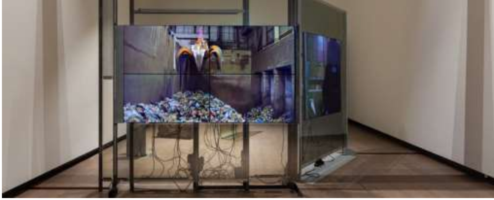
Görsel 16: Eloise Hawser, 'Çöp Boşaltma Alanı' Multimedya Yerleşirmesi, 2019, İKSV, 16. İstanbul Bienali

Sanatçının gerçekleştirmiş olduğu bu multimedya film, İstanbul'da bulunan en büyük atık geri dönüşüm merkezinde gerçekleşmiştir. Enstalasyon çalışmasına bakıldığında geri dönüşüm merkezindeki kurulum Video Sanatının potansiyeli kullanılarak oluşturulmuştur. Atıkların geri dönüşüm merkezleri, aynı işlemi sürekli icra ederler. Çünkü tüketim kültürünün ortaya çıkarttığı yoğun tüketim alışkanlığı sürekli atıkların ortaya çıkmasına neden olur. Bu bağlamda düşünüldüğünde tüketim sürecinin devamlılığına karşın geri dönüşüm sürecinin de aynı şekilde süreklilik göstereceğine işaret eder. Hawser'ın 'Çöp Boşaltma Alanı' adlı Enstalasyonunda plastik yığınlarının üzerinde bir kanca yer almaktadır. Kancanın altında ise bir tepeyi andıran çöp yığınları (atıklar) yer alır.