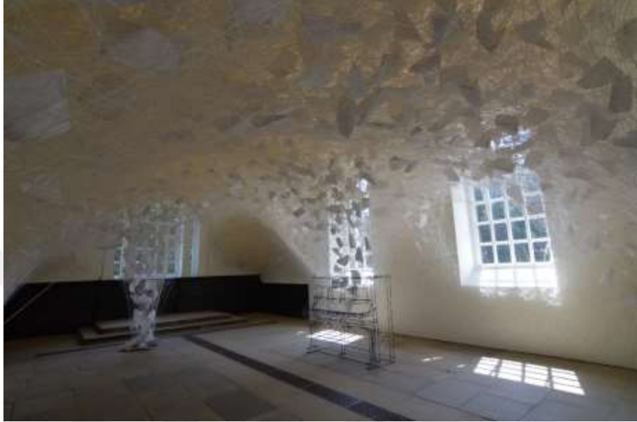
Görsel 10: Chiharu Shiota, 'Beyond Time', 2018, Yorkshire Sculpture Park, UK

önemlidir. Sanatçının eserlerinde kullandığı nesnelere metaforik anlamlarının da ortaya çıkartılması, bu eserlerin vermek istediği mesajın anlaşılmasını sağladığı söylenebilir.