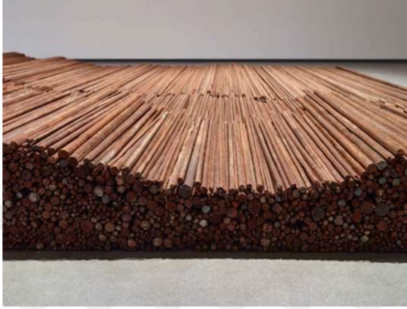
Görsel 8: Ai Weiwei, 'Straight', 1200x600 cm, 2008-2012

Enstalasyonun bütününe bakıldığında zemine dizilen farklı uzunluklardaki demirlerin yükselteleri farklılık göstermektedir. Bu farklılık çalışmanın yüzeyinde dalgalı bir form ortaya koyar.