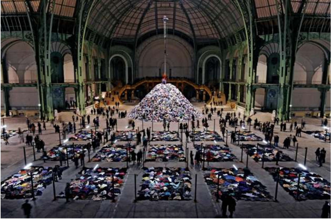
Görsel 4: Christian Boltanski, ‘Personnes’, Monumenta Grand Palais, Paris, 2010, Fotoğraf: Didier Plowy

devasa bir animasyonlu tablo olarak sunuyor (URL 4) 4 . Hafıza konusunu eski fotoğrafları ve kıyafetleri kullanarak geçmiş hakkında hikâyeler anlatmak için araştırmaya devam eden Fransız sanatçı, Christian Boltanski, ‘Personnes’ adlı çalışmanın oluşturulmasında belge ve kurmacalar arasındaki gerilimi çözerek metaforu seçmiştir (Saladini, 2011, s. 332).