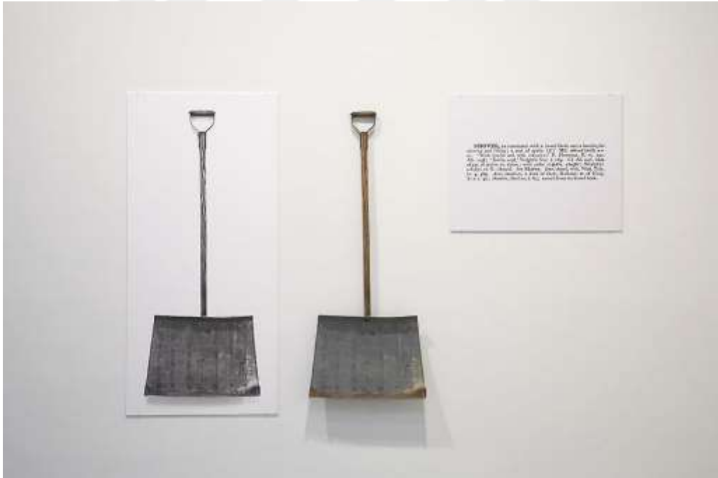
Görsel 3: Joseph Kosuth, 'One And Three Shovels', 1965