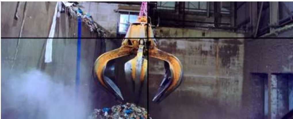
Görsel 17: Eloise Hawser, 'Çöp Boşaltma Alanı', Kanca (Detay), Multimedya Yerleşirmesi, 2019, İKSV, 16. İstanbul Bienali

Sanatçının gerçekleştirmiş olduğu bu multimedya film, İstanbul'da bulunan en büyük atık geri dönüşüm merkezinde gerçekleşmiştir. Enstalasyon çalışmasına bakıldığında geri dönüşüm merkezindeki kurulum Video Sanatının potansiyeli kullanılarak oluşturulmuştur. Atıkların geri dönüşüm merkezleri, aynı işlemi sürekli icra ederler. Çünkü tüketim kültürünün ortaya çıkarttığı yoğun tüketim alışkanlığı sürekli atıkların ortaya çıkmasına neden olur. Bu bağlamda düşünüldüğünde tüketim sürecinin devamlılığına karşın geri dönüşüm sürecinin de aynı şekilde süreklilik göstereceğine işaret eder. Hawser'ın 'Çöp Boşaltma Alanı' adlı Enstalasyonunda plastik yığınlarının üzerinde bir kanca yer almaktadır. Kancanın altında ise bir tepeyi andıran çöp yığınları (atıklar) yer alır.