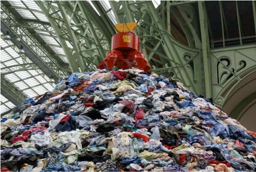
Görsel 5: Christian Boltanski, ‘Personnes’, Monumenta, Grand Palais, Paris, 2010, Fotoğraf: Didier Plowy

ısrar etti. “Ziyaretçinin esere sadece bakmasını değil, içinde hissetmesini istiyorum” diyor. Eserin adı, Fransızca bir kelime olan “Personnes” olup, iki anlamı vardır: çok insan ve hiç kimse; olmak ve olmamak. Bu, 13.500 metrekarelik muazzam bir nef, ..., alçak asılı neon lambalı tellerle çevrili kesin dikdörtgenler halinde düzenlenmiş eski giysilerle dolu. Bir fırtına ya da savaş davulları gibi gümbürdeyen, gelişen gürültü, aslında yüzlerce kalp atışının yankısıdır” (Odobescu, 2010). (URL 5) 5