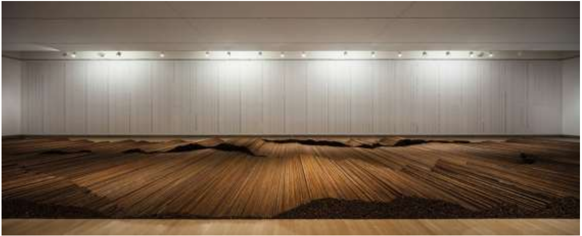
Görsel 7: Ai Weiwei, 'Straight', 1200x600 cm, Royal Academy of Arts, Londra, 2008-2012

Ai Weiwei'nin 'Straight' isimli çalışmasında kısa-uzun ve kalın-ince olmak üzere farklı boyutlarda bulunan demir çubukların aynı yöne doğru dizildiği görülmektedir (görsel 7). Enstalasyonun sergilendiği mekânın duvarında depremden kaynaklı olarak oluşan felakette ölen ya da kaybolan çocukların isimlerinin, yaşlarının ve okullarının adının yazdığı büyük bir pano yer almaktadır.