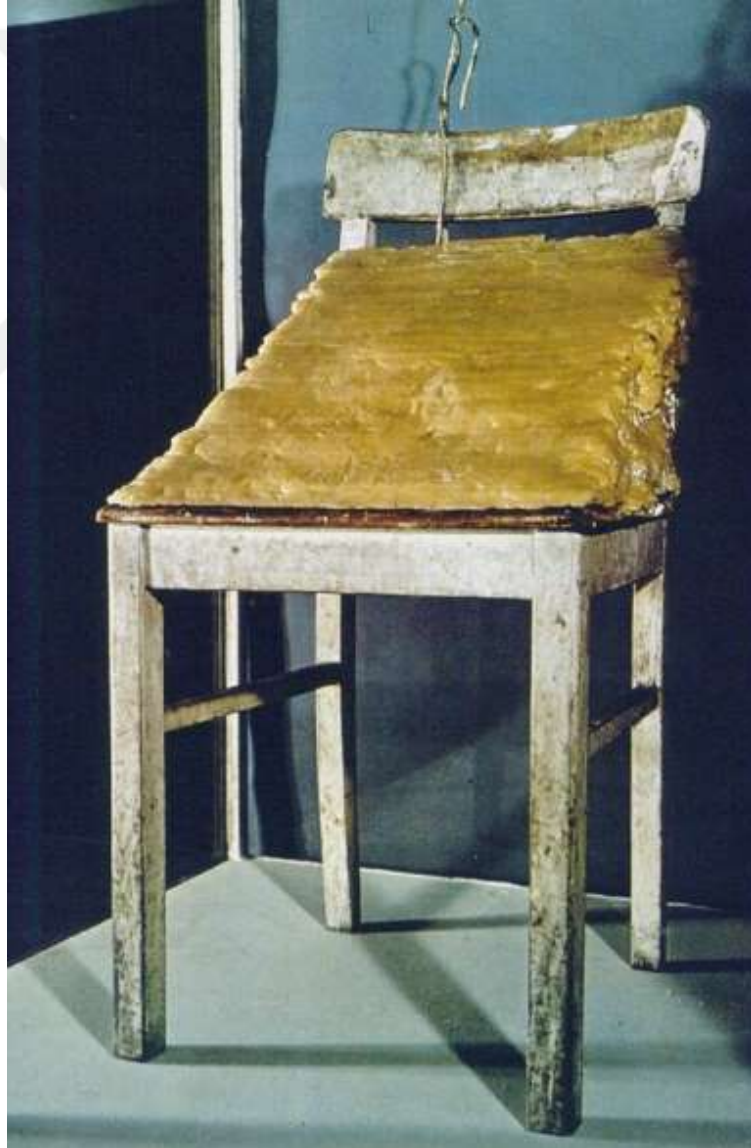
Görsel 1: Joseph Beuys, 'Fat Chair', 1964

Sanatçının görsel 1'deki 'Fat Chair' adlı eserinde de 'süreç' olgusunun etkileri yoğun şekilde görülür. Bu çalışma, bir nesnenin belirli zaman aralıkları içerisinde ortaya koyduğu doğal değişkenlere işaret eder. Sanatçının 'Fat Chair' adlı eserinin çözümlenme aşamasında hem yağ nesnesinin metaforik anlamına hem de ortaya çıkan değişim ve dönüşümün süreç bağlamında ki durumuna değinilmiştir.