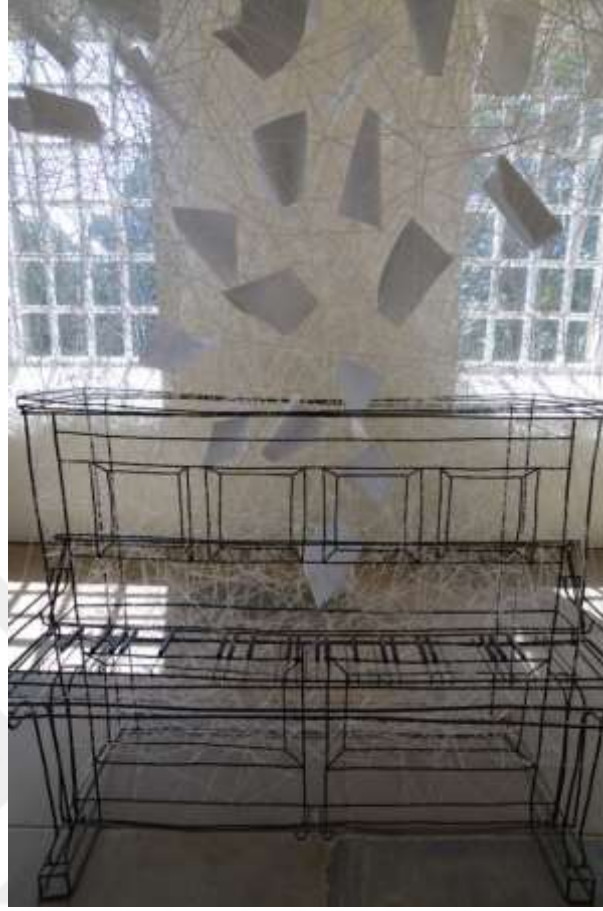
Görsel 11: Chiharu Shiota, 'Beyond Time', 2018, Metal Piyano Çerçevesi (Detay), Yorkshire Sculpture Park, UK

Chiharu Shiota'nın, hayal gücünün ve yaşantılarının izlerini yansıtan enstalasyonları arasında İngiltere'de Yorkshire Heykel Parkı'ndaki 'Beyond Time' gösterilebilir. Bu çalışmada sanatçı geçmiş dönemlerin anılarına atıfta bulunarak bir şapel olarak kullanılan mekânın anlam ve anılarına vurgu yapar. "Müziksiz metal bir piyano yapısı yarattı, ancak görsel melodinin akışını sağlamak için telleri kullanmayı amaçladı. İpler boşluğu dolduruyordu ve şapelin geçmişine ait belgelerin kâğıt kopyaları, çapraz ve satırların arasına geçirilmişti. Geçmişin kanıtları iplerle birbirine bağlı ve kuruluma yardım eden insanlar, kurulum çok emek yoğun olduğu için birbirine bağlandı" . Geniş bir alanda kurgulanan bu çalışmanın bölümleri izleyicilerin etkileşimine imkân tanır. "İzleyicilere fiziksel ve duygusal bir tepki vermeye zorlayan devasa bir enstalasyon" olan 'Beyond Time', mekân ile izleyiciler arasında bir bağ kurar (Wan, 2020, s. 8-9). "Shiota, odanın ortasındaki bir tel