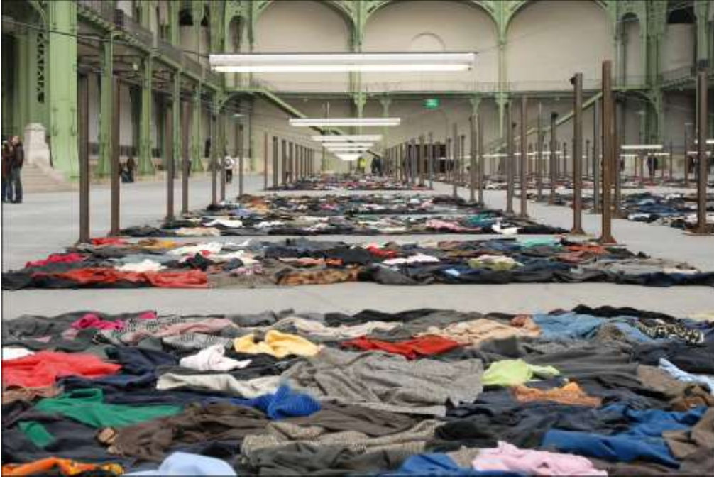
Görsel 6: Christian Boltanski, ‘Personnes’, Monumenta, Grand Palais, Paris, 2010,

bağdaştırmaktadır. Ses ve görüntü odaklı yapılmış olan bu çalışmada Boltanski “insan varlığının sınırları ve hafızanın yaşamsal boyutuna ilişkin daha önceki keşiflerine dayanarak, çalışmalarında yeni bir tema olan kader sorunu ve ölümün kaçınılmazlığını ele alıyor” (Barba, 2010). (URL 6) 6 .