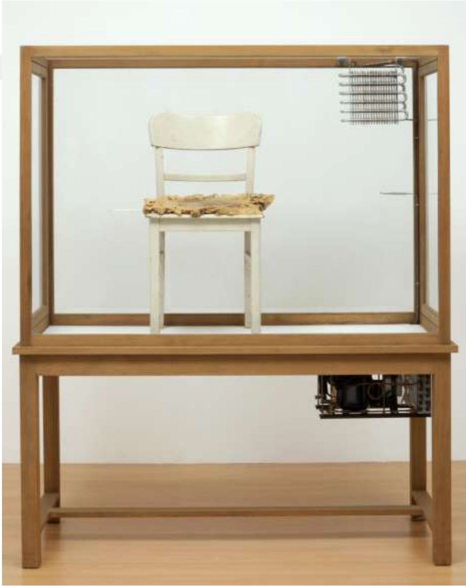
Görsel 2: Joseph Beuys, 'Fat Chair', 1964-85