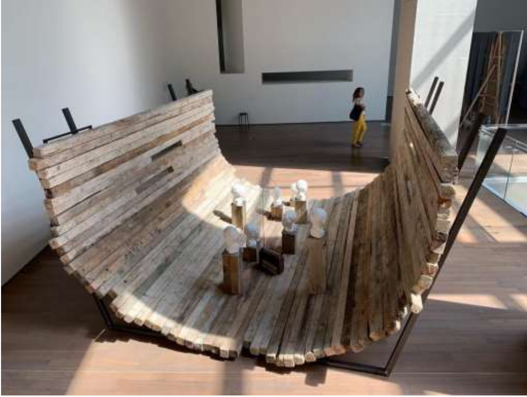
Görsel 18: Radcliffe Bailey, 'Nommo', 2019, İKSV, 16. İstanbul Bienali