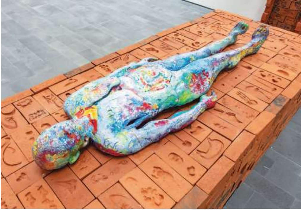
Görsel 15: Mariechen Danz, Body Bricks (Beden Tuğlaları), 2019, (Detay), İKSV, 16. İstanbul Bienali

Orta kısımda yer alan dikdörtgen şeklinin üzerinde, boylu boyunca uzanmış üzerinde birçok farklı rengin yer aldığı bir insan figürü heykeli yer almaktadır.