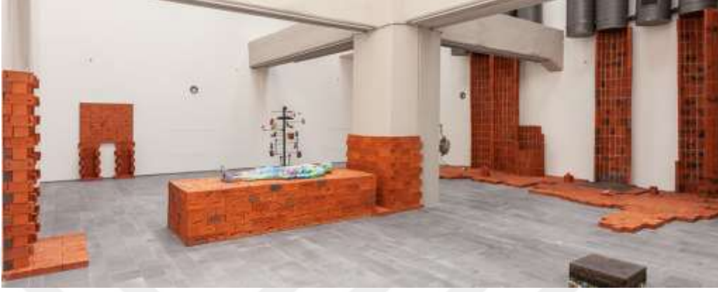
Görsel 13: Mariechen Danz, Body Bricks (Beden Tuğlaları), 2019, İKSV, 16. İstanbul Bienali

Sanatçının insan bedeni ve geçirmiş olduğu değişimler ile ilgili gerçekleştirmiş olduğu bir diğer çalışması ise 16. İstanbul Bienali için yapmış olduğu ‘Beden Tuğlaları’ adlı yerleştirmedir.