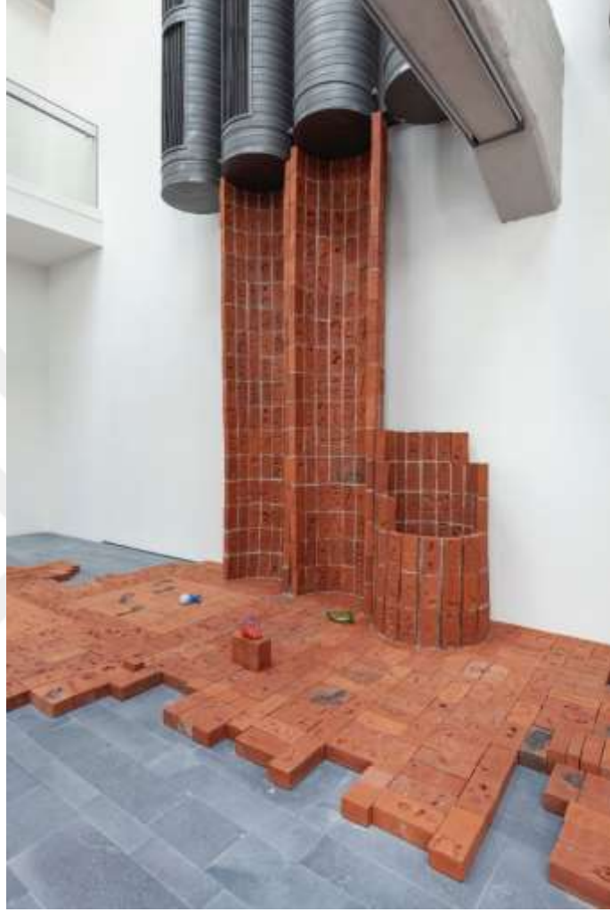
Görsel 14: Mariechen Danz, Body Bricks (Beden Tuğlaları), 2019, (Detay), İKSV, 16. İstanbul Bienali

yan yana olmak üzere tuğlalar birleştirilerek dikdörtgen formunda alanlar oluşturulmuştur.