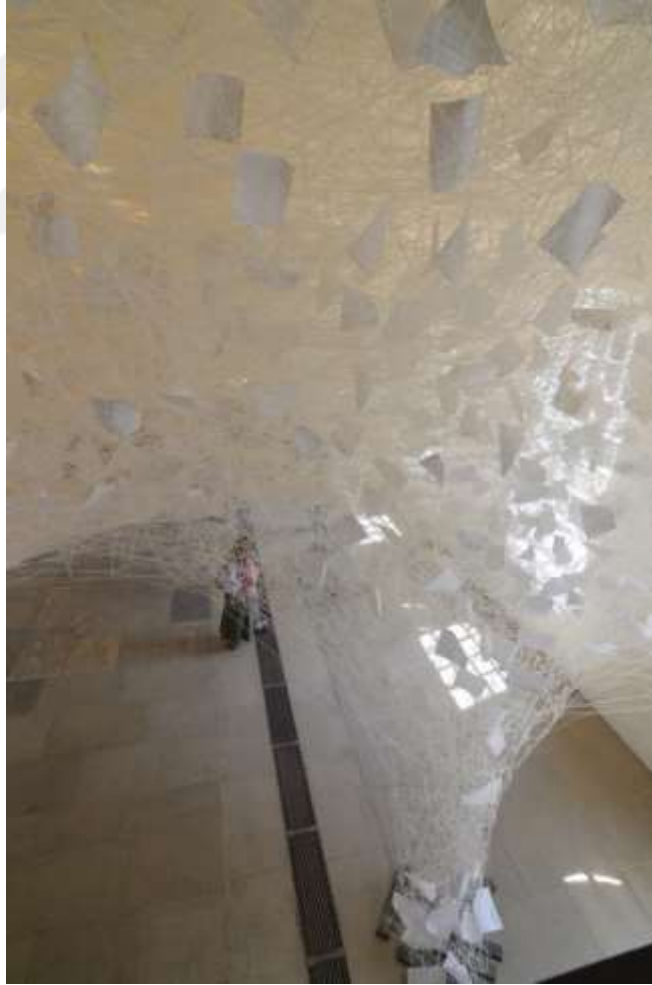
Görsel 12: Chiharu Shiota, 'Beyond Time', 2018, Kâğıtlar (Detay), Yorkshire Sculpture Park, UK

İpler mekanın duvarlarına çivi benzeri sabitleyicilerle tutturulmuştur. İplerin zemine sabitlendiği, dikkati üzerine toplayan nokta çalışmanın merkezinde yer alan siyah renkte piyano çerçevesidir. Metalden yapılmış piyano çerçevesi iki pencere arasında orta kısımda yer almaktadır. Tüm sahne tavan kısmından piyanoya bağlanan iç içe bir iplik ağının içerisinde görünmektedir. Çalışmanın bulunmuş olduğu zemin açık renkli duvarlar ise beyaz renktedir. İpler tavana doğru oval bir şekilde konumlandırılmıştır.