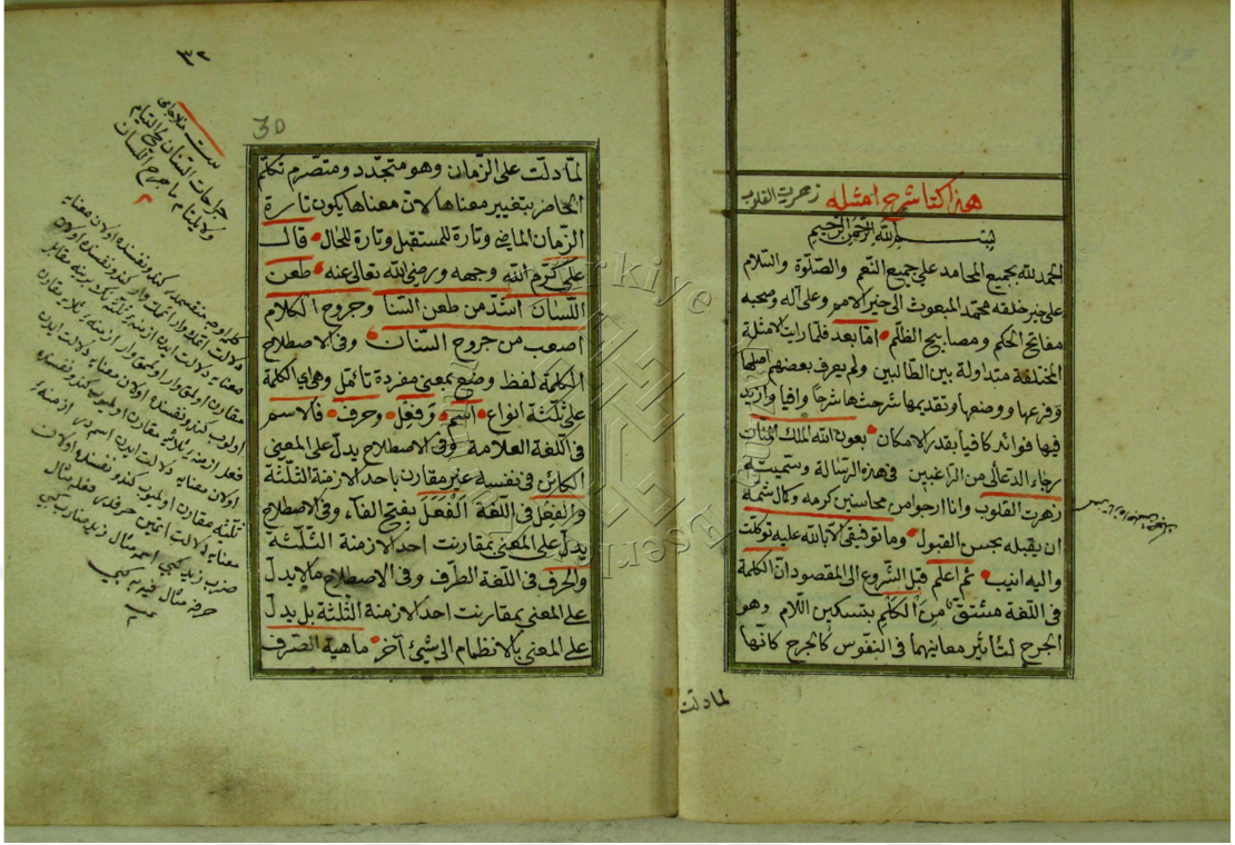
Süleymaniye Kütüphanesi, Süleymaniye Nüshası (س) 1b-2a Varağı