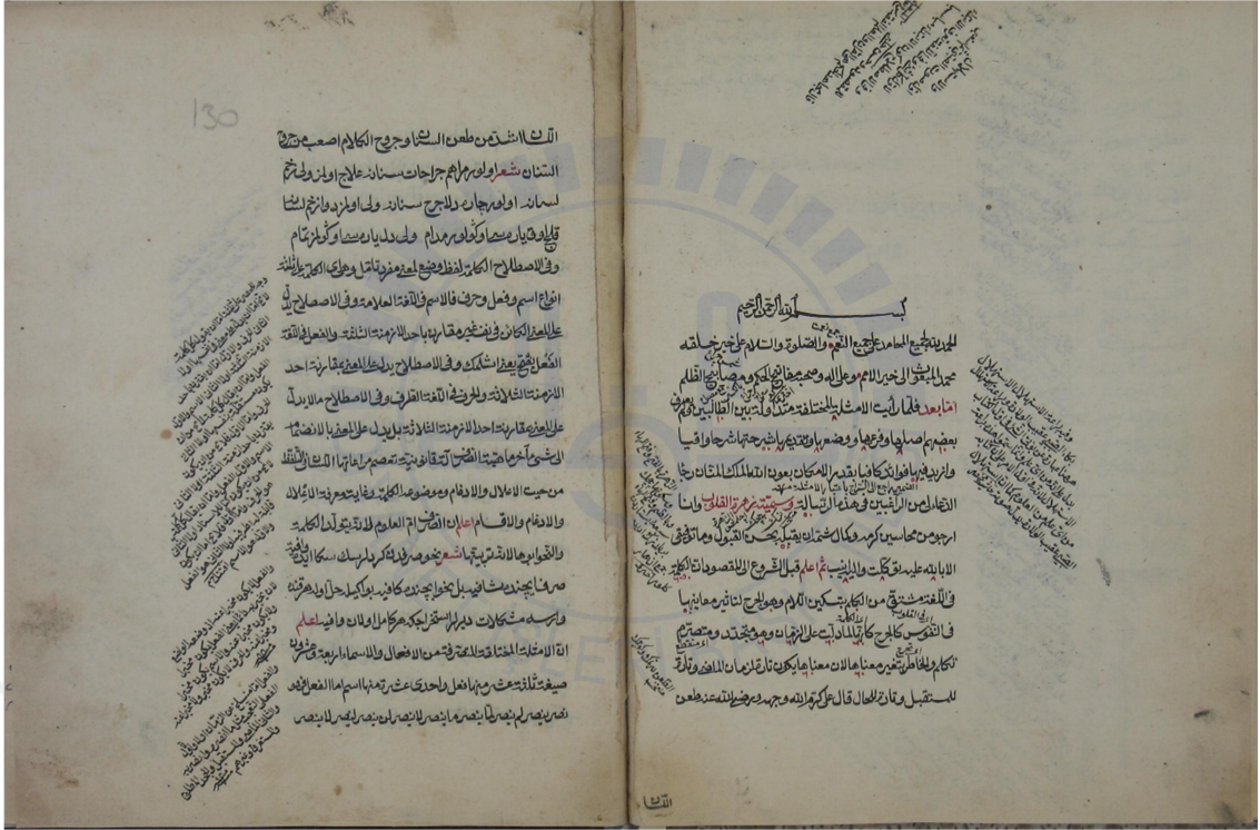
Diyanet İşleri Başkanlığı nüshası (2) Baş Kısım