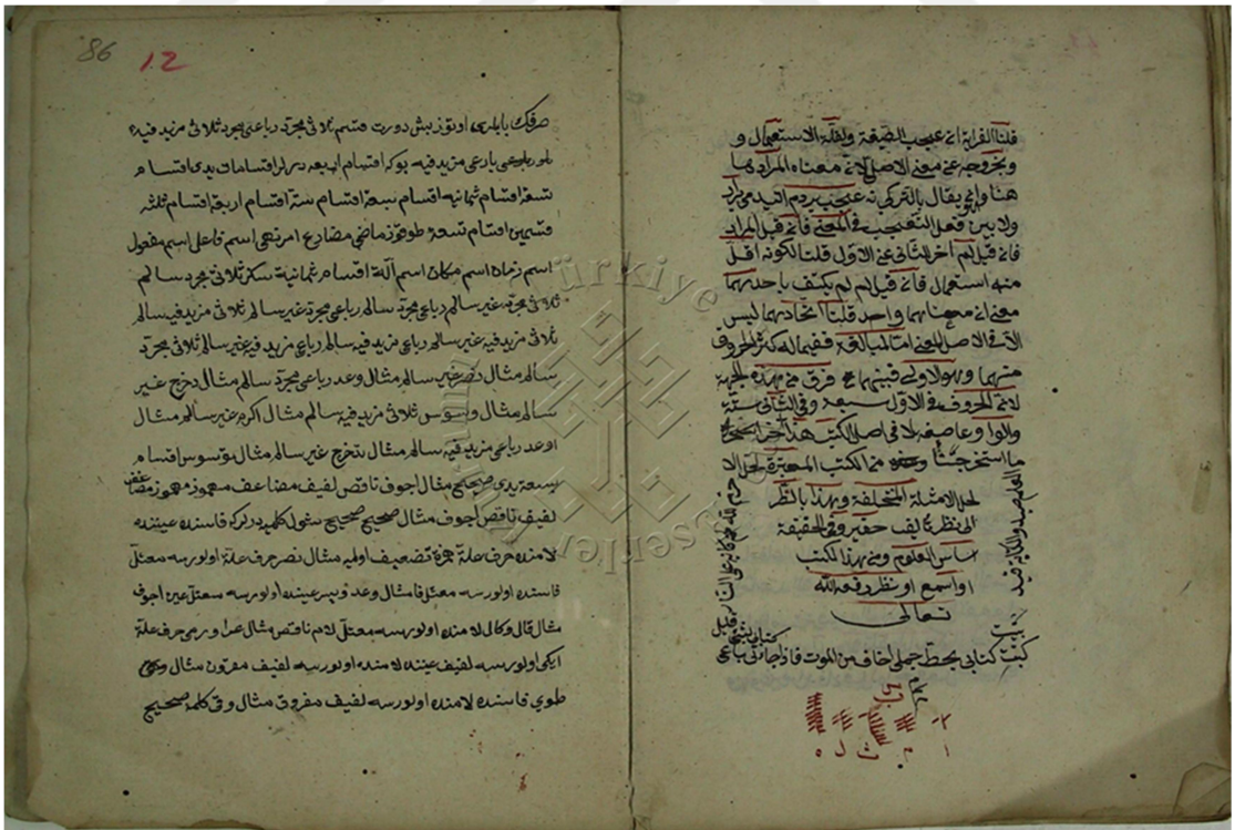
Süleymaniye Kütüphanesi, Yozgat nüshası (ي) Son Kısım