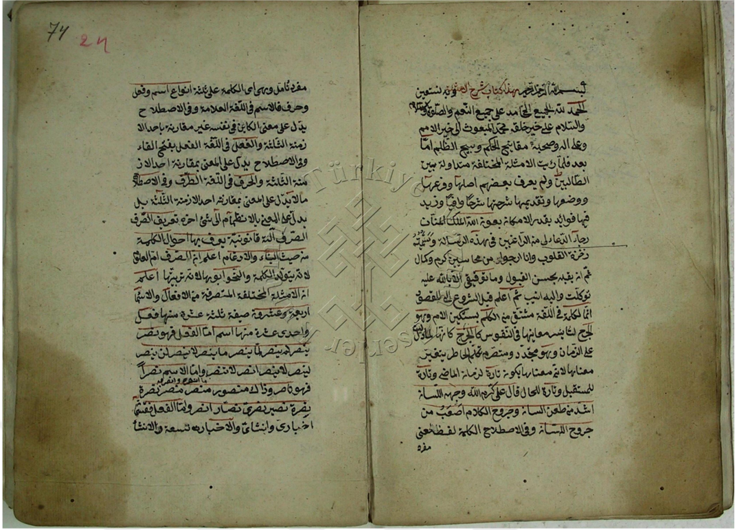
Süleymaniye Kütüphanesi, Yozgat nüshası (ي) 1b-2a Varağı