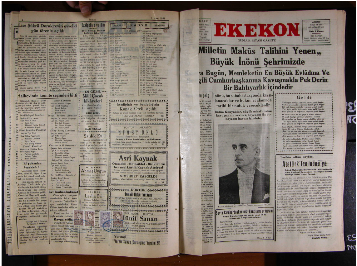
Ek-2: Ekekon, 4 Nisan 1950 Tarihli Sayısı