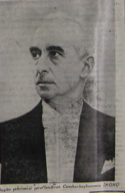
Bu sabah istasyonda karşılanacaklar ve hükümet alanında tarihi bir nutuk verecektir.

Bütün Konyalılar, büyük müftülerin konuşmalarını sevici, heyecanlı ile bir bayram havası içinde.