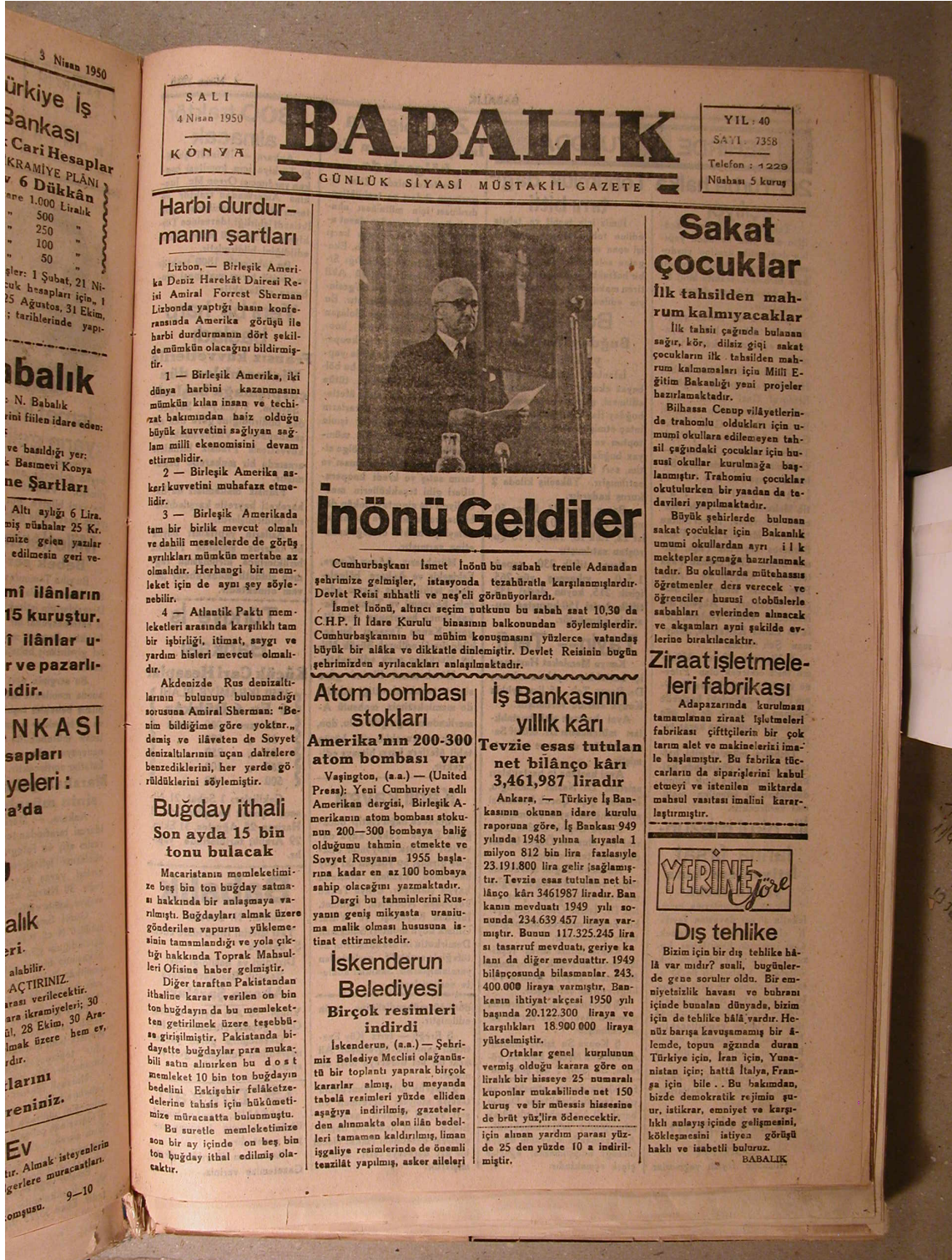
Ek-1: Babalık, 4 Nisan 1950 Tarihli Sayısı