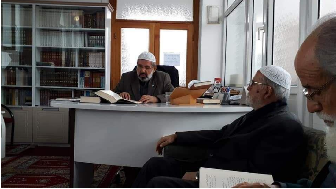
Ek-8. NEÜ AK İlahiyat Fakültesi Camii Derslerinden Bir Kare