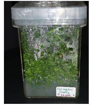
0,2 mg/ml \text{NaN}_3 120 dakika