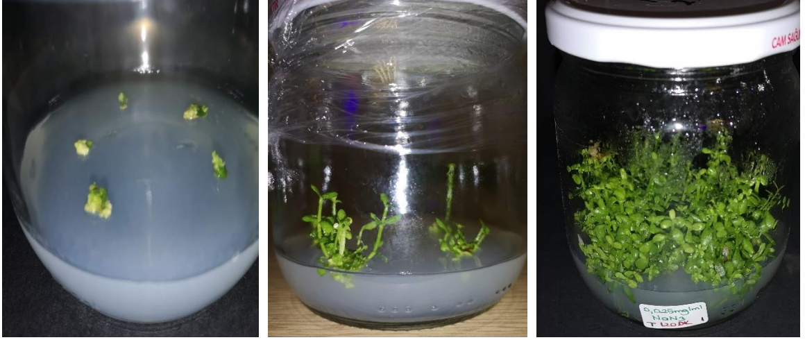
Şekil 6.4. En iyi verim aldığımız parametreler olan 0,025 mg/ml \text{NaN}_3 konsantrasyonunda ve 120 dakikalık süreye maruz bırakılan B. monnieri L. bitkisinin sırasıyla 2, 5 ve 14 haftalık görünüşleri.