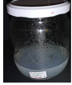
0,2 mg/ml \text{NaN}_3 30 dakika