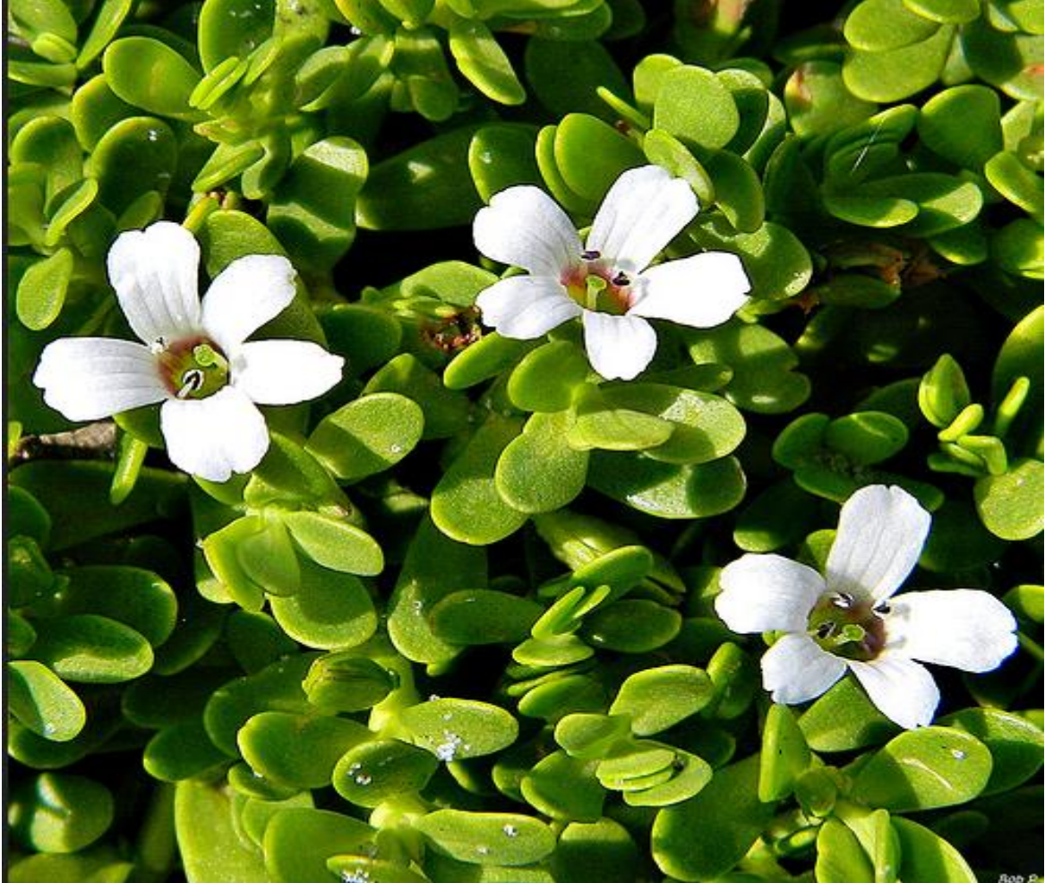
Şekil 1.1. Bacopa monnieri L. bitkisinin genel görünümü.

Plantaginaceae familyasına ait bir bitki olan Bacopa monnieri L., Brahmi adıyla da bilinen yarı sucul bir bitkidir. Sulak alanlarda (örneğin bataklık gibi), sıcak ve nemli bölgelerde yetişmektedir (Behera ve ark. 2016). Dünya üzerinde yoğunluk olarak Doğu ülkelerinde görülmekte olup Hindistan'da bu oran daha yüksektir olmasına rağmen Avustralya ve Amerika'nın Florida eyaletinde de yetişmekte olduğu bilinmektedir (Khare, 2003; Daniel, 2005). B. monnieri başta Hindistan'da olmak üzere tıbbi amaçlarla kullanılmanın yanı sıra, ticarete daha çok kullanılır ve Hindistan'da ihracat edilen bitkilerin arasında 2.sırada yerini alır.