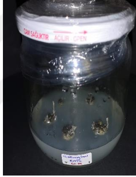
0,05 mg/ml EMS 60 dakika