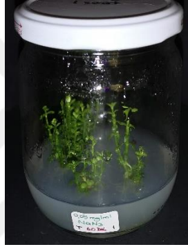
0,05 mg/ml \text{NaN}_3 60 dakika