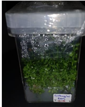
0,05 mg/ml EMS 120 dakika