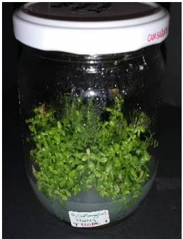
0,025 mg/ml \text{NaN}_3 120 dakika