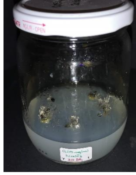
0,05 mg/ml \text{NaN}_3 30 dakika