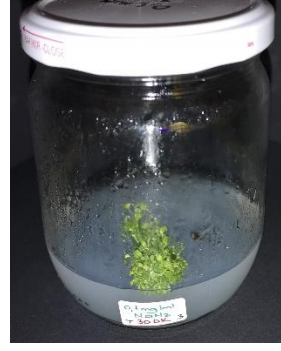
0,1 mg/ml \text{NaN}_3 30 dakika