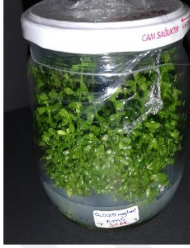
0,025 mg/ml EMS 30 dakika

EK-1: In vitro kořullarda farklı EMS konsantrasyonlarına ve farklı sürelerle maruz bırakılmış B. monnieri L. bitkisi.