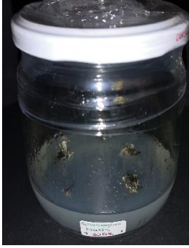
0,025 mg/ml \text{NaN}_3 30 dakika

EK-2: In vitro koşullarında farklı \text{NaN}_3 konsantrasyonlarına ve farklı sürelerle maruz bırakılmış B. monnieri L. bitkisi.