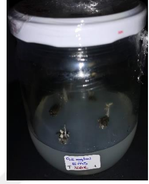
0,2 mg/ml EMS 30 dakika