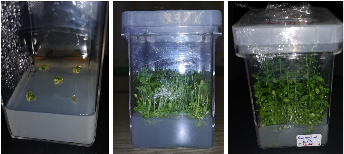
Şekil 6.1. En iyi verim aldığımız parametreler olan 0,2 mg/ml EMS konsantrasyonunda ve 120 dakikalık süreye maruz bırakılan B. monnieri L. bitkisinin sırasıyla 2, 5 ve 14 haftalık görüntüleri.

EMS'de Konsantrasyon ve Süre'ye bağlı parametrelerin sonuçlarında verimi en iyi aldığımız konsantrasyon ve süre 0,2mg/L'de 120 dakika olarak belirlenmiştir.