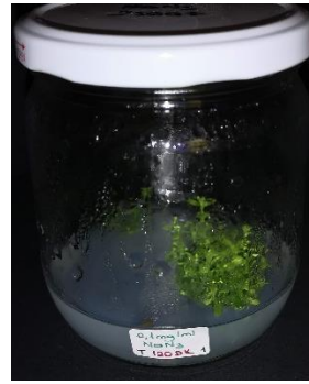
0,1 mg/ml \text{NaN}_3 120 dakika