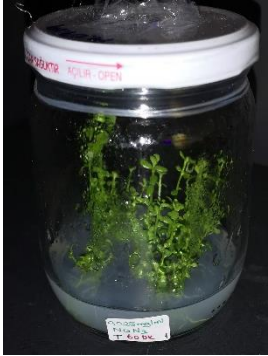
0,025 mg/ml \text{NaN}_3 60 dakika