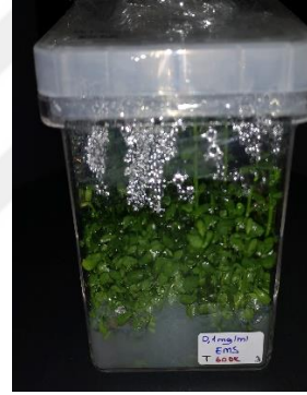
0,1 mg/ml EMS 60 dakika