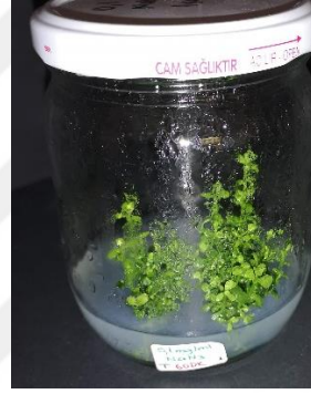
0,1 mg/ml \text{NaN}_3 60 dakika