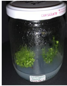
0,05 mg/ml \text{NaN}_3 120 dakika