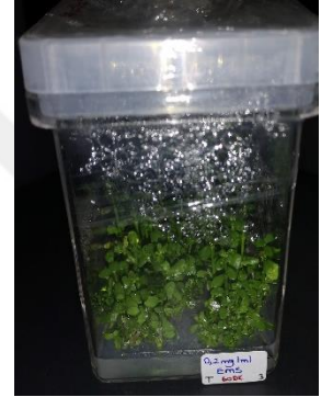
0,2 mg/ml EMS 60 dakika