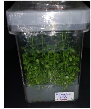
0,2 mg/ml EMS 120 dakika