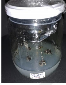
0,05 mg/ml EMS 30 dakika