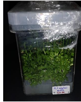
0,1 mg/ml EMS 120 dakika