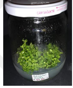
0,2 mg/ml \text{NaN}_3 60 dakika