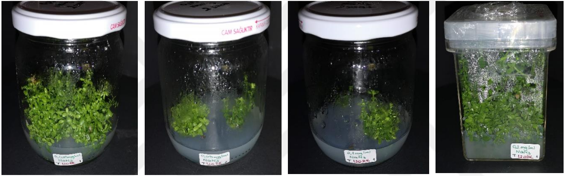
Şekil 6.5. \text{NaN}_3 mutajeninin en iyi süresi olan 120 dakikada 0,0025mg/ml, 0,05mg/ml, 0,1mg/ml ve 0,2mg/ml konsantrasyonlarındaki görünüşleri.