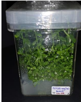
0,025 mg/ml EMS 120 dakika