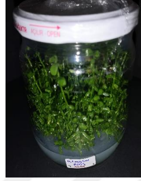
0,1 mg/ml EMS 30 dakika