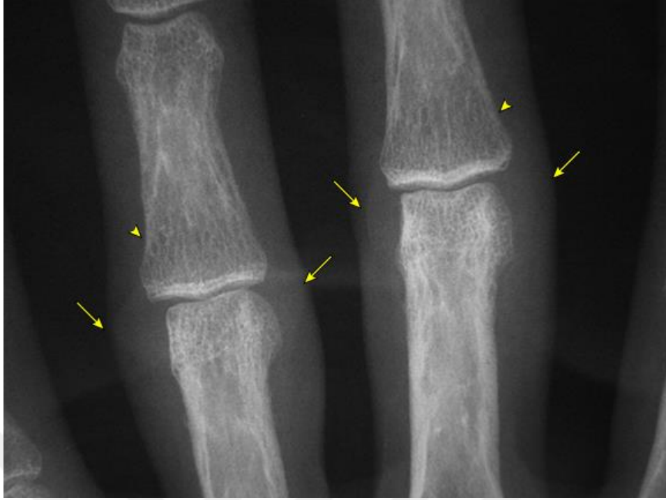
Şekil 2.1. Üçüncü ve dördüncü parmak PİP eklemlerde yumuşak doku şişliği (oklar) ve peri-artiküler osteopeni (ok uçları) (Uptodate, grafik 83905)