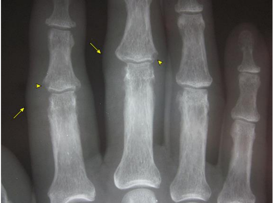
Şekil 2.2. Sağ el PİP ekleminde yumuşak doku şişliği (oklar) ve hafif eroziv değişiklikler (ok uçları) (Uptodate, grafik 85824)