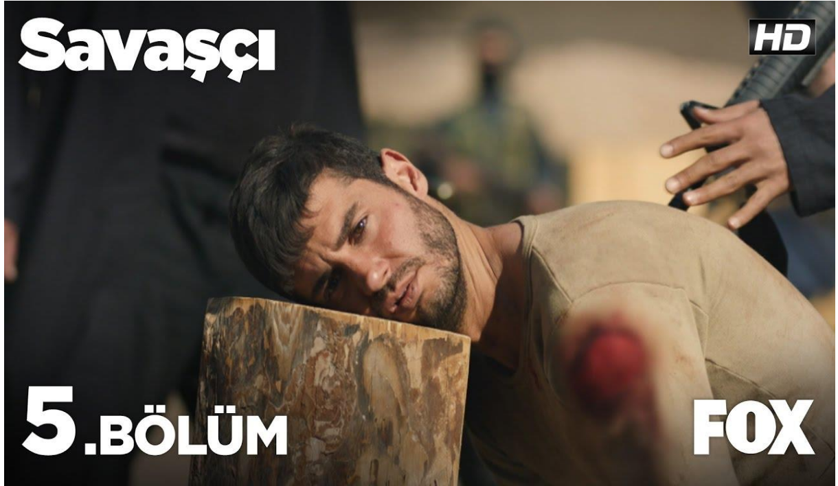
Şekil-1: Kağan'ın Daeş Tarafından İnfaz Edilme Sahnesi

( https://i.ytimg.com/vi/8xnhhefV73k/maxresdefault.jpg ).