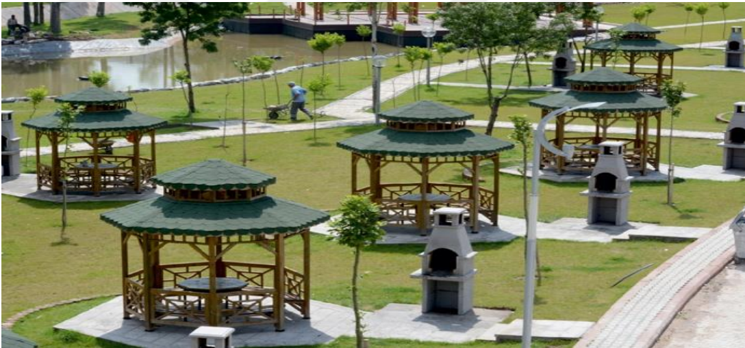
Resim 1 10: Kılıçarslan Parkı (Piknik Alanı)

Kentin tek büyük ve geniş kapsamlı alışveriş merkezi ise EFOR alışveriş merkezidir. Burada çocukların oyun oynayabileceği alanların olması, özellikle haftasonu çocuklarıyla birlikte vakit geçirmek isteyen ebeveynlerin kullandığı mekân haline gelmesini sağlamıştır.