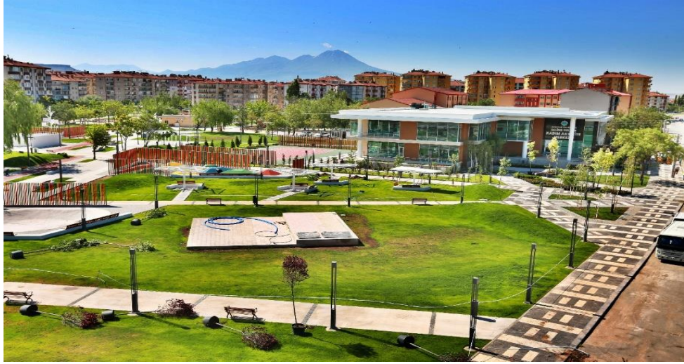
Resim 1 8: Kadın Aktivite Merkezi

Kadınların sosyalleşebilecekleri alanların azlığı, İŞKUR'a ve AKMEK'e (Aksaray Meslek Edindirme Kursu) olan talebi artırmıştır. Bu kurumlara olan talebin artması, mesleki beceri kazandırma ve iş imkânı sağlamalarının yanında, kadınların sosyalleşmelerine de araç olmalarıdır. Ancak, bu faaliyetlerin yanında kadın istihdamının henüz istenilen seviyeye gelmemesi kentin önemli sorunlardan birisi olmaktadır. Günümüzde kadınların eğitim seviyesinin yükselmiş olması ve kamuda istihdam oranının artması önemli bir gelişme olmakla birlikte üst düzey yönetici pozisyonunda bulunamama durumu Aksaray kenti için de geçerlidir.