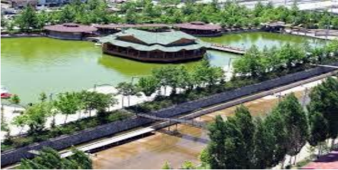
Resim 1 9: Kùltürpark