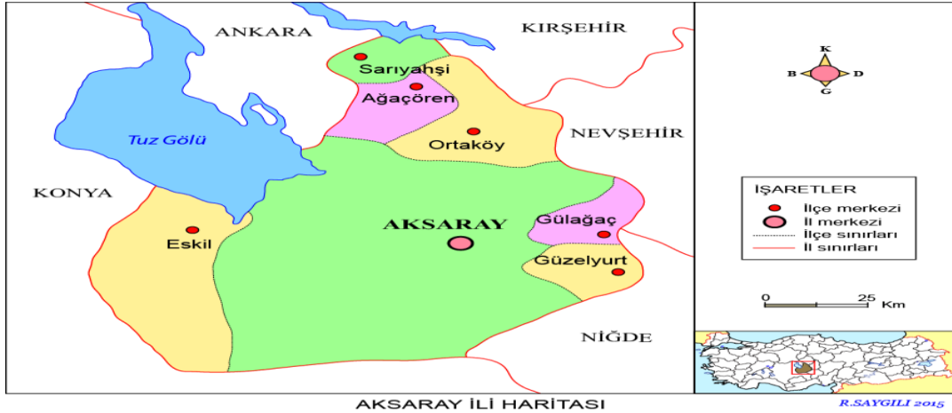
Resim 1 1: Aksaray İl Haritası

Kentin mekânsal alt yapısı Selçuklu Dönemi Türk kentlerinin mekânsal alt yapısıyla benzerdir. Bu dönem kentleri, Türklerin Orta Asya ve İran coğrafyası yerleşim kültürü ve alt yapısı üzerinde birleştirilmiş ortak mekânsal ürünleri olarak tanımlanabilir (Özcan, 2010: 194). Aksaray, Orta Anadolu'nun en eski neolitik yerleşmesine sahip olmasına rağmen, Konya Ovası'nda yer alan Çatalhöyük'ün gerisinde kalmaktadır (Gündoğdu ve Karadal, 2012: 161). Kenti, ortasından geçen "Ulurmak" adıyla anılan büyük bir ırmak ikiye ayırmaktadır. Yerleşmelerin bir kısmı da bu ırmak etrafında görülmektedir. Eskiden büyük bir bataklık olan Ulurmak ve çevresi bugün kentin en gözde mahallerinin bulunduğu yer haline dönüşmüştür.