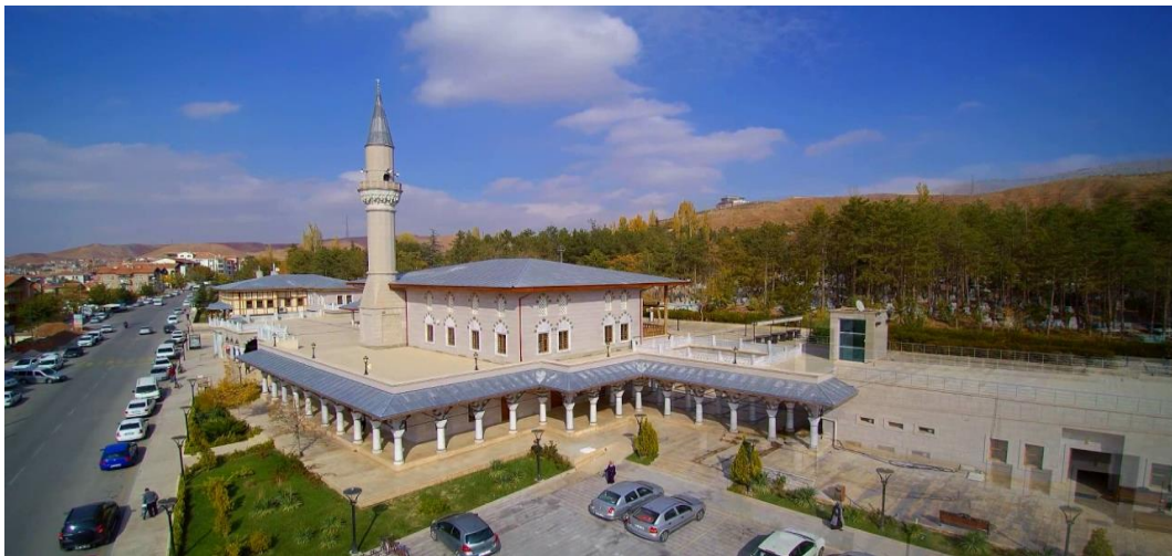
Resim 1 6: Somuncu Baba Külliyesi