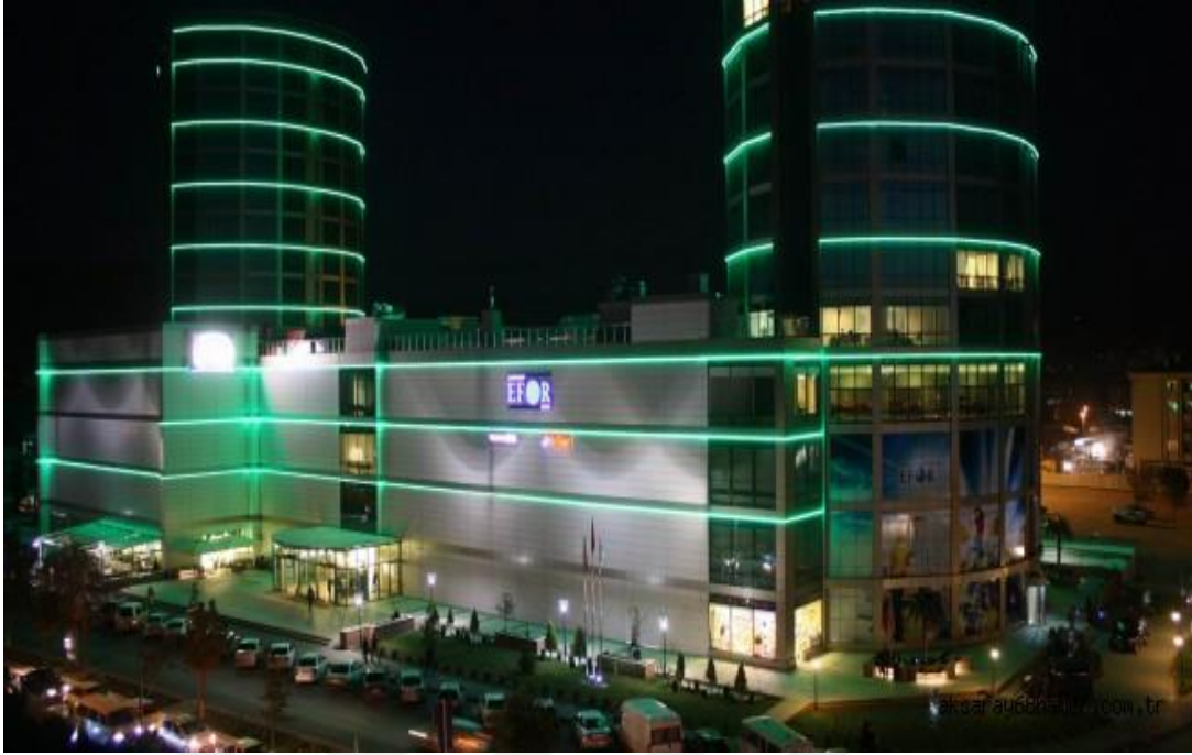
Resim 1 11: Efor Alışveriş Merkezi