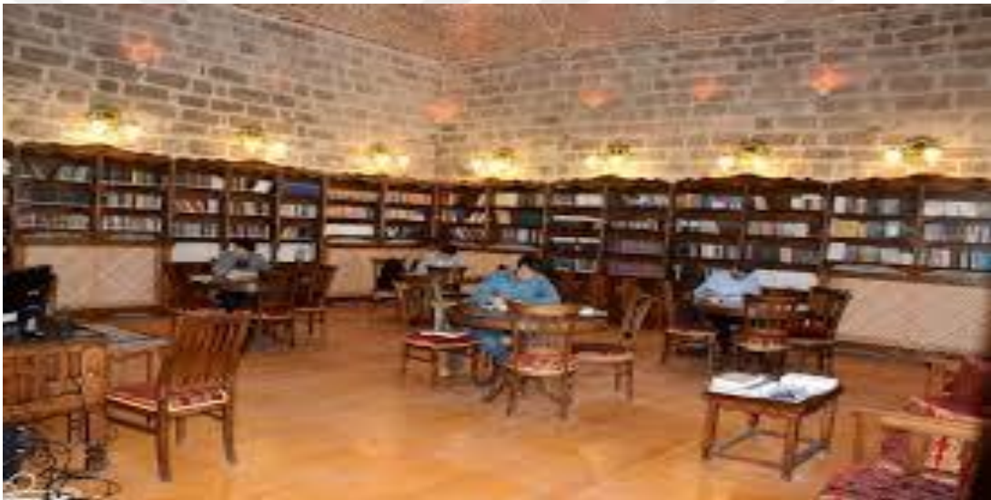
Resim 1 5: Zinciriye Medresesi İç Kısmı (Kütüphane)