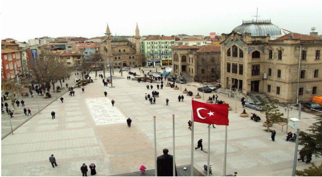
Resim 1 7: 15 Temmuz Milli İrade Meydanı

Kenti temsil eden mekânlardan birisi Hükümet Meydanı olarak da bilinen 15 Temmuz Milli İrade Meydanı'dır. Hükümet Meydanı olarak anılmasının nedeni ise, meydana bulunan üç tarihi binanın 1924-1932 yıllarında hizmet binası olarak yaptırılması ve uzun bir dönem hizmet vermesidir. Kentte genellikle konserler ve mitingler bu meydana yapılmaktadır. Diğer yandan birçok sergiye, yöresel tanıtımlara, sivil toplum kuruluşlarının düzenlediği etkinliklere, anma törenlerine ve Ramazan eğlencelerine de ev sahipliği yapması açısından önemlidir. Çarşı merkezinde yer alan meydana çoğunlukla emekli veya işi olmayan erkeklerin bulunmasından dolayı erilliğin mekânı olarak adlandırılabilir.