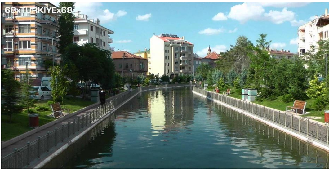
Resim 1 2: Aksaray Ulurmak

Kentin mekânsal alt yapısı Selçuklu Dönemi Türk kentlerinin mekânsal alt yapısıyla benzerdir. Bu dönem kentleri, Türklerin Orta Asya ve İran coğrafyası yerleşim kültürü ve alt yapısı üzerinde birleştirilmiş ortak mekânsal ürünleri olarak tanımlanabilir (Özcan, 2010: 194). Aksaray, Orta Anadolu'nun en eski neolitik yerleşmesine sahip olmasına rağmen, Konya Ovası'nda yer alan Çatalhöyük'ün gerisinde kalmaktadır (Gündoğdu ve Karadal, 2012: 161). Kenti, ortasından geçen "Ulurmak" adıyla anılan büyük bir ırmak ikiye ayırmaktadır. Yerleşmelerin bir kısmı da bu ırmak etrafında görülmektedir. Eskiden büyük bir bataklık olan Ulurmak ve çevresi bugün kentin en gözde mahallerinin bulunduğu yer haline dönüşmüştür.