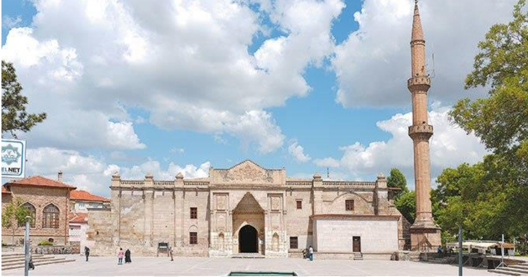
Resim 1 3 : Tarihi Ulucami

Aksaray kent yerleşmesi herhangi bir kent planlaması dikkate alınarak kurulmamıştır. Çarşı merkezi ve iş yerleri genellikle Ulucami çevresinde bulunan en eski yerleşim yerleri olan mahallelerde yoğunlaşmıştır.