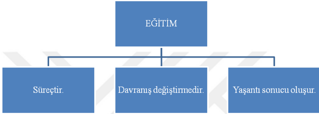
Şekil 1: Eğitim Kavramının Muhtevası

Yaşantı, kişi ile toplum arasında belli düzeydeki etkileşimin bireyde bıraktığı izlenimler olarak tanımlanmaktadır. Eğitimsel açıdan ise kazanılmış ve yaşanılmış yaşantı olarak ikiye ayrılır. Bireylerin birbirleriyle etkileşiminde yer alan etkinliklerin tümü kazanılmış yaşantı; bireylerin birbirleriyle etkileşimi içindeki faaliyetlerden sadece kişide kalıcı bir şekilde iz bırakan ve kişinin hal ve hareketlerinde değişim meydana getiren etkinlikler ise yaşanılmış yaşantı olarak ifade edilir (Sağlam, 2008: 4).