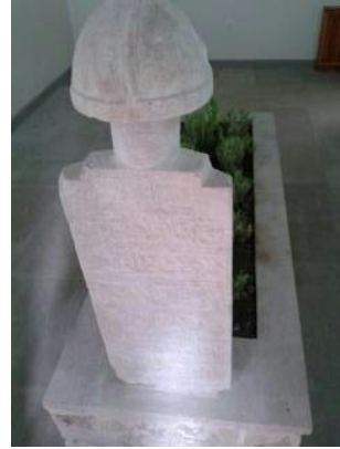
Ali Kemter Dede mezarı