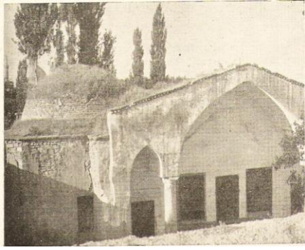
Ali Gâv Medresesi ve eski bir görünüşü (İ. H. Konyalı'dan)

ÜNVER, S., 1967, "Yetmiş Yıl Önce Konya", Belleten , XXXI/122, s.201-220.