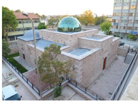
Ali Gâv Tekkesi'nin günümüzdeki durumu