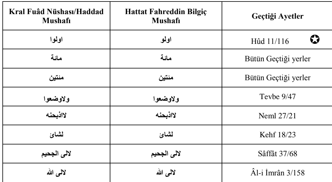
Tablo 2. 3. Kral Fuâd Nüshası/Haddad Mushafı ve Fahreddin Bilgiç Mushafı Elifin Ziyâde Kılınmasının Mukayesesi

İbn Necâh bu bilgilerin peşinden şöyle bir analize yer vermektedir: “Ben bu beş yerin ‘elif’siz yazılmasını tercih ediyorum. Çünkü Mushaf’ların çoğunda bu şekilde geçmektedir. Öte yandan Mushaf’ların (elifin hazfi veya isbatı noktasında) ihtilaf ettiği ve genel kuralın dışına çıkan bu beş yer ile Mushaf’ların (elif Ziyâdesiyle yazımında) ittifak ettiği bir yer –ki o da Neml sûresindeki ‘le’ezbehannehû/لاذبحنه/’dür- hariç Kur’ân’da geçip de telaffuzuna ve aslına dayalı olarak yazılan sair kelimelerle de örtüşmektedir. Neml sûresindeki gelince ben bunu Mushaf’ların icmâına dayalı olarak ‘elif’le yazıyorum” 357