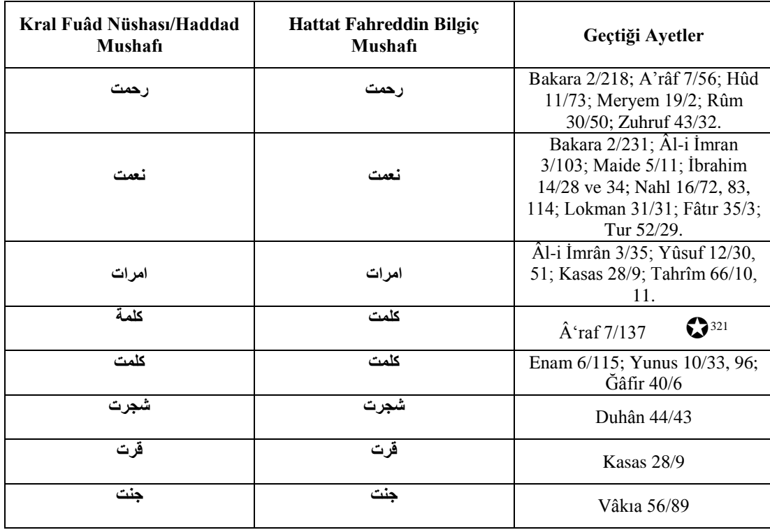
Tablo 2. 2. Kral Fuâd Nüshası/Haddad Mushafı ve Fahreddin Bilgiç Mushafı Sessiz Harflerin Resmedilme (ت-ة) Mukayesesi

Mushaf imlâsına has olarak sessiz harflerin resmedilmesi bağlamında “te’kid nûn” unun imlâsı konusu karşımıza çıkmaktadır. İmlâ meselesine dair olan eserlerden aktarılan bilgiye göre Yûsuf 12/32’de geçmekte olan “le-yekûnen” kelimesi وَلْيَكُونَا şeklinde imlâ edilerek yazıldığı, Alak 96/15’te yer almış olan “le-nesfe’an” kelimesi ise نَسْفَعَا şeklinde “elif” (ل) ile resmedilmektedir. 322 Bu kelimelerle ilgili olarak çalışmamıza konu olan her iki Mushaf’ın da imlâ açısından mutâbakat sağladığı gözlenmektedir. 323