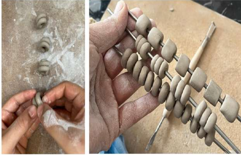
Şekil 3.8. Seramik çamurun şekillendirilerek boncuk yapılması

Demir çubuklara seramik çamuru sarılarak boncuk formları oluşturulmuş ve bir süre bekletildikten sonra çubuklardan çıkarılmıştır. Alternatif bir yöntem olarak, farklı boyutlardaki çamur parçaları delinerek boncuk formu verilmiştir.