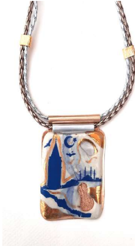
Şekil 1.29. Sibel Sevim, 'K-GBK' metal üzerine seramik dekor lama tekniği ile yapılmış kolye (sibelsevim.com)