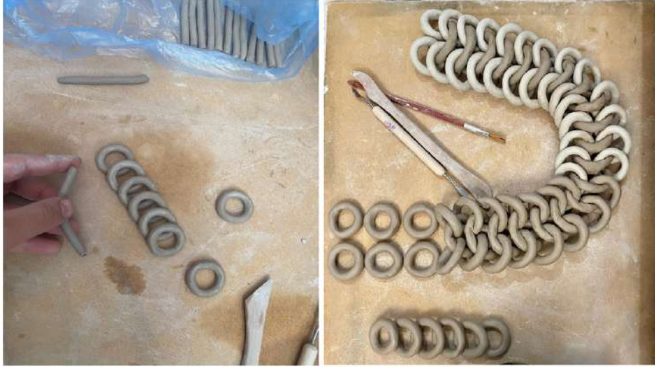
Şekil 3.7. Seramik çamurundan sucuk yöntemi ile oluşturulan halkalar birbirine geçirilerek yapılan kolye yapım aşamasından

Çalışmaların yapımında kullanım açısından rahatlık sağlaması ve oluşabilecek çatlakları en aza indirmek için ince taneli şamotlu kil tercih edilmiştir. İnce taneli şamotlu kilin taneciklerinin ufak olması daha pürüzsüz ve üzerine rahat işlem yapılması açısından kolaylık sağlamaktadır. Çalışmanın bu kısmında ince sucuklar yapılarak halkalar elde edilmiştir. Oluşturulan halkalar birbirine geçirilerek bir örgü formu ortaya çıkarılmıştır.