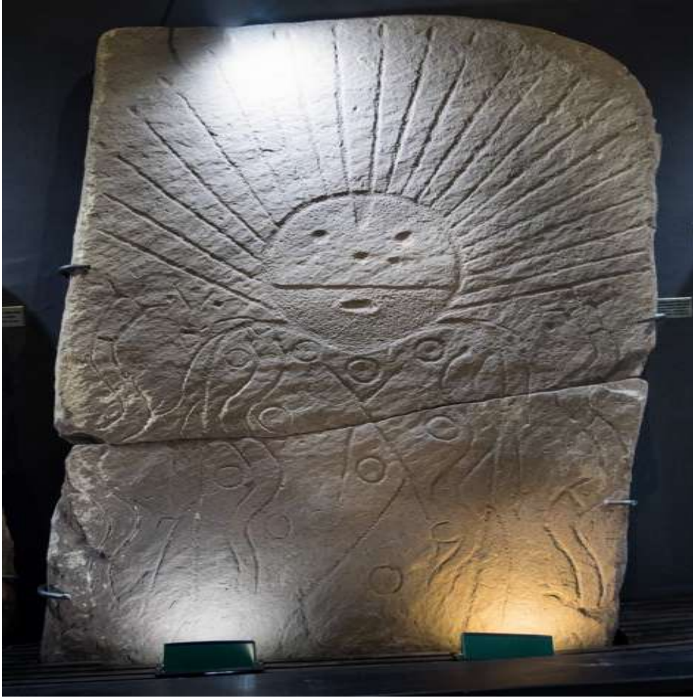
Şekil 2.9. Okunev taş oymasında güneş tasviri, (Bozdemir, 2023)

sahip olduğuna inanılmıştır. Gök kubbe ve dünya kavramlarını ifade eden figürler, güneş ve ay sembollerinin yanı sıra ayinlerde ve imparator kıyafetlerinde de yer almıştır. İmparatorun dört atlı, iki tekerlekli savaş arabası, evrenin sembollerinden biri olarak kabul edilmiştir. Arabanın tekerleklerinin güneşi, çarkının ise ayı simgelediği inancı yaygındır. Bu semboller, evrenin düzenini ve kozmik dengeyi temsil etmek amacıyla tasvir edilmiştir (Ersin, 2004: 63).