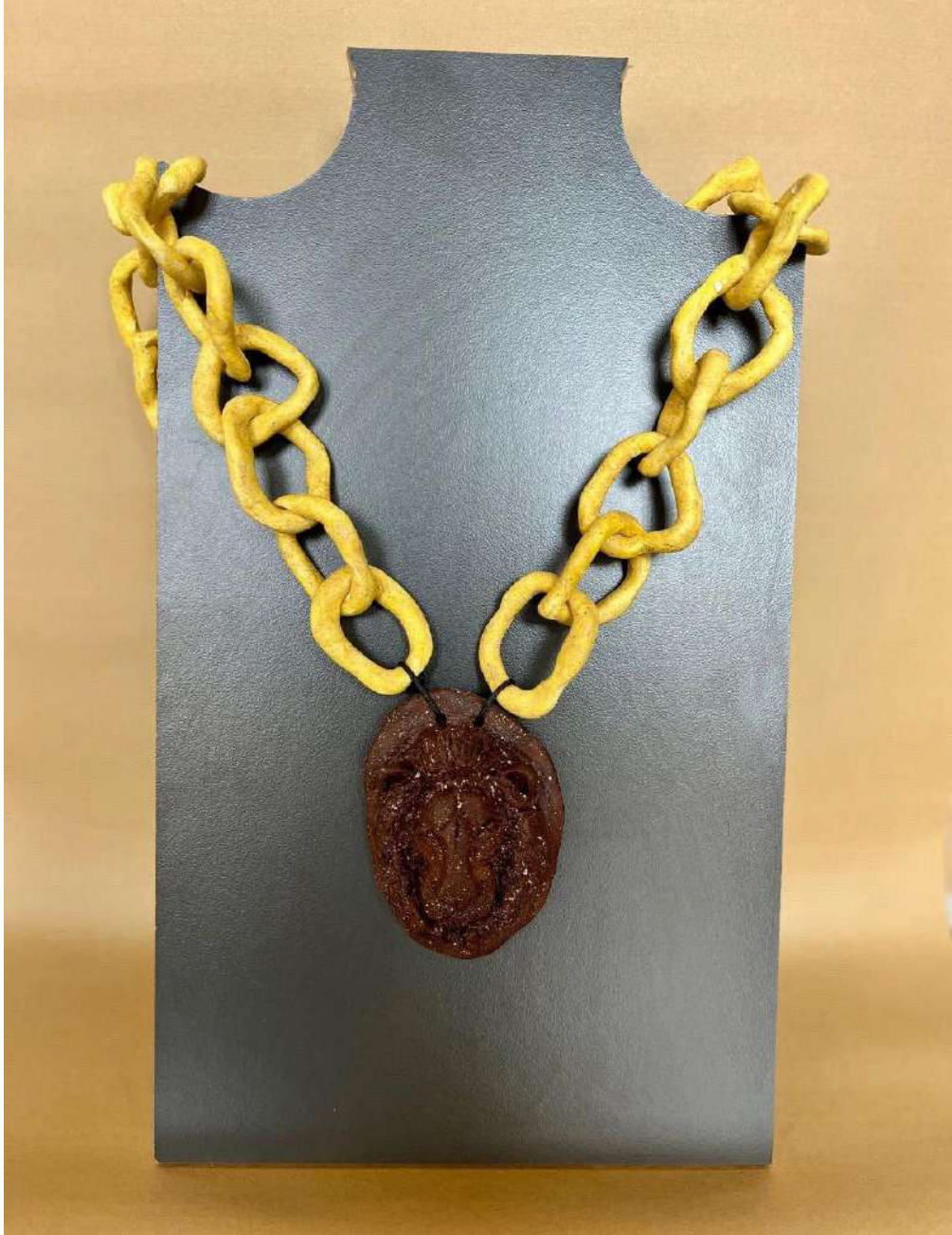
Şekil 3.31. Aslan figürlü kolye tasarımı, elle şekillendirme, 1050°C, 2024 Aslan figürüne kahverengi sır uygulaması yapılmıştır. Zincirlere ise sarı renkli sır uygulanmıştır. Tasarımın birleşim kısımları ince deri ipele birleştirilmiştir.