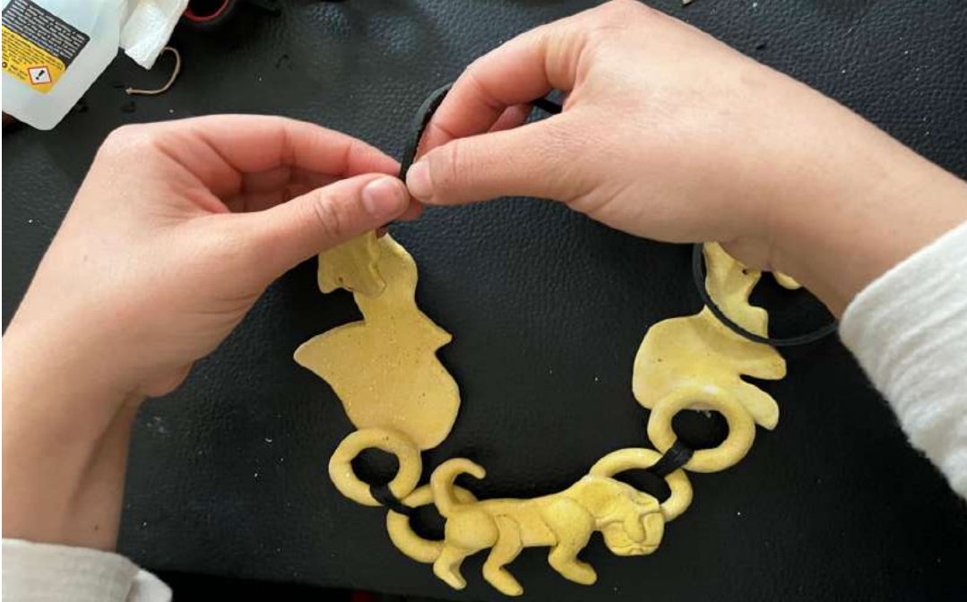
Şekil 3.19. Kolye yapım aşamasından.

İkinci pişirimi tamamlanan ürünler biçimlerine göre ayrılarak takı yapımına başlanmıştır. Bu biçimler; zincirler, boncuklar ve rölyeflerin olduğu parçalar ayrılarak montaj aşamasına geçilmiştir.