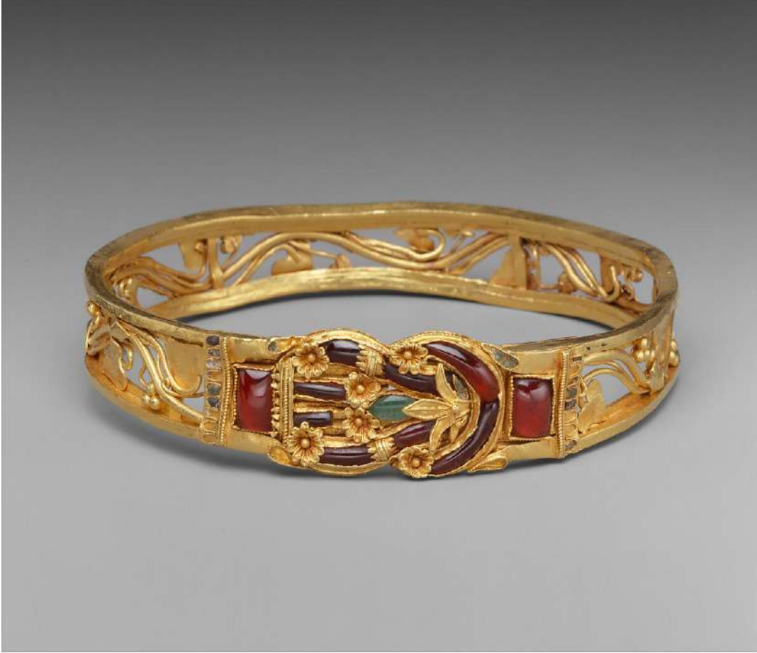
Şekil 1.4. Herakles Düğümü, Helenistik Dönem, M.Ö. 2-3.yy. Metropolitan Sanat Müzesi (metmuseum.com)

Helenistik Dönemde'deki takılarda altın kullanımı yaygınlaşmıştır. Helenistik dönemdeki bileziklerde yaygın bir şekilde aslan başları, boğa, koç, vaşak, dana ve köpek figürleri kullanılmıştır. Bileziklerde yılan başları da yaygın olarak kullanılmaktadır. Bileziklerin biçimi bir ucu yılan başı bir diğer ucu yılan kuyruğu olacak şekilde tasarlanmıştır. Bazı bileziklerde mitolojik deniz yaratıkları görülmektedir. Erken Helenistik Çağ'da mühür oymalı yüzükler kullanılmıştır. Bu yüzüklerde mühür renkli taşlardan ya da camdan yapılmıştır. Yüzüklerin metal kısımlarında figürler kazınmıştır. Helenistik Dönem'de bir diğer takı türü kolyelerdir. Kolye takı formları, göğsün hemen altında yer alacak şekilde tasarlanmış ve dört bir yandan Herakles düğümü ile bağlanmıştır. Bu dönemdeki takıların en önemli özellikleri, gösterişli ve figürlü olmalarıdır (Koroğlu, 2004:30).