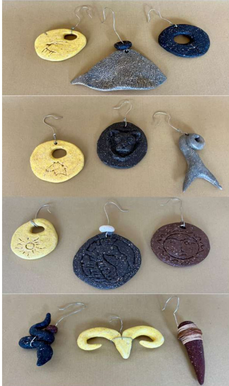
Şekil 3.48. Türk mitolojisinde bulunan güneş, balık, ejderha, keçi, yılan, geyik, kartal ve aslan figürlerin stilize edilmiş küpe tasarımları, elle şekillendirme, 1050°C, 2024

Küpelelerin figür kısımları çeşitli sırlarla renklendirilerek oluşmaktadır. Küpeleri oluşturan seramik parçalar alüminyum telle bir araya getirilerek küpe formu verilmiştir.