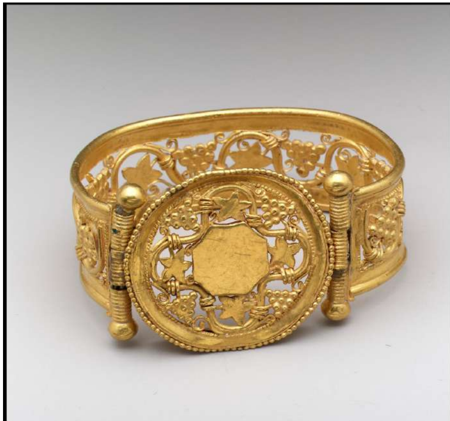
Şekil 1.6. Asma motifli bilezik, 2,2 x 13,8 cm, 6.-7. yy, Metropolitan Sanat Müzesi(metmuseum.com)

Orta Bizans Dönemi, Bizans'ta takı anlayışının en gelişmiş olduğu dönemdir. Halk arasında takıların statü amaçlı kullanıldığı bilinmektedir. İmparatorluk yönetiminde ise takılar rütbe ve sınıfsal farklılıkları göstermek amacıyla kullanılmıştır. Bizans İmparatorluğu'nda dini yöneticilerinin de takı kullandığı bilinmektedir. Bu takılarda Hristiyanlık ile ilgili sembollere ve figürlere rastlanılmaktadır. Bizansların kullandığı takılarda mücevher, kakma ve altın yaldızlar sıklıkla kullanılmıştır (Kavrakoğlu, 2015).