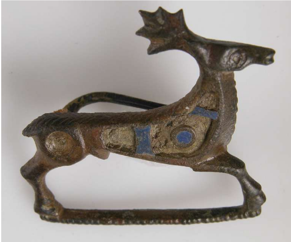
Şekil 1.5. Geyik şeklindeki Roma broşu, 3.5 x 3.8 x 1,3 cm, 2.yy. Metropolitan Müzesi

Roma Dönemi’nde ait küpelerde de çeşitlilik vardır. Roma Dönemi’nde kullanılan küpe tiplerinden bazıları, sarkaçlı halkalı küpeler, yarım küre şeklinde küpeler ve altın montürlü sarkaçlı küpelerdir. Roma Dönemi’nde yüzükler de takı türleri arasında oldukça yaygın bir şekilde kullanılmıştır. Hem kadınlarda hem erkeklerde yüzük kullanımı oldukça yaygındır. Süs eşyası olarak kullanımlarının yanı sıra, yüzükler aynı zamanda rütbeleri belirtmek için de kullanılmaktadır. İlk kez nişan ve evlilik yüzüğü Romalılarda kullanılmıştır (Şenocaklı, 2008:17).