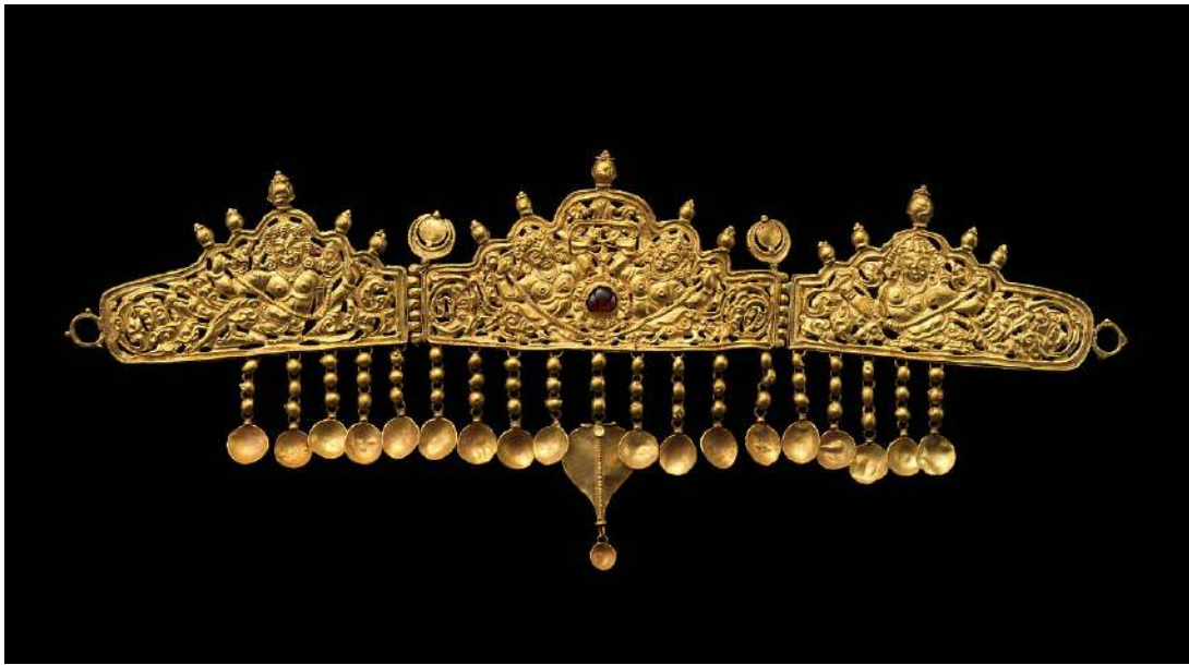
Şekil 1.8. Kinnarisli taç, Hindistan, 11.8x 23.3cm, 9-10.yy. Metropolitan Müzesi (metmuseum.com)

kadar olan dönemde, metal kullanımının takı üretiminde yaygın olmadığı, bunun yerine boncuktan takıların üretildiği ve ticaretinin yapıldığı bilinmektedir. Boncuk yapımı, dönemin gereksinimlerine uygun olarak, basit ve ekonomik bir yöntem olarak tercih edilmiştir. Kullanılan boncuklar farklı renklerde olup, bazılarında ek süslemeler yapılmıştır. Boncuk üretimi, genç yaşlardan itibaren öğrenilen bir beceri olup, nesiller boyunca aktarılmıştır. Hindistan'da takı kullanımı genellikle kadınlar arasında yaygınken, zamanla takı yapım tekniklerinde gelişmeler kaydedilmiş ve süslemelerde değerli taşlar kullanılarak takılar daha gösterişli hale getirilmiştir. Eski kültürlerin çoğunda takılar, ölümlerle birlikte gömülürken, Hindistan'da takılar genellikle ölümler yanında değil, çocuklarına miras olarak bırakılmıştır. Günümüzde ise takı yapımı, geleneksel yöntemlerle devam etmektedir. Hindistan halkı, özellikle nikah ve çeşitli törenlerde takıları sembolik bir anlam taşıyan önemli bir aksesuar olarak kullanmaktadır (Şenocaklı, 2008: 38).