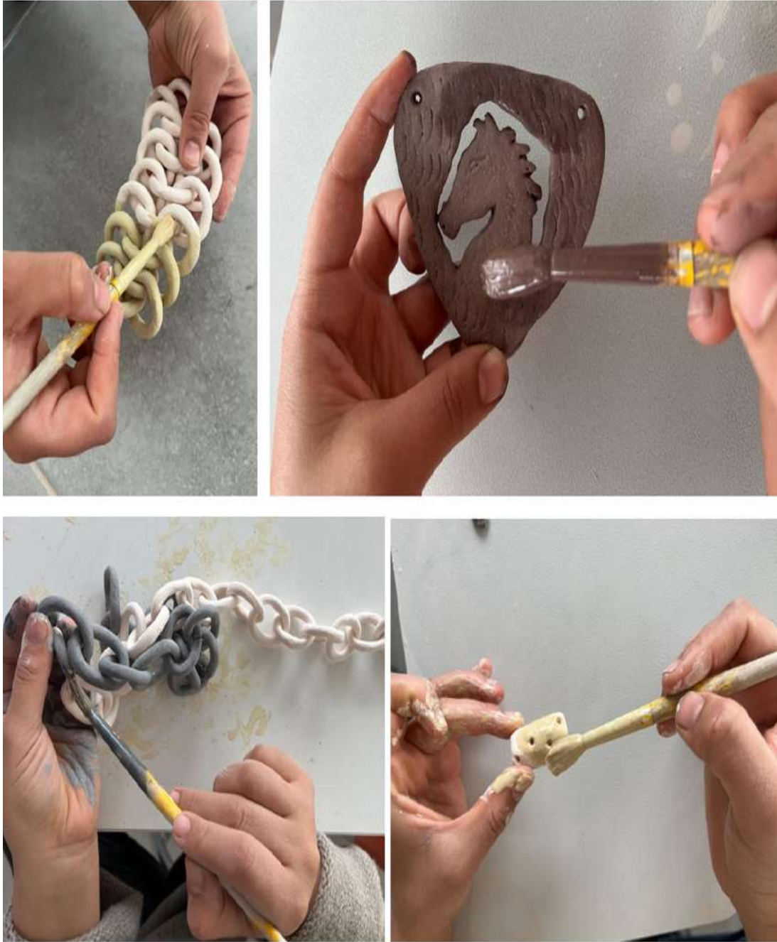
Şekil 3.15. Seramik takıların sırlanma aşaması

Kurutulma işlemi tamamlanmış takı formları ilk fırınlanma işlemi için fırına yerleştirilmiştir. Ürünlerin pişirimleri elektrikli fırında, 980°C derecede gerçekleştirilmiştir.