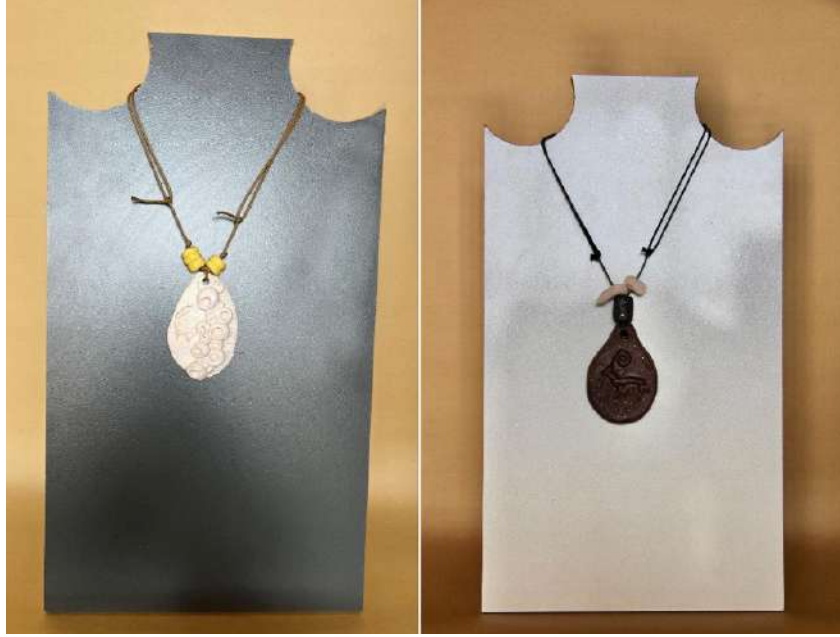
Şekil 3.28. Keçi figürlü kolye uçları, elle şekillendirme, 1050°C, 2024.