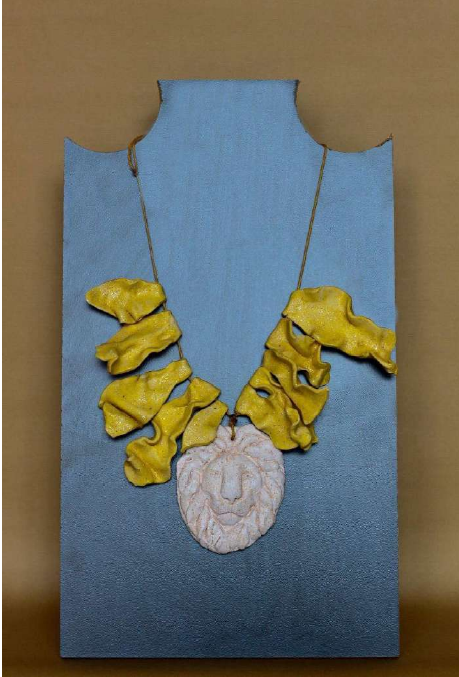
Şekil 3.32. Aslan figürlü kolye tasarımı, elle şekillendirme, 1050°C, 2024

Aslan figürünün kullanıldığı bir diğer kolye tasarımında kolye ucunda beyaz renkli sır kullanılmıştır. Kolyenin gövde kısmında sarı renkle sırlanmış kıvrılmış plakalar kullanılmıştır. Parçaların bir araya getirilmesi için sarı renkli ipe dizilerek kolyenin son formu verilmiştir.