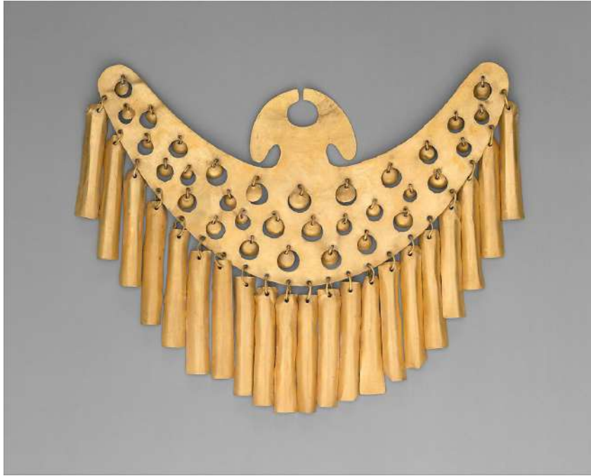
Şekil 1.17. Kolombiya’da bulunan bir burun takısı, 1.-7.yy, Metropolitan Sanat Müzesi

Broş, fonksiyonel bir amacı olmayan, yalnızca süsleyici bir takı olarak tanımlanabilir ve bu sınıflandırmaya dahildir. Eğer bir broş, belirli bir kurumu, statüyü veya kimliği simgeliyorsa, bu tür takılar "rozet" olarak adlandırılmaktadır. 19. yüzyılda Avrupa’da broşlar, özellikle yaygın şekilde kullanılan takılar arasında yer almıştır. Sanayi Devrimi'nin etkisiyle hız kazanan endüstriyel üretim sürecinde, takılar belirli bir toplumsal sınıfa ait olmaktan çıkmış ve geniş bir kitle tarafından kullanılmaya başlanmıştır. Günümüzde, broşlar yalnızca estetik değeri olan sanat objeleri olarak değerlendirilmektedir. Takı tasarımcısı Partington tarafından üretilen broş serileri, yüksek sanat değeri ve estetik yönleriyle dikkat çeken örnekler arasında yer almaktadır.