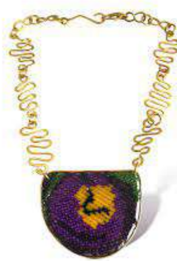
Şekil 1.30. 'Beyaz Aşk Serisinden', 2018, Porselen kili ve bronz karışımı kolye