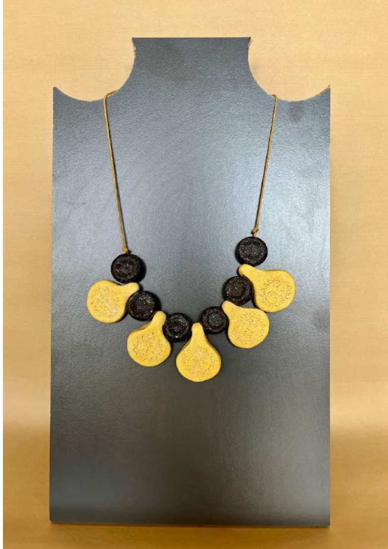
Şekil 3.33. Güneş biçimli gerdanlık tasarımı, elle şekillendirme, 1050°C, 2024

Güneş biçiminin stilize edildiği gerdanlık tasarımı, çeşitli formlar ve boncuklardan oluşmaktadır. Boncuklar siyah renkte, figürler ise sarı renkte sır ile kaplanmıştır. Gerdanlığın boncukları ve figürleri, sarı renkli ipe dizilerek tamamlanmıştır.