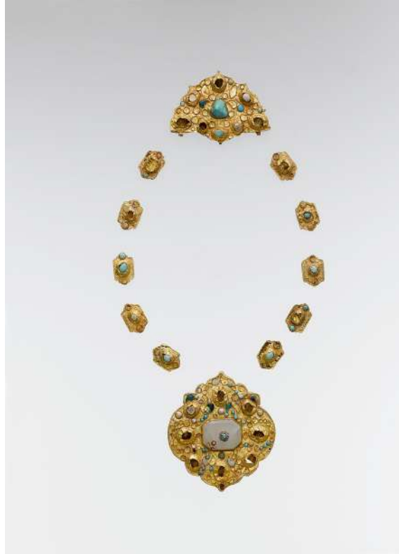
Şekil1.10. 14.-16.yüzyıldaki takı örneği, Metropolitan Müzesi(metmuseum.com)