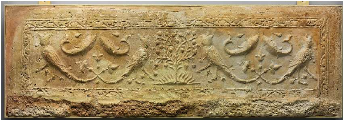
Şekil 2.2. Balıklar, kuşlar ve ağaçların olduğu bir pano, 11.-12.yy., Metropolitan Sanat Müzesi. (metmuseum.com)

Orhun Yazıtlarında, üç balığın yaratılması ve bunun dünyadaki dengeyi sağladığına inanılmaktadır. Birinci balığın kafasının doğuyu, ikinci balığın kafasının batıyı, üçüncü balığın kafasının ise kuzeyi gösterdiği düşünülmektedir. Balığın hareket etmesiyle birlikte tufanın gerçekleşeceği inancı da bulunmaktadır. Yakut mitolojisinde, Baykal Gölü üzerinde devasa büyüklükte bir balığın varlığından bahsedilmektedir. Bu balığın adı Arağıt olarak bilinmektedir. Ayrıca Baykal Gölü, Arağıt Bayağal Gölü olarak da bilinmektedir (Bilgili, 2017: 23-30).