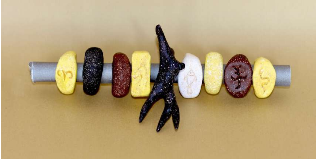
Şekil 3.47. Türk mitolojisinde bulunan bazı figürlerden yüzük tasarımları, elle şekillendirme, 1050°C, 2024