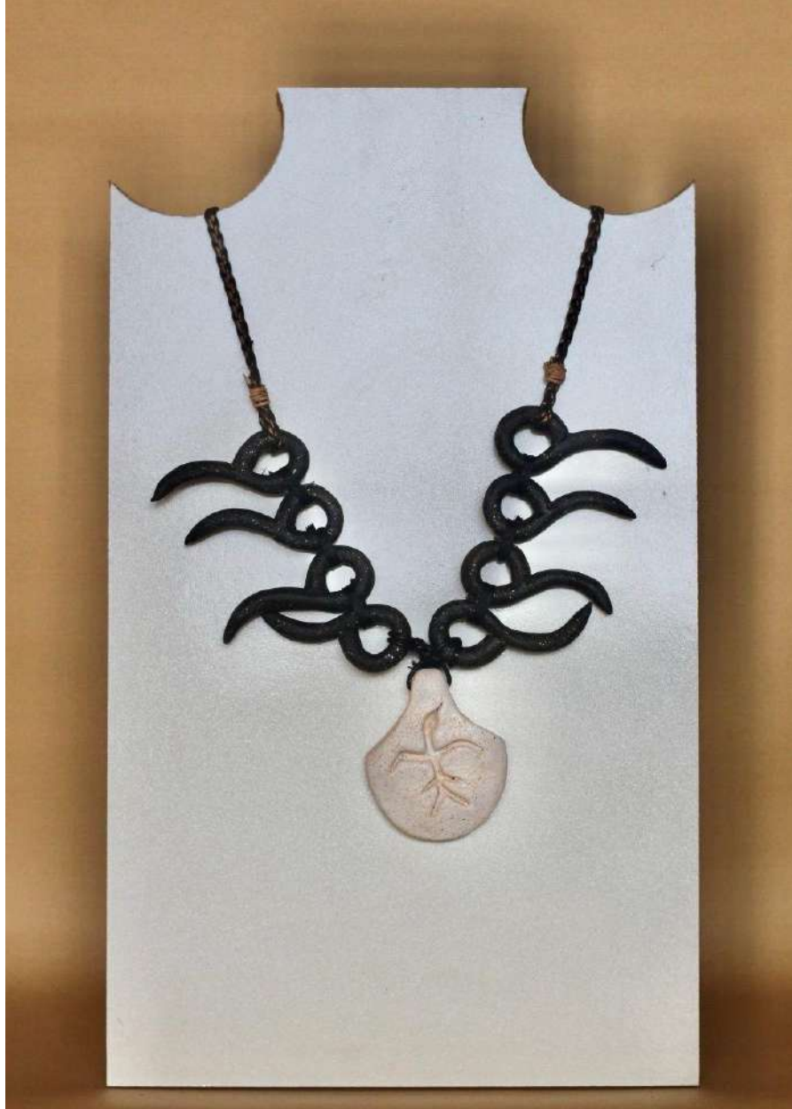
Şekil 3.40. Kartak figürlü kolye tasarımı, elle şekillendirme, 1050°C, 2024

Kolyenin uç kısmı kartak figürü kazınarak elde edilmiştir. Oluşturulan kolye ucu beyaz sırla renklendirilmiştir. Kolyenin gövdesindeki boncuklar ince sucukların kıvrılarak boncuk formu oluşturulmuştur. Kıvrılarak elde edilen boncuklar siyah sırla renklendirilmiştir. Kolye ucu ve kıvrımlı sucuklar siyah kalın ip yardımıyla birleştirilerek kolye formu verilmiştir.