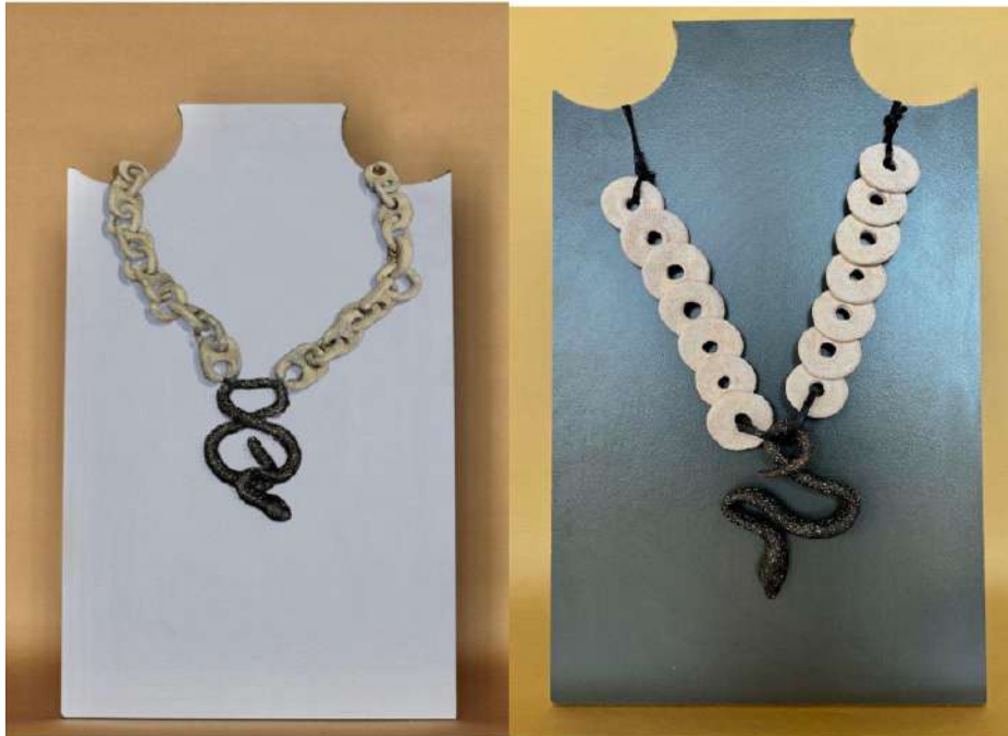
Şekil 3.29. Yılan figürlü kolye tasarımları, elle şekillendirme, 1050°C, 2024.

Yılan figürünün kullanıldığı bu kolyede, kolye ucu siyah renkli sır ile renklendirilmiştir. Seramik halkalardan oluşan zincirde ise beyaz sır kullanılmıştır. Bağlantı kısımlarında deri ip ve örgü ip kullanılmıştır.