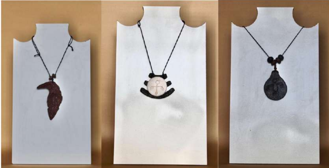
Şekil 3.25. Kartal figürlü kolye, elle şekillendirme, 1050°C 2024, Fotoğraf: Leyla Arslan

Türk mitolojisinde yer alan balık kuyruğu stilize edilerek kolye uçlarında kullanılmıştır. Balık figürleri gri renkli sır ile renklendirilmiş, kolye uçları ise ince plastik deri iplerle birleştirilmiştir.