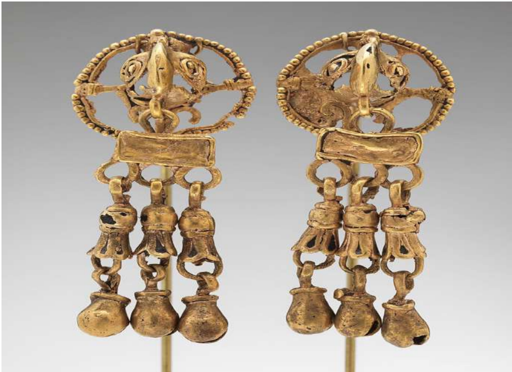
Şekil 1.7. Kartal Motifli Altın Kulak Süsü, Orta Amerika, 6x2.1x1.9cm,1325, Metropolitan Müzesi(metmuseum.com)

takılar, onların gücünü ve makamını simgelemiştir. Aztekler takılarında altını sıklıkla kullanmışlardır. Genellikle altın takılarında kuş sembolünü işlemişlerdir. Takılar, süslenme ve güç gösterme dışında Tanrı'ya adak olarak da sunulmuştur. Bu adak sunma geleneği, Azteklere ruhani duygularını yatıştırma imkânı sağlamıştır. Takı yapımında ustalaşan Amerika toplumlarından biri de Mayalardır. Mayalar, mücevherlerinde gümüş, altın, bakır ve bronz kullanmışlardır. Mayaların takı tasarımları Aztek medeniyetinin takı tasarımlarına benzemektedir. Kuzey Amerika'da bulunan yerli halk, takılarında deniz kabukları, sabuntaşı, ağaç kabukları ve turkuaz kullanmıştır. Kuzey Amerikalılar, küpe ve kolyelerinde turkuaz taşı tercih etmişlerdir. Yerli halk, istiridye ticareti yapmış ve o dönemde istiridyeyi takı yapımında kullanmıştır. Bu durum, takının Kuzey Amerika için önemli bir yere sahip olduğunu göstermektedir (Türe, 2005: 164).