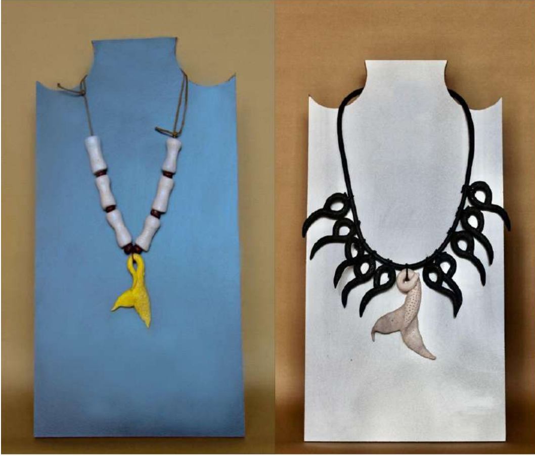
Şekil 3.35. Balık figürlü kolye tasarımları, elle şekillendirme, 1050°C, 2024

Balık imgesinin stilize edilerek oluşturulan kolye tasarımında figür kısmı balık kuyruğundan esinlenerek elde edilmiştir. Kolyenin boncuk kısımları silindirik beyaz boncuklar ve kahverengi yuvarlak küçük boncuklardan oluşmaktadır.