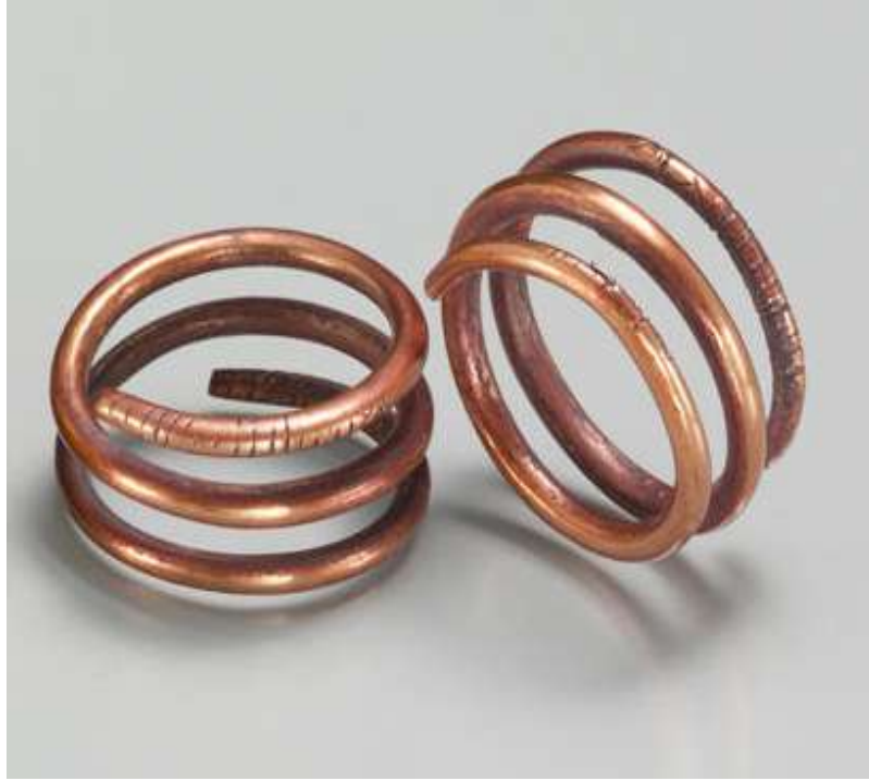
Şekil 1.1. Sprial Küpe, Altın ve gümüş, 2,2 x 2,1 cm, M.Ö. 1635–1458, Metropolitan Müzesi