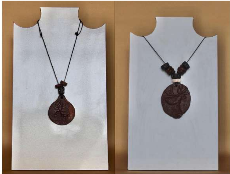
Şekil 3.27. Geyik figürlü kolyeler, elle şekillendirme, 1050°C, 2024

Geyik figürü ve boncuklar kahverengi sır ile renklendirilmiştir. Deri ipler ile bağlanarak kolye tamamlanmıştır.