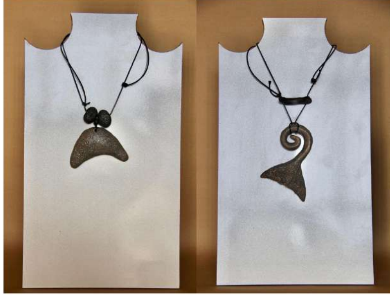
Şekil 3.24. Balık figürlü kolye uçlarından görseller, elle şekillendirilme, 1050°C, 2024

Türk mitolojisinde yer alan at figürü stilize edilerek oluşturulan kolye kahverengi sır kullanılarak renklendirilmiştir. Boncuklar ve kolye uçları iplerle birbirine bağlanmıştır.