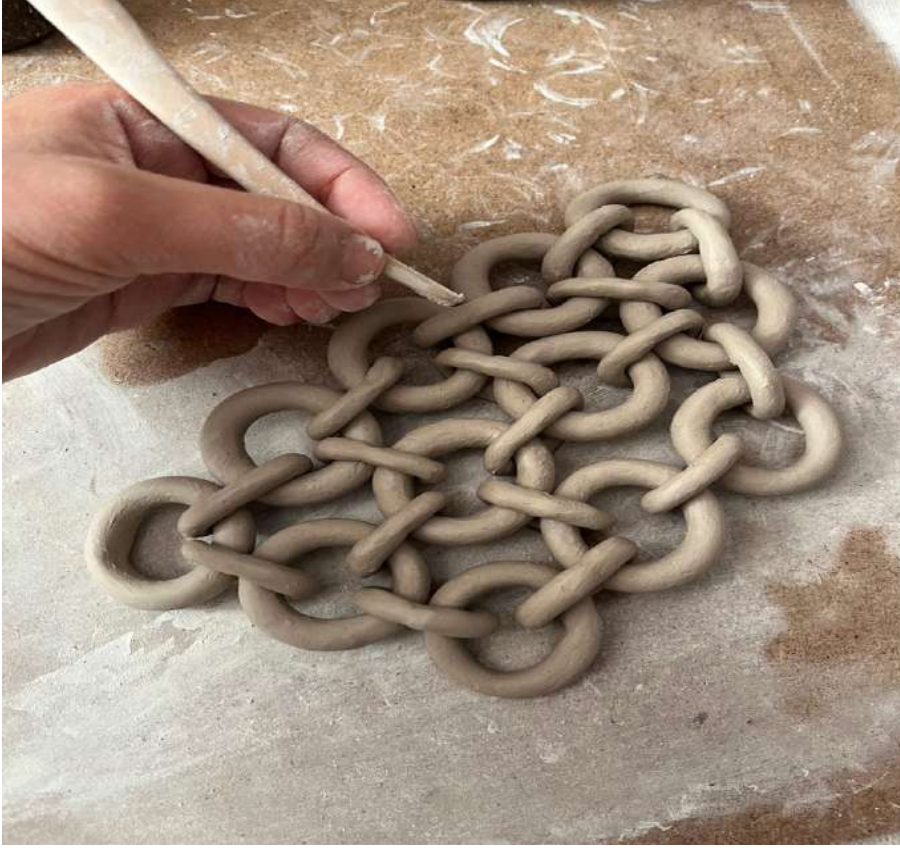
Şekil 3.11. Seramik çamurundan yapılan halkaların çapraz bağlaması

Sucuk yöntemiyle oluşturulan halkalar belirli bir düzende dizilmiş ve deri sertliğine ulaşana kadar bekletilmiştir. Daha sonra, aralarına yeni sucuklar eklenerek birleştirilmiştir.