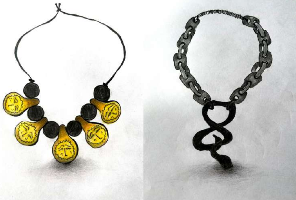
Şekil 3.3. Yılan ve güneş imgelerinin stilize edilerek oluşturulan kolye tasarım eskizlerin