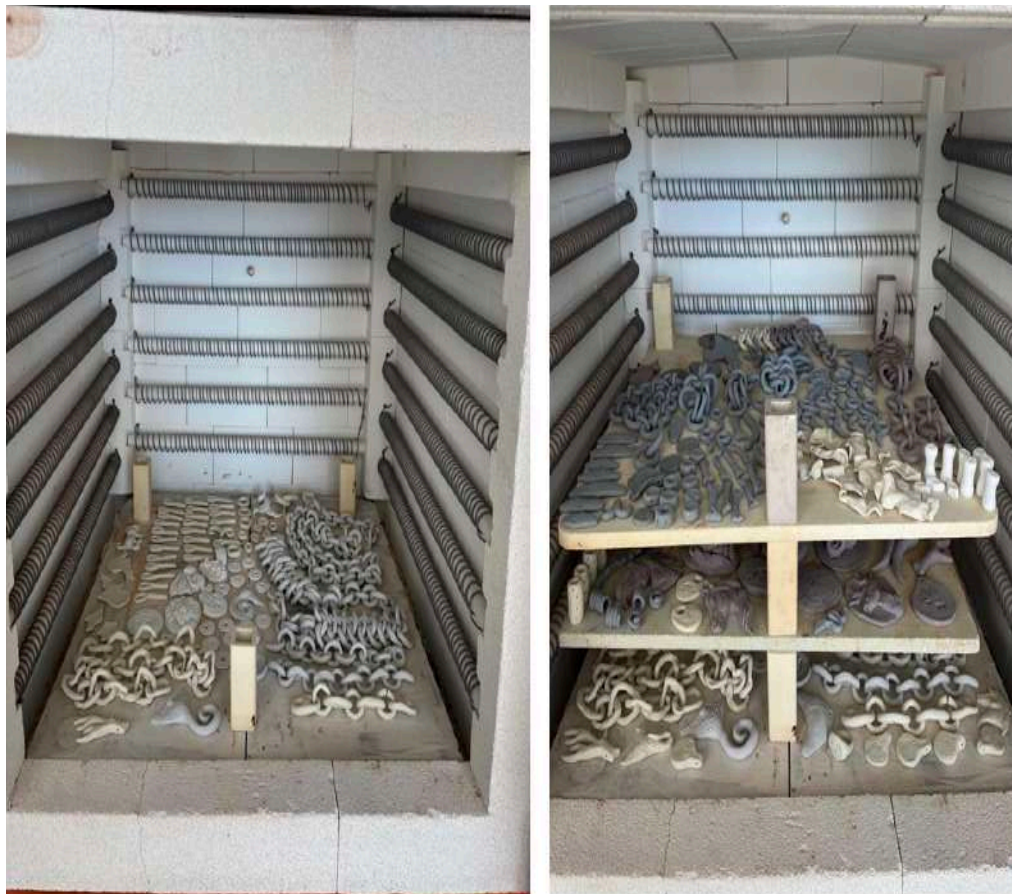
Şekil 3.16. Sırlanan takı formların ikinci pişirim için fırına yerleştirilmesi

en büyük etken fırın yüzeyine yapışmama özelliğidir. Takı gibi tüm yüzeyi sırlanması gereken formlarda, genellikle bir tele geçirilerek fırın yüzeyine yapışması engellenir. Ancak bu yöntem, hem zaman alıcıdır hem de telin birden fazla pişirim görmesiyle eriyip kullanılamaz hale gelmesine neden olmaktadır. Ayrıca, zincir ve büyük formların tele geçirilmesi eğilme riski taşımaktadır. Bu tür formların yüzeyine sırlama yapmak, hem zor hem de riskli bir işlemdir. Bunun yanı sıra, Bots Glimmer serisine ait sırların içinde bulunan parlak parçacıklar, takılarda yer yer parlama efekti oluşturmaktadır. Özellikle ışıkla etkileşime girdiğinde, takılarda estetik açıdan tercih edilen parlama efektleri ortaya çıkmaktadır. Takıların ve zincirlerin tüm yüzeylerinin eşit şekilde kaplanabilmesi için bu sırlar kullanılmış olup, diğer seramik sırlarının etkisine en yakın sonucu veren ve parlak parçalar içeren yapısı nedeniyle tercih edilmiştir.