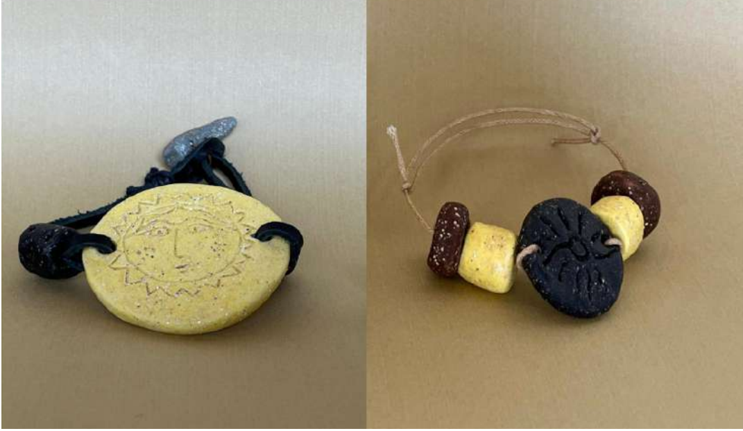
Şekil 3.43. Stilize edilmiş güneş biçimli bileklik tasarımları, elle şekillendirme, 1050°C, 2024