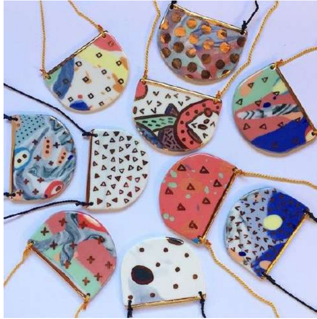
Şekil 1.26. Ruby Pilven'e ait nerikomi kolyeler