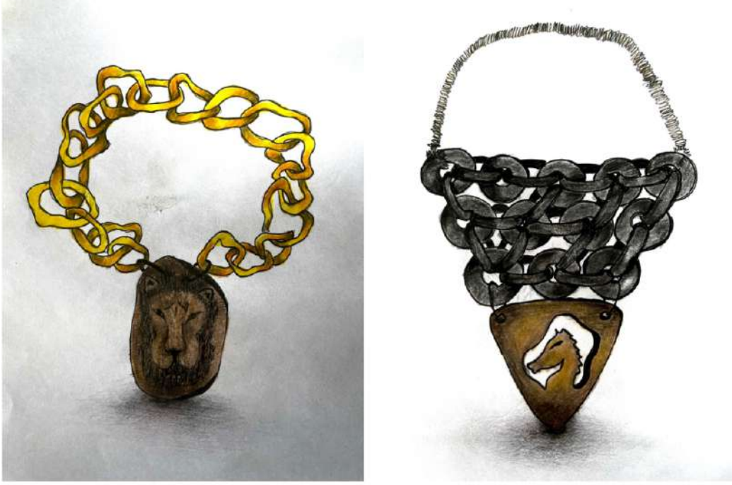
Şekil 3.6. Aslan ve at imgelerinin stilize edilerek oluşturulan kolye tasarım eskizlerinden