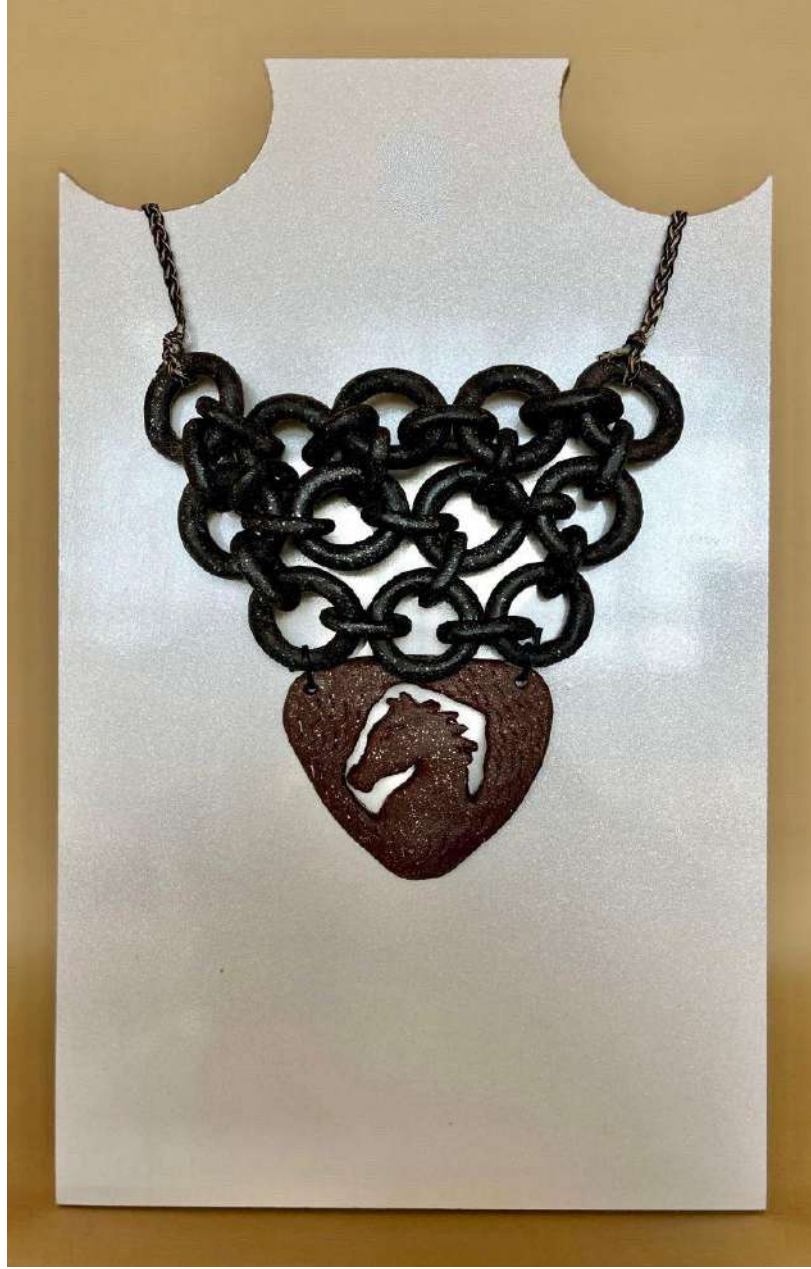
Şekil 3.38. At figürlü gerdanlık tasarımı, elle şekillendirme, 1050°C, 2024

At figürlü gerdanlık tasarımında figür kısmı seramik plaka üzerine at figürü ajur tekniğiyle oluşturulmuştur. Gerdanlığın gövde kısmı seramik halkaların iç içe geçirilerek elde edilmiştir. Gerdanlığın figür kısmı kahverengi sır ile renklendirilmiştir. Örgü formu verilmiş zincir kısmı siyah renkli sırla renklendirilmiştir. Gerdanlığın bağlantı kısımları iplerle desteklenilmiştir.