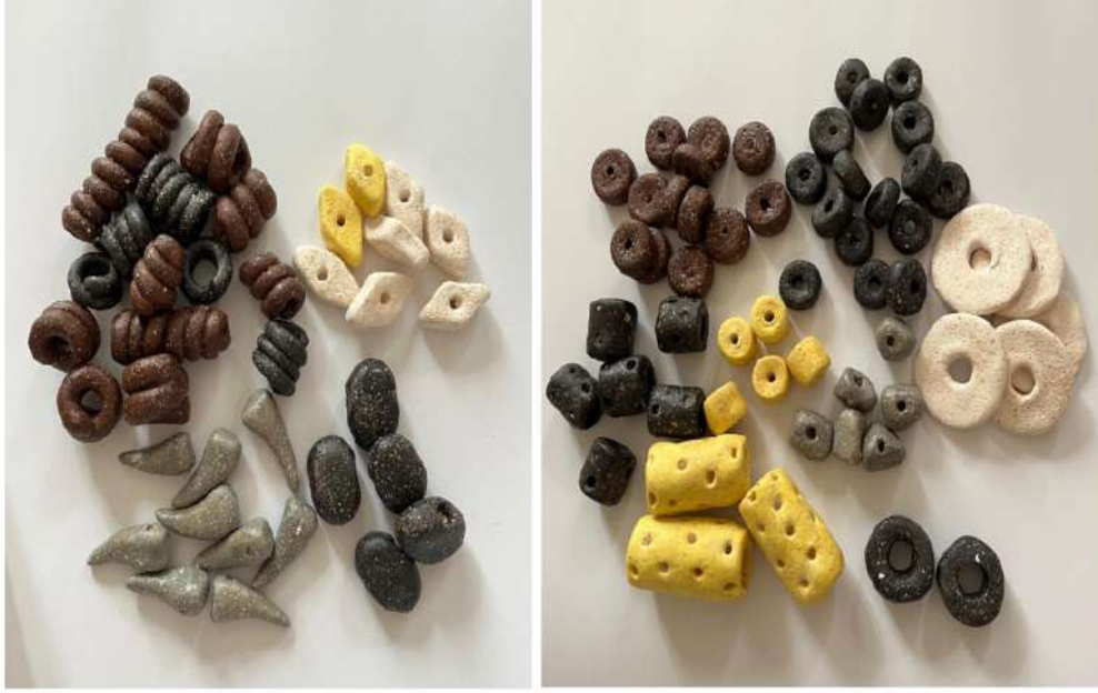
Şekil 3.18. Sırlarla renklendirilmiş çeşitli biçimlerde takı boncukları.