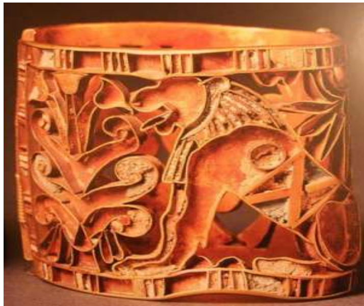
Şekil 1.20. Loure Müzesi, Mısır Dönemine ait Aslan figürlü altın bilezik (Lewandowski, 2000, s.15)

Mısır takılarında, turkuaz, mavi ve kırmızı gibi renkler ön plandaydı. Cam ve fayans üretiminin başlamasından önce, kuvarsın yüzeyi istenilen renklere boyanarak renkli taş etkisi elde edilirdi. M.Ö. 3000’lerde cam üretiminin gelişmesiyle renkli fayans takılar üretilmeye başlandı. Eski Krallık döneminde kaolin, potasyum, kuvars, ve metal oksit karışımlarıyla renkli fayans elde edildi. Bu malzemeler kalıplarla şekillendirildi, sırlanarak tekrar pişirildi. Kuvarsın toz haline getirilip pişirilmesiyle elde edilen malzemeye "Mısır kili" denildi ve soda silikat karışımlarıyla renklendirildi (Yoleri, 2006: 107).