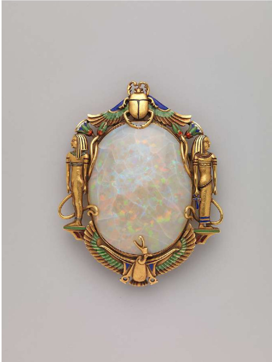
Şekil 1.18. Marcus marka altın bir broş, 1900, Metropolitan Sanat Müzesi