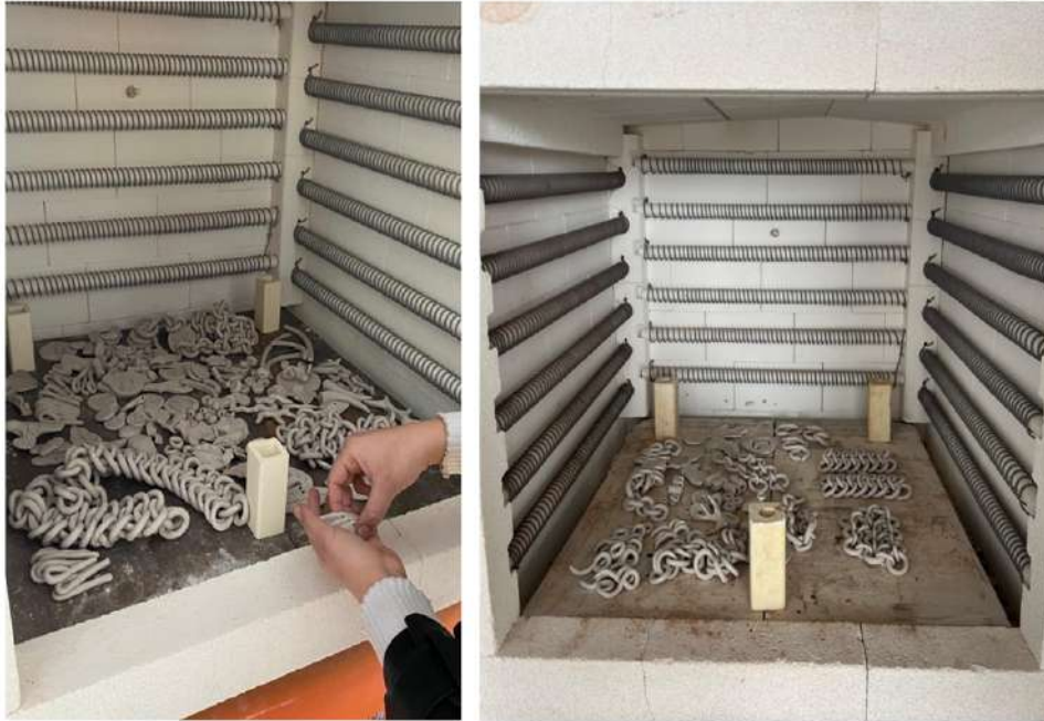
Şekil 3.14. Bisküvi pişirimi öncesi seramik takıların yerleştirilmesi

Seramik takılar kontrollü bir şekilde, uygun bir ortamda kurumaya bırakılmıştır. Kurutma işleminin ardından seramik takılar pişirmeye hazır hale gelmiştir.