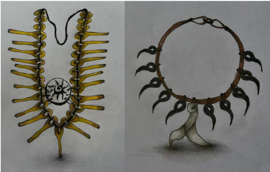
Şekil 3.1. Güneş ve Balık imgesinin stilize edilerek oluşturulan kolye eskiz çalışmaları

Çalışmanın bu bölümünde ikinci bölümde anlatılan Türk mitolojisindeki Kartal, Balık, Ejderha, Aslan, Geyik, Keçi, Yılan, At ve Güneş imgeleri örneklem olarak seçilmiştir. Seçilen imgeler seramik malzeme ile takı sanatına dönüştürülmüştür. Dönüştürme aşamaları; eskiz aşamasından başlayarak, şekillendirme, kurutma, büküvi pişirimi, sırlama, sır pişirimi yapıldıktan sonra seramik parçaları yardımcı malzemerle birleştirilmiştir. Yapılan işlemler fotoğraflanarak detaylı bir şekilde yapım aşamaları anlatılmıştır. Ayrıca çalışmadaki takı uygulamaları: kolye uçları, büyük kolyeler, bileklikler, küpeler ve yüzükler olarak sınıflandırılmıştır.