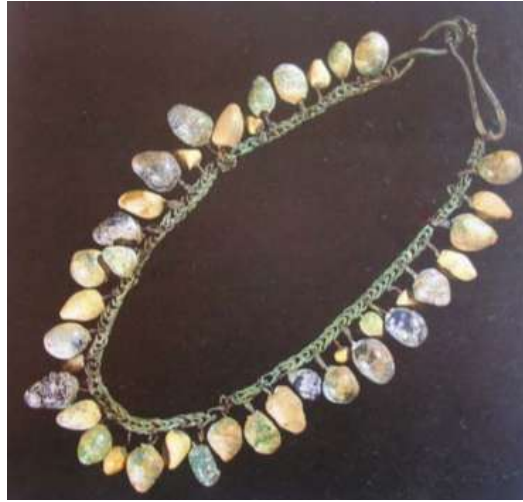
Şekil 1.21. tunç zincirli seramik kolye, M.Ö. 4-2 yüzyıllar (Bağcı, 2022, s.52)

M.Ö. 7. yüzyılda, fayans takı üretimi oldukça gelişmiştir. Yunan ve Fenike kültürleriyle harmanlanan bu dönemde, altın boncuklar ile renkli sırlanmış boncukların bir arada kullanıldığı çok renkli takılar yapılmıştır. Aynı dönemde, Doğu Anadolu'da yaşayan Urartular, dikkatle delinmiş renkli sırlı fayans boncuklar ve kolyeler üretmişlerdir. Bu boncuklar, deri bir sicim veya ip üzerine dizilerek bilezik, kolye, fibula ve süs iğnesi gibi takılara dönüştürülmüştür (Özdem, 2003: 194).