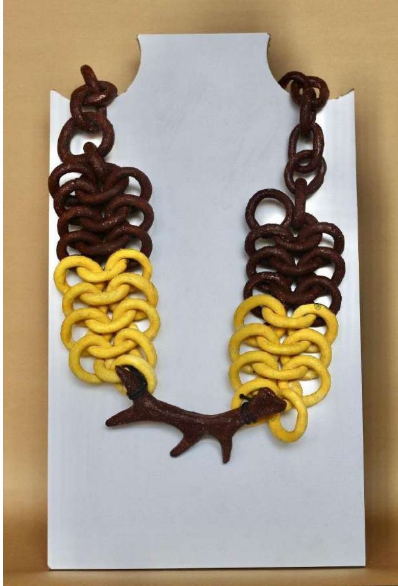
Şekil 3.36. Geyik figürlü kolye tasarımı, elle şekillendirme, 1050°C, 2024

Geyik figüründen esinlenen kolye tasarımının uç kısmı, doğrudan geyik boynuzu olarak şekillendirilmiştir. Kolyenin gövdesi seramik halkalardan iç içe geçirilerek örülmüştür. Örülen zincirin bir kısmı sarı, bir kısmı da kahverengi sır ile renklendirilmiştir. Figür kısmı kahverengi sır ile renklendirilmiştir. Gövde ve uç kısmı siyah ipe bağlanılarak desteklenilmiştir.