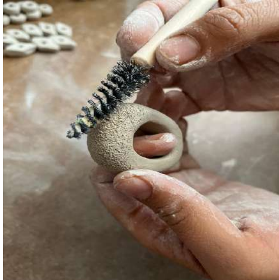
Şekil 3.12. Seramik yüzük yapımı

Sucuk yöntemiyle oluşturulan halkalar belirli bir düzende dizilmiş ve deri sertliğine ulaşana kadar bekletilmiştir. Daha sonra, aralarına yeni sucuklar eklenerek birleştirilmiştir.