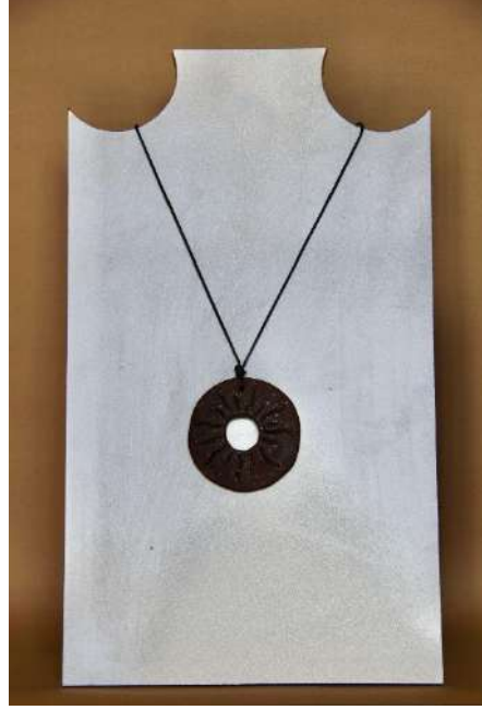
Şekil 3.26. Stilize edilmiş güneş biçimli kolye, elle şekillendirme, 1050°C, 2024

Kartal figürleri ve boncuklar, kahverengi ve gri renkli sırlar ile renklendirilmiştir. Kartal figürleri ve boncuklar ince deri ipe bağlanmıştır.