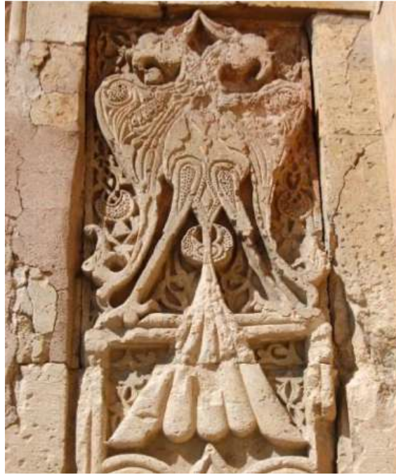
Şekil 2.1. Çift başlı kartal figürü, Divriği Turan Melek Dârüşşifâsı (Saz, S. 2021)