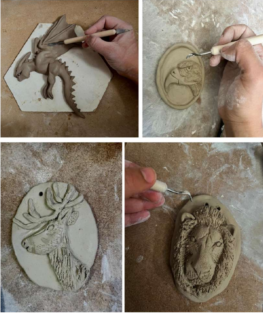
Şekil 3.10. Türk mitolojisindeki figürlerin yapımından uygulaması

Belirlenen hayvan figürleri, seramik yüzeylerin uygun nem oranına ulaşmasının ardından rölyef oluşturacak şekilde işlenmiştir.