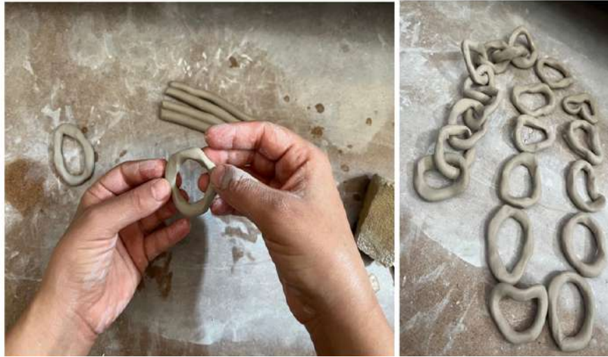
Şekil 3.9. Seramik çamurundan kıvrımlı zincir yapımı

Demir çubuklara seramik çamuru sarılarak boncuk formları oluşturulmuş ve bir süre bekletildikten sonra çubuklardan çıkarılmıştır. Alternatif bir yöntem olarak, farklı boyutlardaki çamur parçaları delinerek boncuk formu verilmiştir.