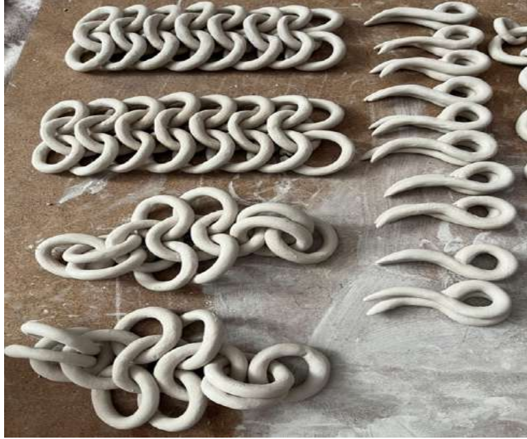
Şekil 3.13. Seramik takıların ve zincirlerin kurutulması

detaylandırılmıştır. Son aşamada ise yüzüğün kenarına figür işlenmiştir.