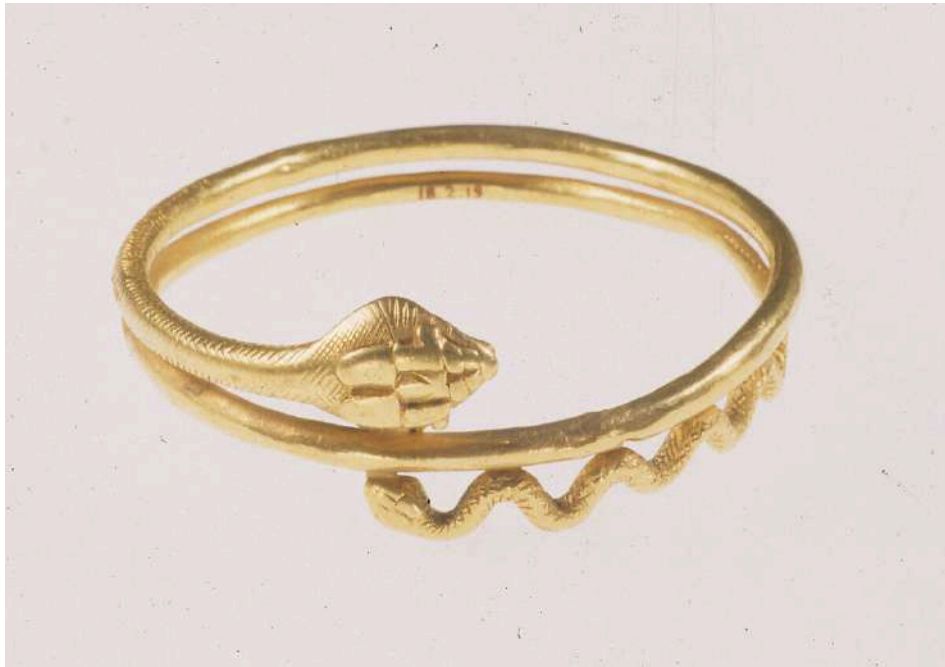
Şekil 1.15. Roma dönemine ait yılan biçimli bir bilezik, M.Ö.1.yy, Metropolitan Sanat Müzesi. (metmuseum.com)

kola takılan takılar farklı sembolik anlamlar ifade etmiştir. Bilezik, çok eski çağlardan itibaren hem kadınlar hem de erkekler tarafından yaygın olarak kullanılmış bir takıdır. Bileğe takılan takıların tasarımı, kullanılan malzeme ve formuna bağlı olarak farklı anlamlar taşımaktadır. Roma Dönemi'nde üretilen cam bilezikler, dikkat çeken örnekler arasında yer almaktadır. İlerleyen zamanlarda, İslam ve Bizans coğrafyasında da bilezik kullanımı farklı formlarda yaygınlaşmıştır (Çoruhlu, 2010: 45).