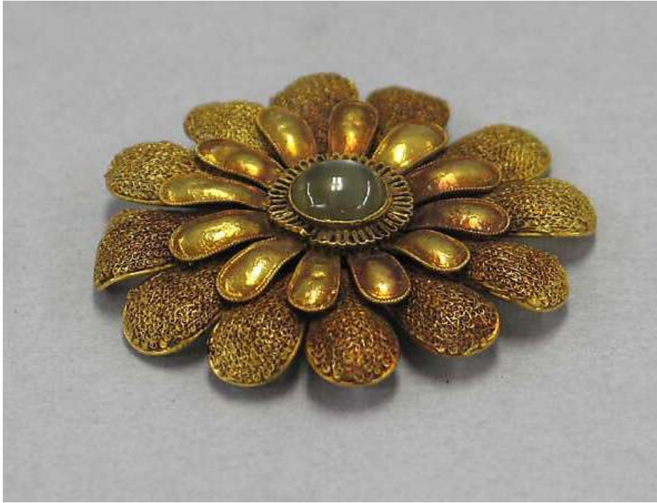
Şekil 1.9. Süs Eşyası, Çin, altın ve aya taşı, 4.x3.2cm, Song Hanedanlığı, 960–1279, Metrolopitan Müzesi

edilerek kullanılmış, zamanla kişinin sosyal statüsünü ve gücünü simgeleyen araçlar haline gelmiştir. Zaman içinde takılar, süslenme amacıyla da önemli bir rol oynamaya başlamıştır. Çin halkının kullandığı ilk takılar arasında küpeler öne çıkmaktadır ve bu takılar hem kadınlar hem de erkekler tarafından kullanılmıştır. Ayrıca, tılsım ve nazarlıklar da Çin’de yaygın olarak kullanılan takılar arasında yer almıştır. Bu takılarda, ejderha ve Anka kuşu gibi sembolik motifler sıkça tercih edilmiştir. Çin’de ölümlerin takılarıyla gömülmesi, kültürel bir gelenek olarak kabul edilmiştir ve arkeolojik kazı çalışmalarında bu duruma dair buluntulara rastlanmıştır (Taşyürek, 2014: 38).