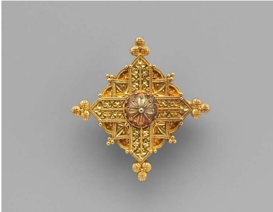
Şekil 1.11. 19. yüzyıla ait gotik haç formunda bir broşlu kolye, Metropolitan Sanat Müzesi (metmuseum.com)

17. yüzyılda Avrupa'nın kiliselerinde sanat, ön planda bir yer tutmuştur ve dini duyguların pekiştirilmesinde sanatın önemli bir rol oynadığı vurgulanmaktadır. Rönesans Dönemi sona erip reform hareketlerinin başladığı bu dönemde, sanat alanında da önemli yenilikler yaşanmıştır. Klasik sanat anlayışı, yerini daha dinamik ve hareketli bir sanat anlayışına bırakmıştır. 17. yüzyılda değerli taşların kullanımı yaygınlaşmıştır. Bu dönemde en çok tercih edilen değerli taşlardan biri elmas olup, zümrüt ve yakut gibi taşlar da gösterişli takılarda yaygın olarak kullanılmıştır. Barok sanat anlayışının etkileri, özellikle dekorasyon ve mimari alanlarda olduğu gibi, takı tasarımlarında da belirgin bir şekilde görülmektedir. 17. yüzyılda, şatafatlı giysiler tasarlanmış ve bu giysileri tamamlayan takılar dönemin belirgin özelliklerinden biri haline gelmiştir. Takı tasarımlarında, dönemin estetik anlayışına uygun olarak figürler ve bezemeler yaygın şekilde kullanılmıştır. Özellikle çiçek ve bitki motifleri, bu dönemin takılarında sıkça yer almıştır. Ayrıca, inci kullanımı da takılarda oldukça yaygınlaşmış olup, inci özellikle saray halkı ve üst sınıflar tarafından tercih edilmiştir (Türe, 2011b: 68).