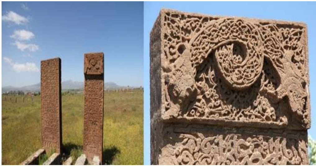
Şekil 2.3. Ahlat mezar taşlarında ejderha motifi (journalofsocial.com)

Ön Asya döneminde ejderha, başlangıçtaki olumlu anlamlarını kaybetmiş ve Türk mitolojisinde hem aydınlık hem de kötülüğün simgesi olarak karşımıza çıkmıştır. Türk mitolojisinde, 12 evren modeli içinde dünyanın yaratılmadan önceki dönemi "kaos" olarak tanımlanmıştır. Ejderha, aynı zamanda su simgesiyle ilişkilendirilmiş ve evrenin başlangıcını betimlemek için kullanılmıştır. Türk mitolojisinde ejderha, "celbegen," "vibegen" ve "jilbegen" gibi farklı adlarla anılmaktadır (Kaşgarlı, 1998: 227).