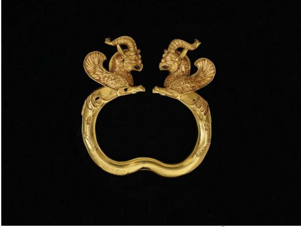
Şekil 1.3. Perslere ait bir takı, Oxus Hazinesi, M.Ö. 4.yy.