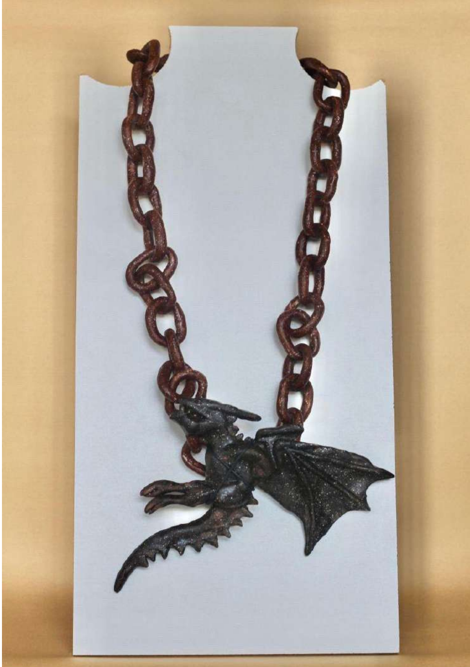
Şekil 3.30. Ejderha figürlü kolye tasarımı, elle şekillendirme, 1050°C, 2024

Ejderha figürlü kolyenin gövdesi de seramik zincirle yapılmıştır. Zincirler kahverengi sır ile renklendirilmiştir. Kolyenin uç kısmındaki ejderha figüründe gri renkli sır kullanılmıştır. Takının parçaları deri ip ile bir araya getirilmiştir.