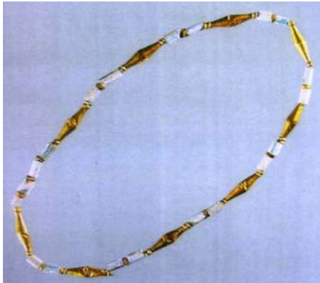
Şekil 1.22. Roma Dönemi'ne ait kolye, altın ve fayans boncuklardan oluşmuş, 1971 yılında Keban'da yapılan kazıda bulunan (Behiç, 1999, s.128)

M.Ö. 7. yüzyılda, fayans takı üretimi oldukça gelişmiştir. Yunan ve Fenike kültürleriyle harmanlanan bu dönemde, altın boncuklar ile renkli sırlanmış boncukların bir arada kullanıldığı çok renkli takılar yapılmıştır. Aynı dönemde, Doğu Anadolu'da yaşayan Urartular, dikkatle delinmiş renkli sırlı fayans boncuklar ve kolyeler üretmişlerdir. Bu boncuklar, deri bir sicim veya ip üzerine dizilerek bilezik, kolye, fibula ve süs iğnesi gibi takılara dönüştürülmüştür (Özdem, 2003: 194).