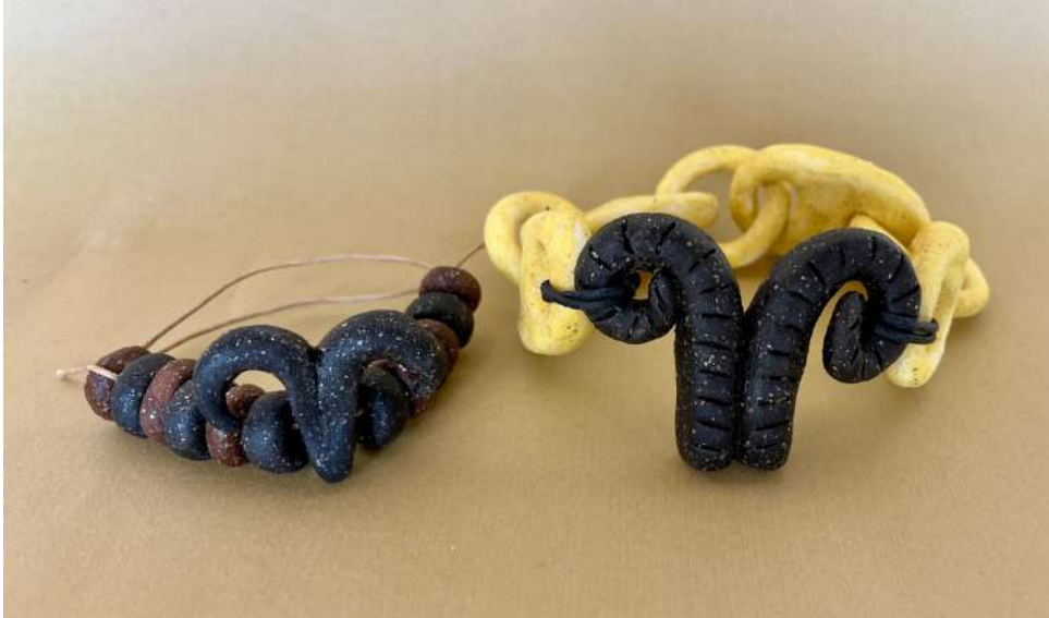
Şekil 3.41. Keçi figürlü bileklik ve bilezik tasarımı, elle şekillendirme, 1050°C, 2024

Keçi figürlü bilezikte boncuklar kahverengi ve siyah sırlama işlemi yapılmıştır. Keçi figüründe ise siyah renk tercih edilmiştir. Parçalar sarı renkli ip ile bir araya getirilmiştir. Yine keçi figürünün kullanıldığı bileklikte de figür siyah renkten oluşmaktadır. Zinciri oluşturan parçalar ise sarı renkli sır ile uygulanmıştır.