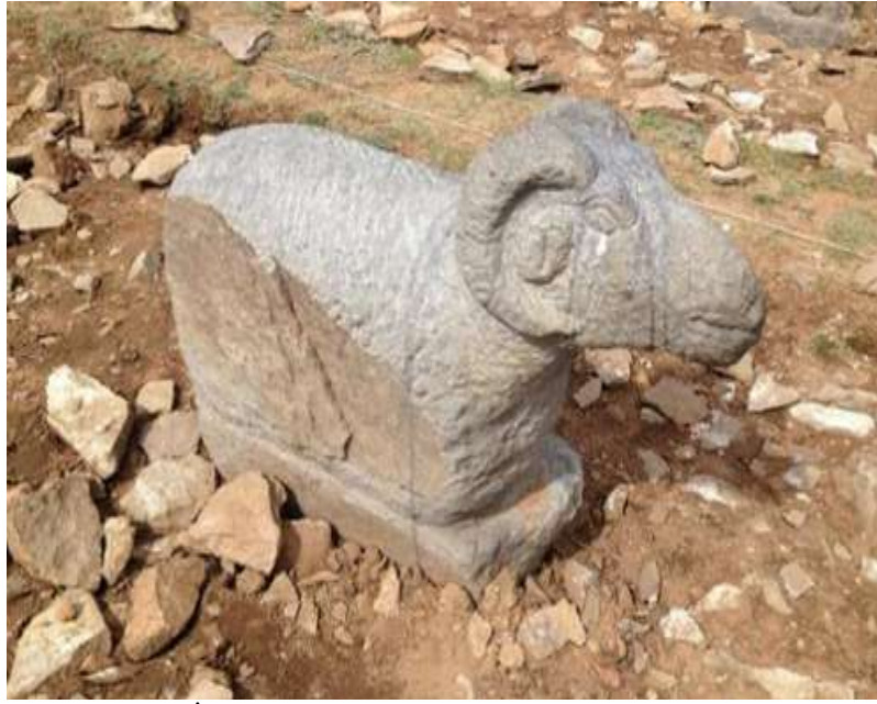
Şekil 2.6. İleriş Kağan Mezarında koç heykeli

mücadelelerinin tasvirlerinde, sfenks ve grifon gibi fantastik ve doğaüstü varlıklarla birlikte dağ keçisi ya da koçun avlanma anları betimlenmiştir. Bu tasvirlerde, canlıların yeleleri, kanatları ve boynuzları stilize edilerek motiflere işlenmiştir. Bu unsurlar, dönemin sanat anlayışını ve mitolojik inançlarını yansıtmaktadır (Alsan, 2017: 42-43).