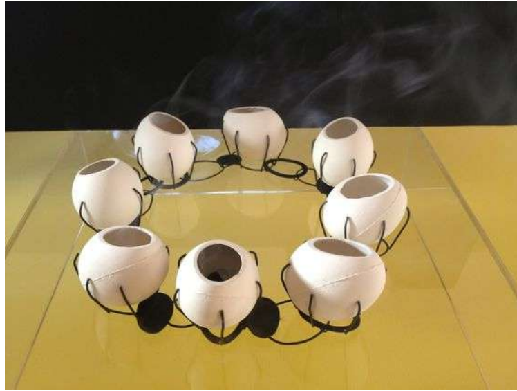
Şekil 1.27. 'Katia Toporski'ye ait porselen kolye (sieraad Art Fair.com)