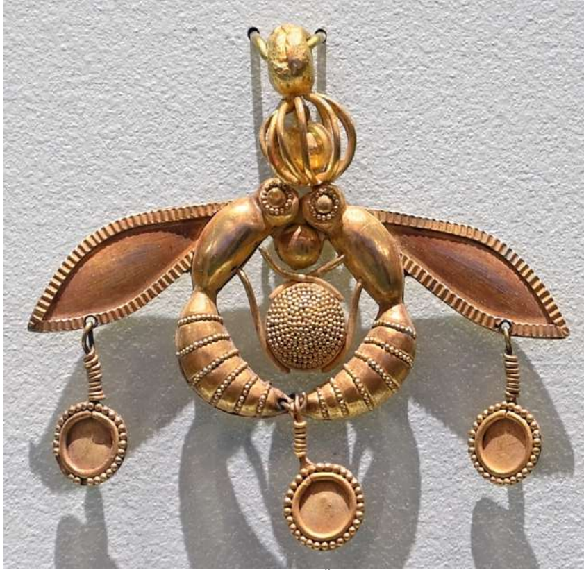
Şekil 1.2. Malia Kolyesi, 4.4cm x 4.6cm, M.Ö. 1800, Heraklion Arkeoloji Müzesi, (heraklionmuseum.gr)

Frigyalılar takılarında geometrik motifler kullanmışlardır. Frigya ile komşu olan Lidyalılar da takılarında altın işçiliği sıklıkla rastlanılmaktadır. İlk madeni parayı basan uygarlık olarak bilinen Lidyalılar, altın ve gümüş alaşımından yapılmış takılar kullanmışlardır (Özay, 2000:132).