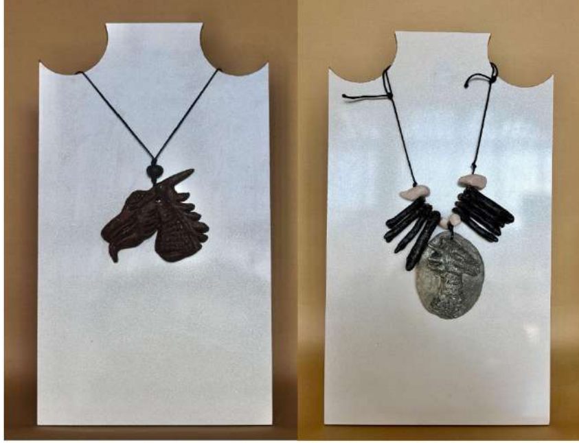
Şekil 3.22. Ejderha figürlü kolye uçları, elle şekillendirme, 1050°C , 2024

Türk mitolojisinde yer alan ejderha figüründen esinlenerek kolye uçları tasarlanmıştır. Gri ve kahverengi sırlarla renklendirilen kolye uçları ve boncuklar, ip ile birleştirilerek son halini almıştır.