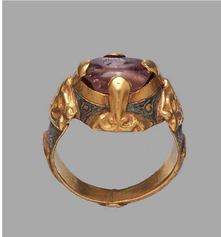
Şekil 1.16. İran'da bulunan altın altın ve türmalin boncukla süslenmiş bir yüzük, 12.yy, Metropolitan Sanat Müzesi (metmuseum.com)