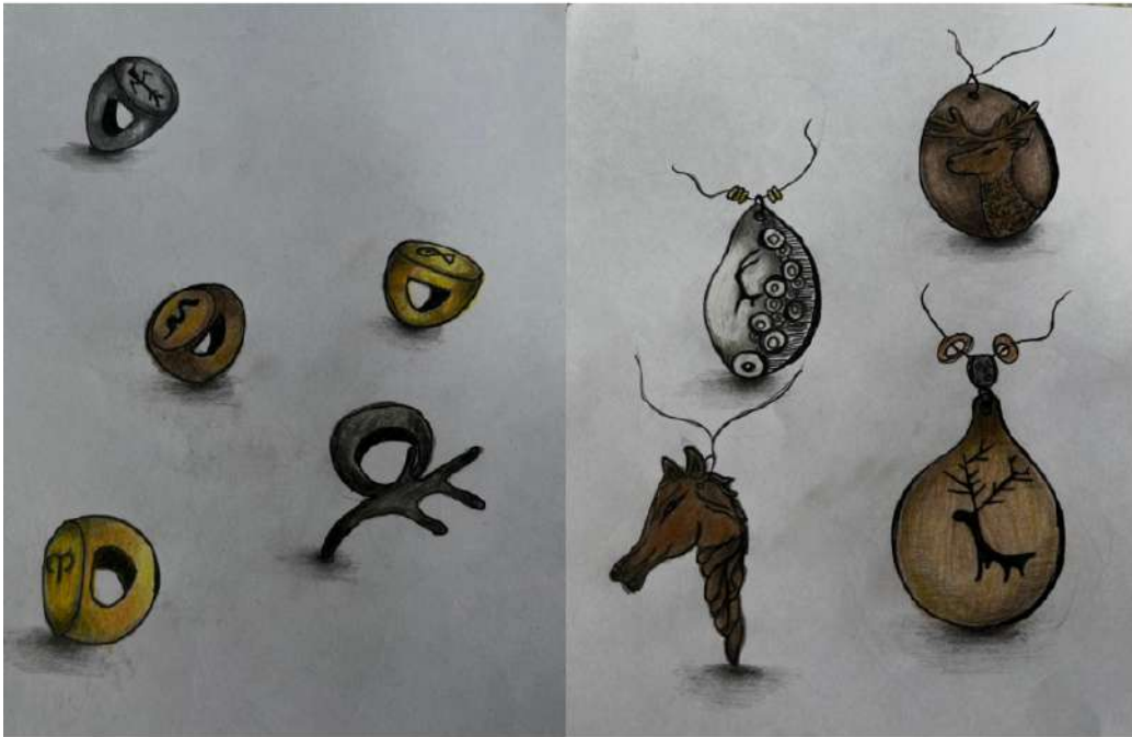
Şekil 3.5. Yüzük ve kolye uçları tasarım eskizlerinden