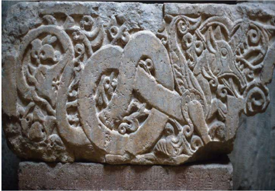
Şekil 2.7. Anadolu Selçuklu Dönemine ait yılan ve ejderha motifi

farklı anlatı ve mekânda adı geçmektedir. Mersin ilinin Tarsus ilçesinde bulunan Makamı Şerif Camii'nin yanındaki eski hamam, halk arasında "Şahmeran Hamamı" olarak bilinmektedir. Hamamda bulunan taşların kızıl renginin, buranın Şahmeran adıyla anılmasında önemli bir rol oynadığı düşünülmektedir (Çıblak, 2007:90).