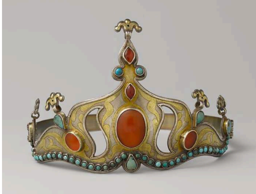
Şekil 1.14. Orta Asya'da bulunan bir taç, 19.-20. yüzyıl, Metropolitan Sanat Müzesi

sembolik bir anlam taşımaktadır. Günlük yaşamda taçlar, doğum günü kutlamaları, cenaze törenleri ve düğünlerde yaygın olarak kullanılmaktadır.