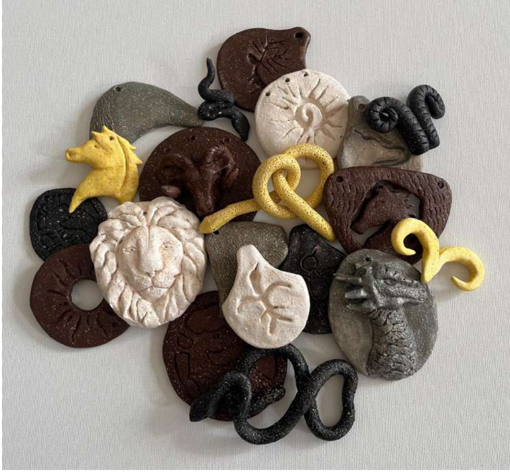
Şekil 3.17. Sırlarla renklendirilmiş takı parçaları.

Yukarıda aslan, keçi, kartal, yılan, güneş, ejderha, at, geyik ve balık imgelerinin stilize edilip soyutlandırılmış takı parçaları bulunmaktadır. Bu parçalar sırlarla renklendirilip, takılarda kullanıma hazır hale getirilmiştir.