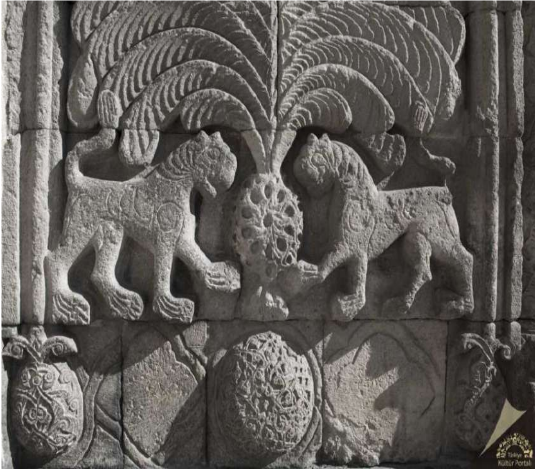
Şekil 2.4. Yakutiye Medresesi'nin taç kapısındaki aslan motifleri

yer tutar ve bu mücadelelerde aslan genellikle zaferi simgeler. Boğa ay ile, aslan ise güneş sembolüyle ilişkilendirilmiştir; ay karanlıkla, güneş ise aydınlıkla özdeşleştirilmiştir. Bu sembolizm, İslamiyet sonrası dönemde de devam etmiştir (Bilgili, 2017: 98).