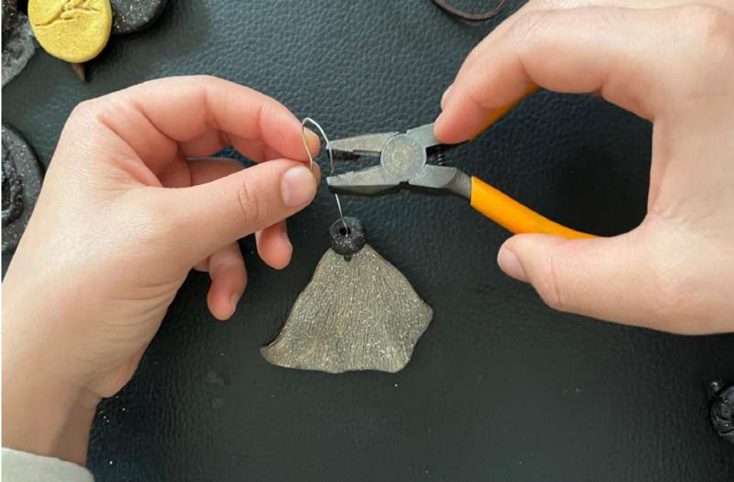
Şekil 3.21. Küpe yapım aşaması.

Keçi ve yılan figürleri bilekliklerde kullanılmıştır. Bilekliğin figür ve boncuk kısımları deri kordon ve iple birleştirilmiştir.