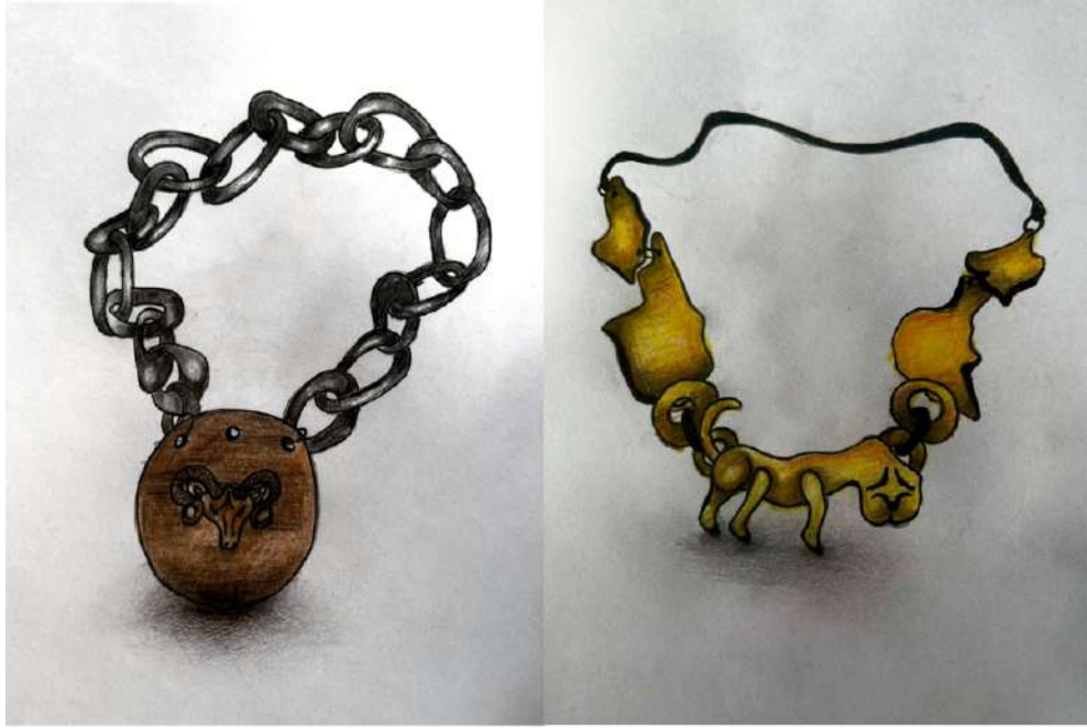
Şekil 3.4. Keçi ve aslan figürlerinin stilize edilerek oluşturulan kolye tasarım eskizlerinden