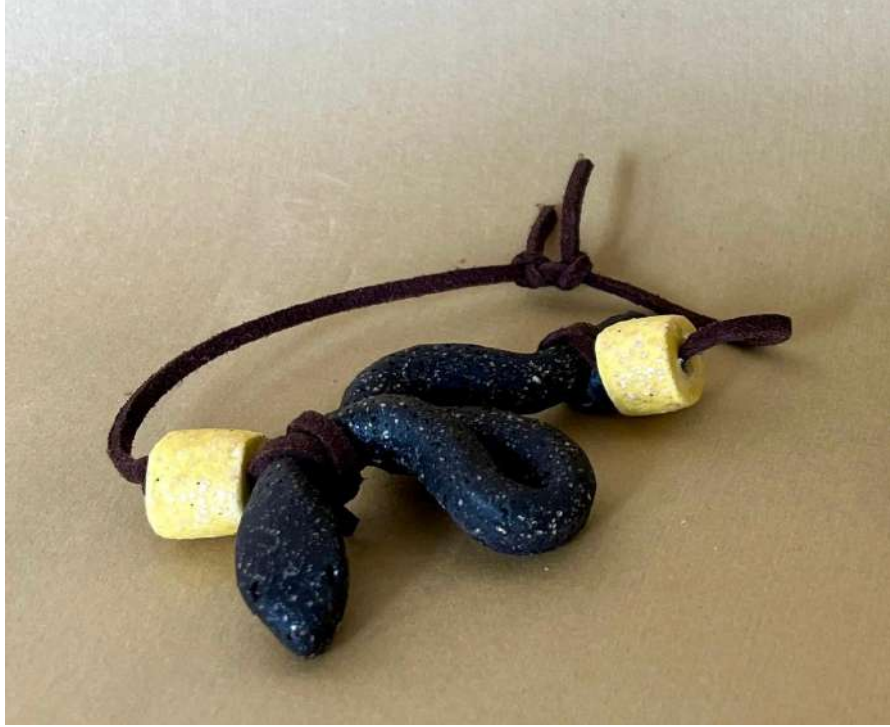
Şekil 3.46. Yılan figürlü bileklik tasarımı, elle şekillendirme, 1050°C, 2024

Yılan figürlü bileklikte siyah ve sarı renkler kullanılmıştır. Birleşim kısımları kahverengi deri ipe yapılmıştır.