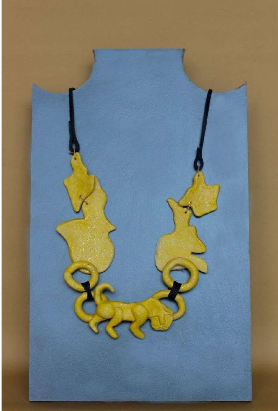
Şekil 3.39. Aslan figürlü kolye, elle şekillendirme, 1050°C, 2024

Aslan figürlü bir diğer kolye tasarımında figür kısmı Türk mitolojisindeki aslan figürü stilize edilerek oluşturmaktadır. Kolye ucuna sarı renkli sırlama işlemi yapılmıştır. Farklı şekillerde kesilmiş plaka parçalarında sarı renkli sırlanarak kolyenin diğer kısımlarını oluşturmaktadır. Kolyenin parçalarının birleşim kısımlarına ince sarı iple birleştirilmiştir. Diğer parçalarının da kalın siyah iple bağlanılarak son haline getirilmiştir.