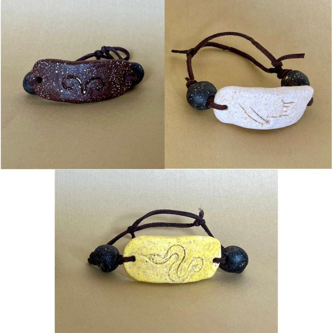
Şekil 3.45. Geyik, yılan ve keçi figürlü bileklik tasarımları, elle şekillendirme, 1050°C, 2024

Seramik plakalar bilek kıvrımına rahat oturulması için belli bir seviyede eğim verilmiştir. Eğimli plakalar üzerine keçi, geyik ve yılan figürleri kazınmıştır. Keçi figürlü bileklik ucu kahverengi, geyik figürlü bileklik ucu beyaza ve yılan figürlü bileklik ucu beyaz renkli sırlar uygulanmıştır. Bileklik tasarımları desteklemesi için siyah renkte sırlarla renklendirilmiş boncuklar kullanılmıştır. Son olarak bileklik formlarını vermek için deri ipele birleştirilmiştir.