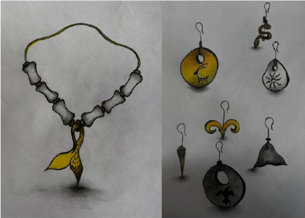
Şekil 3.2. Kolye tasarım ve küpe tasarım eskizlerinden