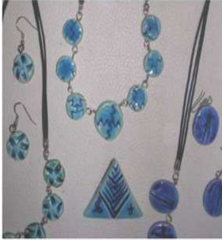
Şekil 1.31. Turkuaz şeffaf sırla sırlanmış rölyefli takılar (acikbilim.yok.gov)