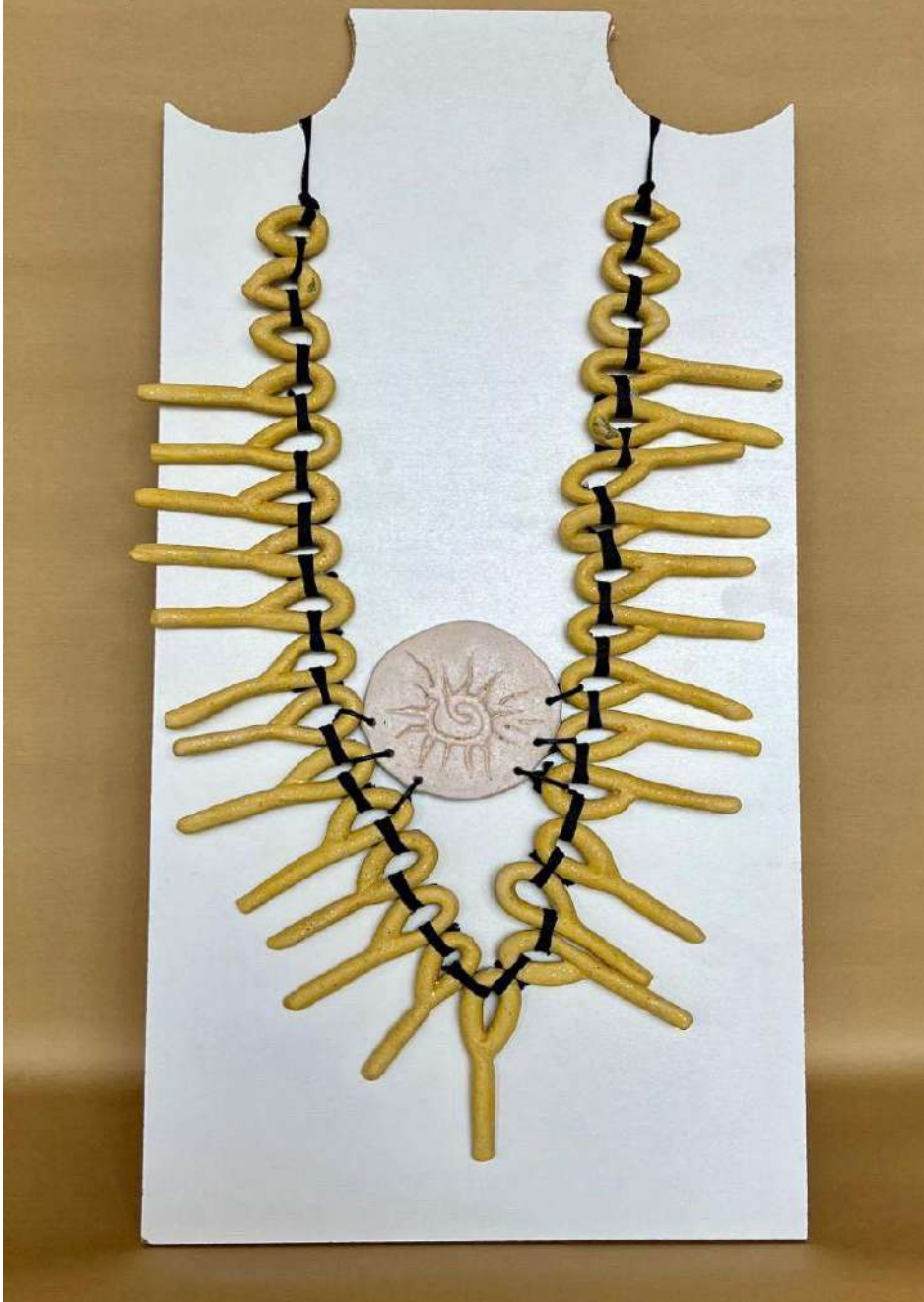
Şekil 3.37. Stilize edilmiş güneş biçimli kolye tasarımı, elle şekillendirme, 1050°C, 2024

Stilize edilerek oluşturulan güneş biçimli bir diğer kolye tasarımında seramik sucuklar bir tarafından kıvrılarak oluşturulmuştur. Kolyenin ana merkezine yerleştirilen disk şeklindeki seramik plaka üzerine güneş biçimi işlenmiştir. Figür kısmı beyaz renkte sır ile renklendirilmiştir. Kolyenin kıvrılmış ince sucukları sarı renkte sır ile renklendirilmiştir. Sarı renkteki sucuklar birbirine kalın siyah ipe bağlanılmıştır. Gövde ve disk kısmı ince siyah ipe birleştirilerek kolyenin son formu