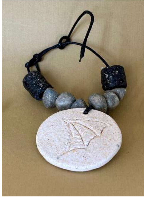
Şekil 3.44. Ejderha figürlü bileklik tasarımı, elle şekillendirme, 1050°C, 2024

Ejderha figürlü bileklik tasarımında, figür beyaz renkle ve boncuklar siyah ve gri sırlarla renklendirilmiştir. Parçalar ince bir iple birleştirilmiştir.