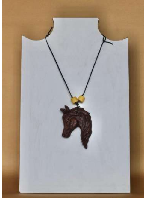
Şekil 3.23. At figürlü kolye ucu, elle şekillendirme, 1050°C, 2024

Türk mitolojisinde yer alan ejderha figüründen esinlenerek kolye uçları tasarlanmıştır. Gri ve kahverengi sırlarla renklendirilen kolye uçları ve boncuklar, ip ile birleştirilerek son halini almıştır.