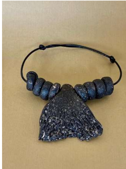
Şekil 3.42. Balık figürlü bileklik tasarımı, elle şekillendirme, 1050°C, 2024

Keçi figürlü bilezikte boncuklar kahverengi ve siyah sırlama işlemi yapılmıştır. Keçi figüründe ise siyah renk tercih edilmiştir. Parçalar sarı renkli ip ile bir araya getirilmiştir. Yine keçi figürünün kullanıldığı bileklikte de figür siyah renkten oluşmaktadır. Zinciri oluşturan parçalar ise sarı renkli sır ile uygulanmıştır.