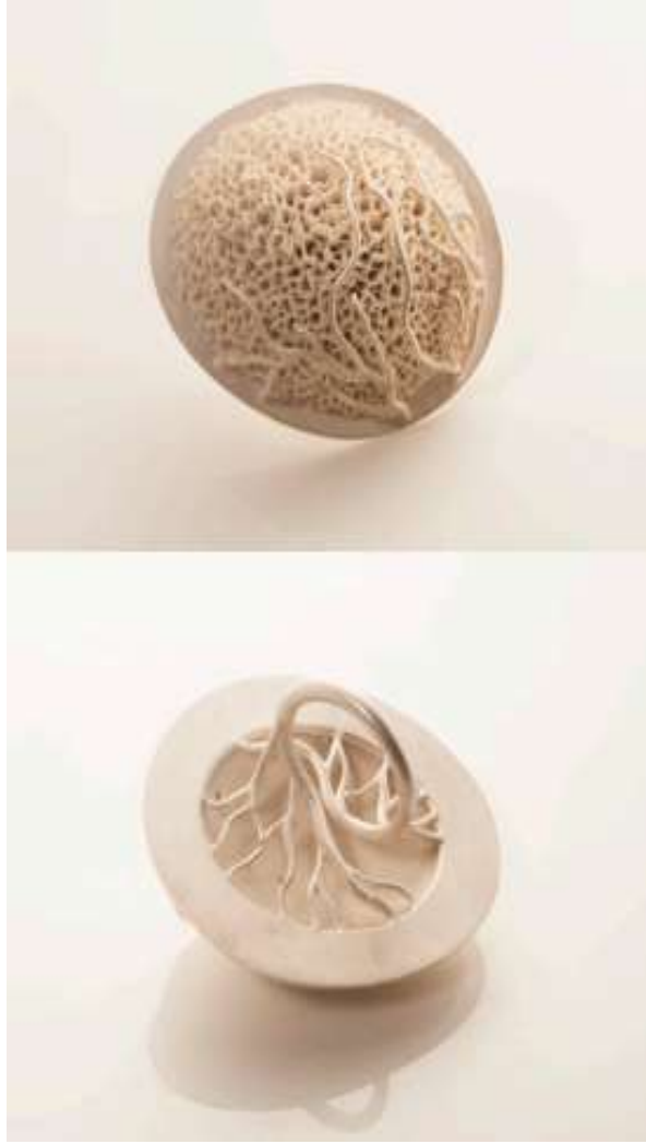
Şekil 1.24. Seramik yüzük üstten ve alttan görünümü