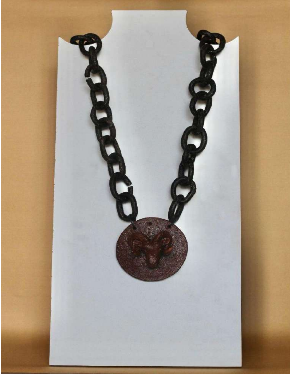
Şekil 3.34. Keçi figürlü kolye tasarımı, elle şekillendirme, 1050°C, 2024

Keçi figürlü kolye tasarımında keçi figürü yuvarlak plaka üzerine yerleştirilmiştir. Kolyenin gövdesi seramik zincirle yapılmıştır. Seramik zincir siyah renk sır ile ve keçi figürü kahverengi sır ile renklendirilmiştir. Kolyenin figürü, zincire ince bir deri ip ile bağlanarak son halini almıştır.