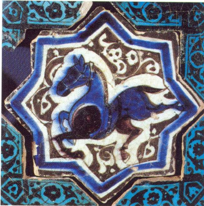
Şekil 2.8. At figürü. Sır altı. Kubad Abad, Büyük Saray. Karatay.

Başkurt destanlarında at, su unsuru olarak "Yılıkı" ve gök unsuru olarak "Tulpar" isimleriyle betimlenmiştir. At, bu destanlarda olağanüstü özelliklere sahip bir varlık olarak tasvir edilmekte ve tanrısal niteliklerle ilişkilendirilmektedir. At, Başkurt mitolojisinde önemli bir sembol olup, geleneksel adlarla anılmakta ve destanlarda sıkça yer almaktadır. Bu bağlamda, atın hem fiziksel hem de sembolik anlamda derin bir kültürel ve mitolojik önemi olduğu vurgulanmaktadır (Kara, 1997: 9).