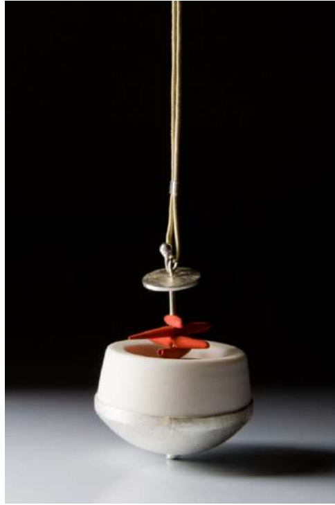
Şekil 1.25. Kolye ucu 4cm uzunluğunda 3,5 cm genişliğinde, porselen ve gümüş