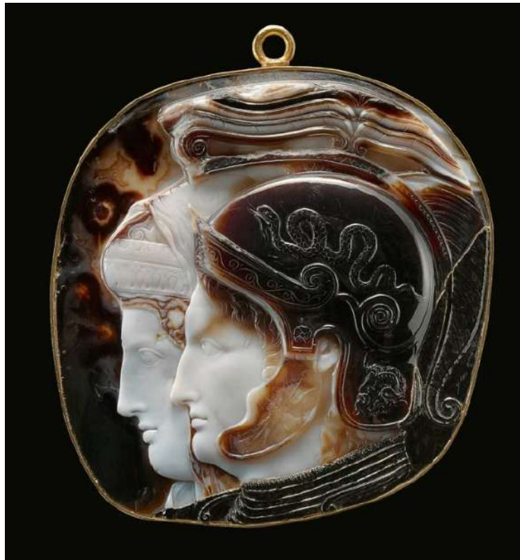
Şekil 1.13. Kabartma portrelerin olduğu boyun takısı örneği, M.Ö. 278-270, Viyana Sanat Tarih Müzesi.

Tarihte boyun takıları arasında ilk kullanılan takılar, pendants ve kolyeler olmuştur. Bu takılar, özellikle koruyucu etkilerine inanılan hayvan kemiklerinden yapılmış olup, farklı kültürlerde önemli bir yere sahiptir. Boyna takılan pendants, genellikle zincir ya da ince kordondan yapılmaktadır. Güç ve statü simgeleri olarak yaygın şekilde tercih edilen pendants, günümüzde de benzer işlevlere sahip muska biçimindeki takılarda kendini göstermektedir (Yıldırım, 2009).