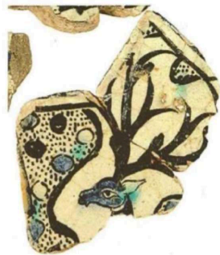
Şekil 2.5. Anadolu Selçuklu Dönemine ait geyik motifi (Arık, 2007: 26)