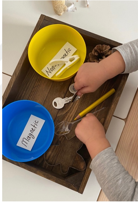
Şekil 2.9. Kaybolan Eşya Bulucu- Magneto Etkinliği.

yardımcı olmak için teknolojiyi kullanma fırsatlarını değerlendirmiştir. Burada kullanılan, tüm araç ve gereçler teknoloji olarak değerlendirilmektedir ve bunlar dijital araçlar ve ihtiyaçları karşılayan diğer araçlardır. Ancak erken çocuklukta tek başına dijital araçlar teknoloji olarak kabul edilmemektedir. Bu yüzden yapılan etkinliklerde kullanılan tüm araç ve gereçlerinin teknoloji olarak kabul edilmesiyle beraber Ata tüm etkinliklerde bilgiyi yapılandırırken yardımcı olmak için teknolojiyi kullanma fırsatını değerlendirmiştir. Burada da Şekil 2.9'de görüldüğü gibi Ata 2. Etkinlik olan Kaybolan Eşya Bulucu- Magneto Etkinliği esnasında kullandığı mıknatıs materyali ile bilgiyi yapılandırırken yardımcı olmak için teknolojiyi kullanma fırsatlarını değerlendirmiştir. Burada mıknatısın çektiği ve çekmediği materyalleri sınırlandırma üzerine kurgulanmış bir etkinlik görülmektedir.