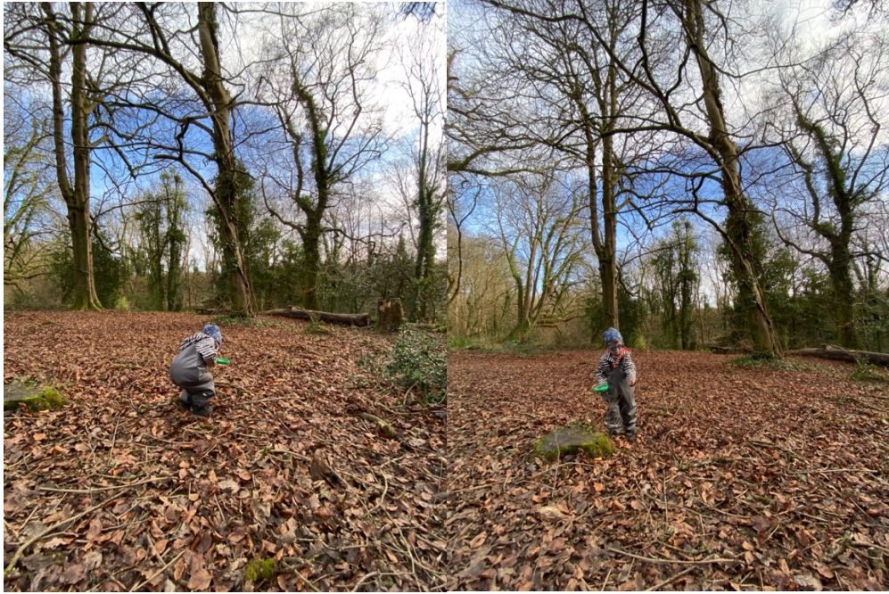
Şekil 2.7. Doğa Dedektifleri: Böcek Evi Tasarlama Etkinliği.

Birçok etkinlikte Ata'nın bu kazanıma karşılık cevaplar vermemiş olması da süreç içerisinde yapılan etkinlikler ve/veya çocuğun var olan seviyesi bu kazanıma uygun olmamıştır. Buna rağmen 8, 9 ve 10 etkinlikler de Ata'nın olayların neden ve nasıl olduğu hakkında fikirlerini paylaştığı gözlemlenmiştir. Örnek olarak Şekil 2.7'de de görüldüğü gibi Ata 8. Etkinlik olan Böcek Evi Tasarlama Etkinliği için doğada malzeme toplamaktadır. Bu etkinlik sırasında Ata topladığı malzemeleri seçerken seçtiği malzemeleri neden seçtiğini açıklamış ve bu malzemeyi nasıl kullanacağı hakkında fikirlerini paylaşmıştır. (Gözlemci Notu: 31/12/2021)