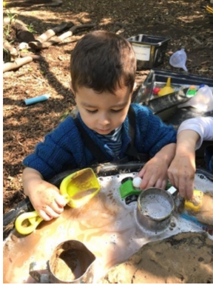
Şekil 2.13. Doğa Dedektifleri: Göl Habitatu Oluşturalım Etkinliği.

“Kendi düşüncelerini ifade eder.” kazanımı için Ata yapılan etkinliklerde bilim ve matematik uygulamaları çerçevesinde 10 etkinliğin hepsinde kendi düşüncelerini ifade etmiştir. Ata etkinlikler sürecinde kendisine yönlendirilen sorular çerçevesinde konu ile ilgili fikirlerin ifade edip kendi farkında olduğu durumlardan bahsetmiştir.