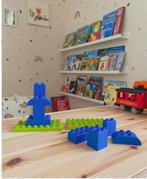
Şekil 2.11. Kodlamaya Giriş:101 Etkinliği.

“Gözlemlerini ve gördükleri desenleri açıklar.” olarak tanımlanan kazanım için Ata yapılan 10 etkinlik sonucunda bilim ve matematik uygulamaları çerçevesinde toplamda 2 etkinlikte gözlemlerini ve gördükleri desenleri açıklamıştır. Ancak diğer 8 etkinlikte gözlemlerini ve gördükleri desenler hakkında görüş bildirmemiştir. Bunun nedeni bu etkinliklerin desenleri açıklamaya yönelik etkinlikler olmasından kaynaklıdır.