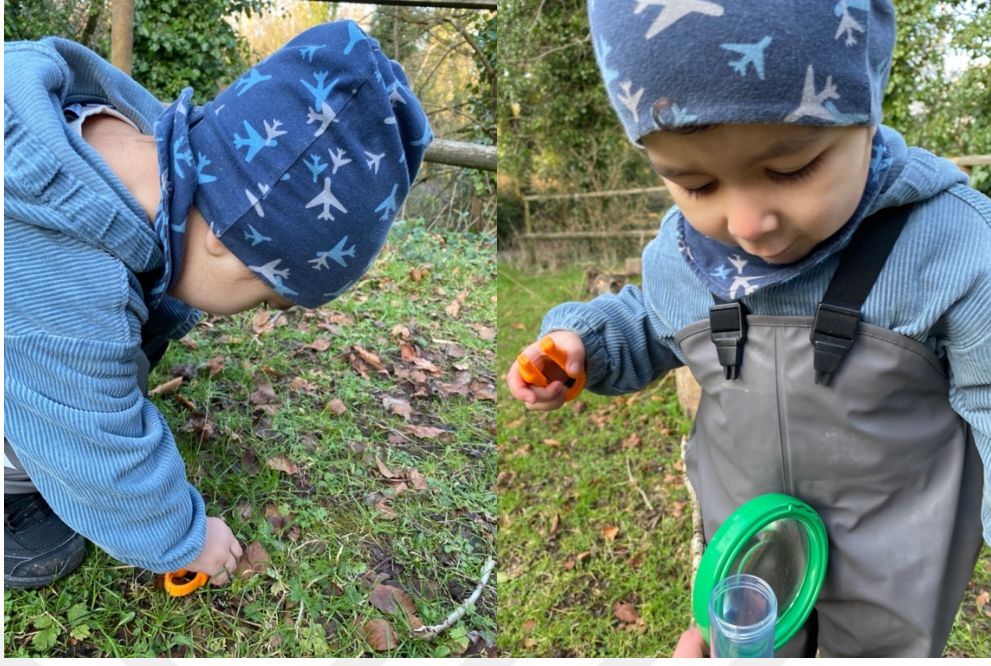
Şekil 2.8. Doğa Dedektifleri: Yaprak Avı Etkinliği.

Tablo ve gözlemci görüşmesi bulguları dahilinde FeTeMM disiplinlerinden bilim ve mühendislik alanında gözlenmesi beklenen davranışlara ilişkin bulgular incelendiğinde paralellik gösterdiği sonucuna ulaşılmıştır. Ata'da gözlenmesi beklenen davranışlar, etkinliklerin neredeyse tamamında gözlemlenmiş ve gözlemci görüşleriyle aranan davranışların gözlemlendiği desteklenmiştir. 'Afacan Kedi Pıtırı Kurtarma, Kaybolan Eşya Bulucu-Magneto, Suyu Taşıyalım, Okyanusları Temizleyelim, Doğa Dedektifleri: Böcek Evi Tasarlama, Donmuş Okyanusta Canlıları Kurtarma, Doğa Dedektifleri: Göl Habitatı Oluşturalım' etkinliklerinde Ata'nın problem durumlarını tanıdığı, karşılaştığı bu problem durumlarına çözüm önerileri ürettiği ve aynı zamanda kendi fikirlerini ifade ettiğini gözlemlenmiştir.