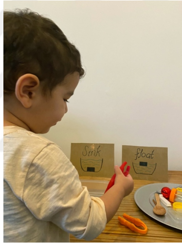
Şekil 2.3. Afacan Kedi Pıtırı Kurtarma Etkinliği.

Şekil 2.3'te görüldüğü gibi Afacan Kedi Pıtırı Kurtarma etkinliği FeTeMM'in dört disiplin alanını karşılamaktadır. Etkinliğin amacı sıvının içerisindeki cisimlerin yüzmeye ve batma durumuna göre maddeleri sınıflandırabilme, uygun malzemeyi kullanarak sıvının içerisinde yüzen bir materyal tasarlamadır. Etkinlik üç ayrı bölümden oluşup 30 dakikan toplam 90 dakika olarak planlanmıştır.