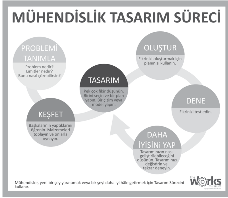
Şekil 2.2. Mühendislik Tasarım Süreci