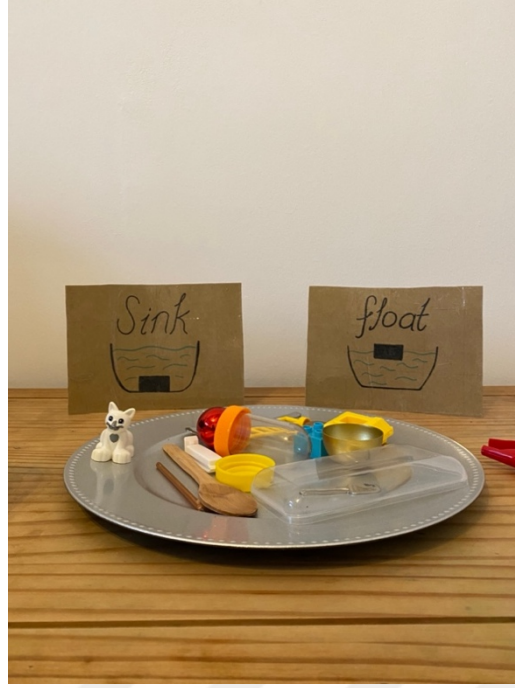
Şekil 2.6. Afacan Kedi Pıtırı Kurtarma Etkinliği.

“Gözlemler, öğrenmeler ve deneyimleri hakkında tartışır.” olarak değerlendirilen kazanım için, Ata yapılan 10 etkinliğin toplam 8 tanesinde gözlemler, öğrenmeler ve deneyimleri hakkında etkinlik süresince tartışmıştır. Ata’nın gözlemler, öğrenmeler ve deneyimleri hakkında düşünmesi, tanım yapması ve süreci tartışması birbirini destekleyici niteliktedir. Gözlemler, öğrenmeler ve deneyimler hakkındaki düşünme ve tanım yapma davranışının sonucunda tartışma davranışının ortaya çıktığı etkinlik sürecinde açık bir şekilde gözlemlenmiştir. Ancak 2. ve 7. etkinliklerde tartışma davranış gözlemlenmemiştir. Merak etme davranışı ile karşılaştırıldığında Ata’nın merak etmediği sürece soru sorma davranışında bulunmadığı sonucuna ulaşılmıştır. Gözlemci ise bu durumu şu şekilde açıklamaktadırlar: