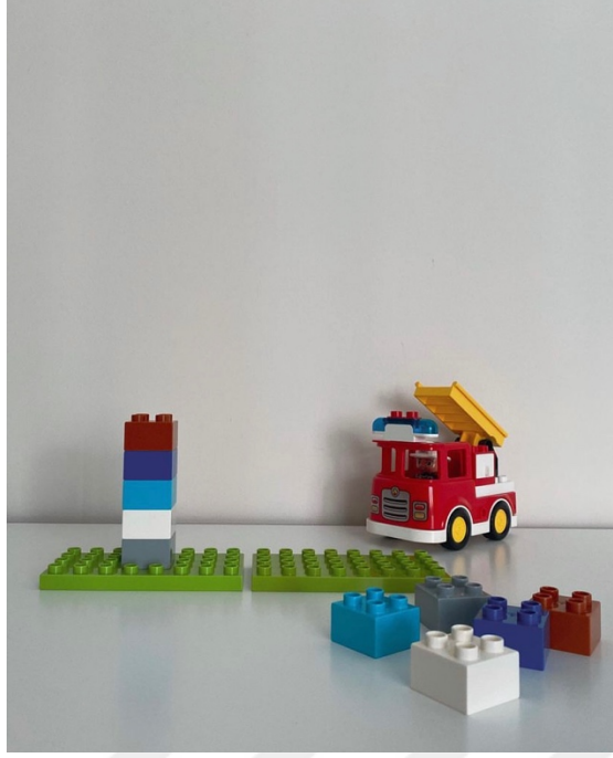
Şekil 2.12. Kodlamaya Giriş:102 Etkinliği.

“Serbest parçaları kullanarak (kozalak, taş, dallar, gibi) düşüncelerini çizimlerde, tasarımlarda kullanırlar.” kazanımı için, Ata yapılan 10 etkinlik sonucunda bilim ve matematik uygulamaları çerçevesinde toplamda 6 etkinlikte serbest parçaları kullanarak (kozalak, taş, dallar, gibi) düşüncelerini çizimlerde, tasarımlarda kullanmıştır. Ancak yapılan 2., 3., 5. ve 7. etkinliklerde ise serbest parçaları kullanarak (kozalak, taş, dallar, gibi) düşüncelerini çizimlerde, tasarımlarda kullanmamıştır. Etkinlikler göz önünde bulunduğu Ata'nın özellikle problem durumlarına çözüm bulduğu çalışmalarda çizim ve tasarım yaptığı fark edilmiştir. Yapılan etkinlikler sürecinde, ilişkili olduğu sürece serbest parçalar etkinliklerin içerisinde kullanılabilmiştir ve bu yargıları destekleyen gözlemci ifadeleri şu şekildedir: