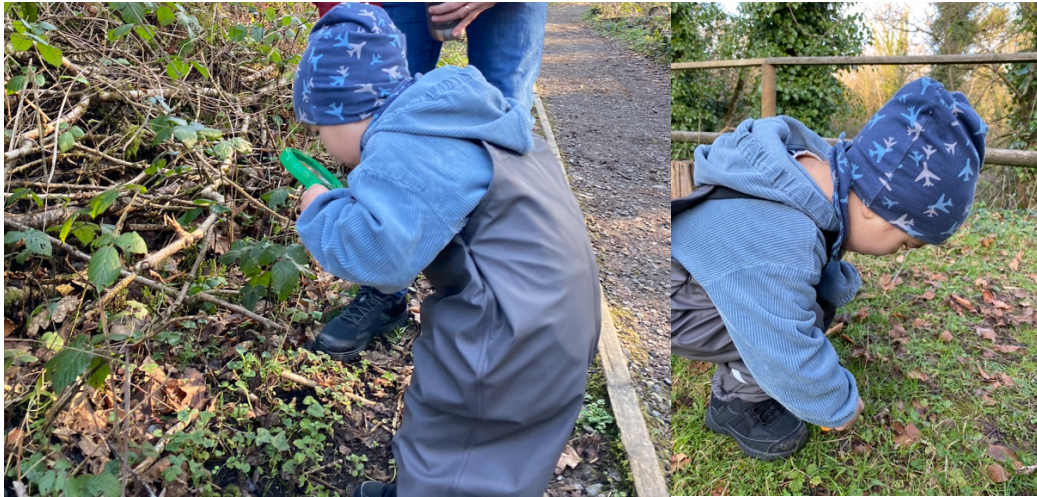
Şekil 2.4. Doğa Dedektifleri: Yaprak Avı Etkinliği.

Doğa Dedektifleri: Yaprak Avı etkinliği FeTeMM'in dört disiplin alanını karşılamaktadır. Etkinliğin amacı Doğayı keşfetme, yakından tanıma ve çevreyi anlamlandırma. Etkinlikte toplanan malzemelerden kendi ağacımızı tasarlamadır. Etkinlik iki gün olarak tasarlanmıştır. Yaprak Avı toplama sürecinde Şekil 2.4'teki görsellerde görüldüğü gibi ormana gidilerek etkinlik için ormandan gerekli malzemeler toplanmış ve kendi ağacını tasarlama süreci ile devam etmiştir.