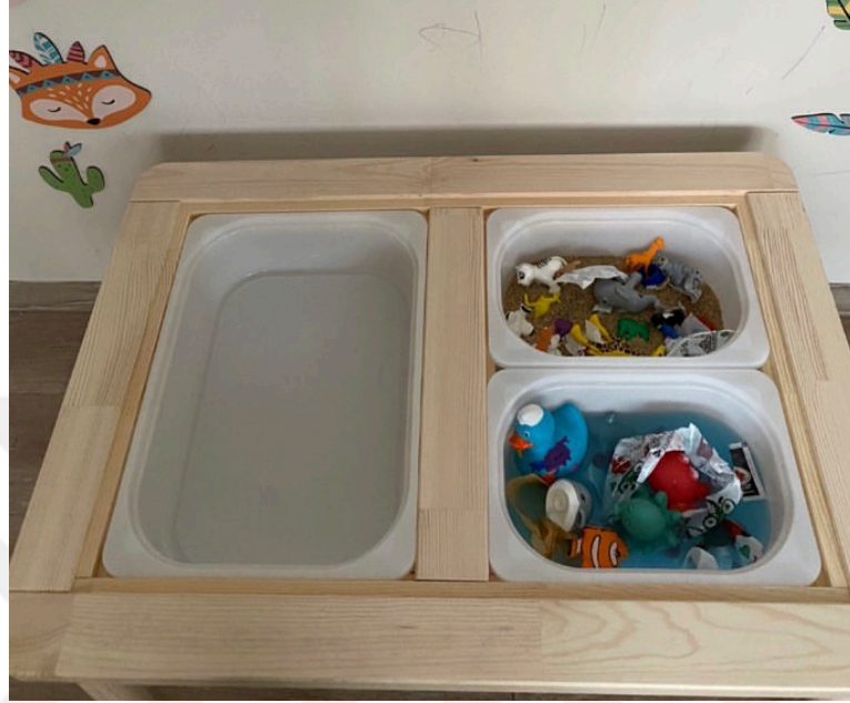
řekil 2.5. Okyanusları Temizleyelim Etkinliđi.

Okyanusları Temizleyelim etkinliđi FeTeMM'in drt disiplin alanını karřılamaktadır. Etkinliđin amacı kirlenen okyanuslarda yařayan canlıları kirlilikten kurtarmak ve elimizdeki malzemeleri kullanarak bunu yapabilecek bir materyal tasarlamadır. Etkinlik ç ayrı blmden oluřup 30 dakikan toplam 90 dakika olarak planlanmıřtır.