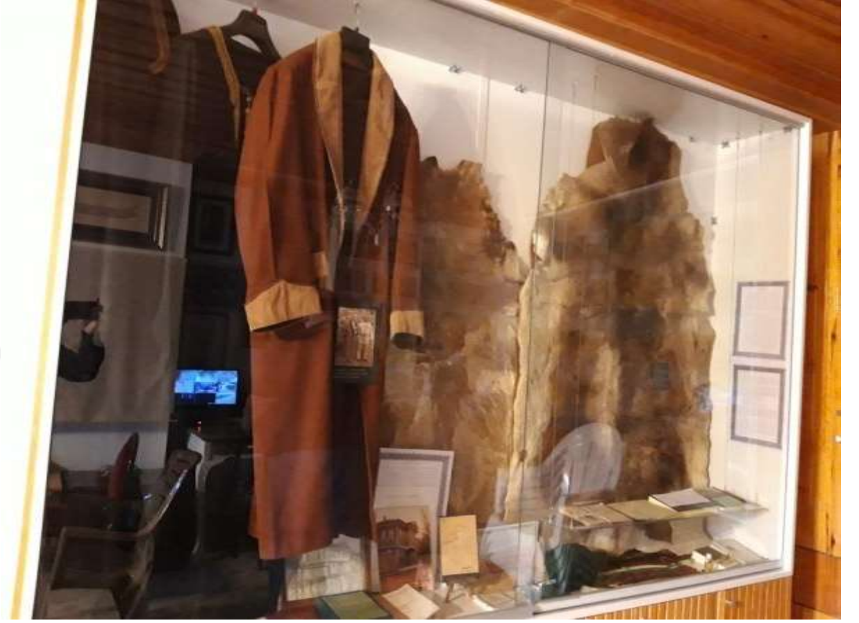
Resim 9: İlâhi Işık derneğinde bulunan Pilavođlu'nun giydiđi giysiler müzesi.