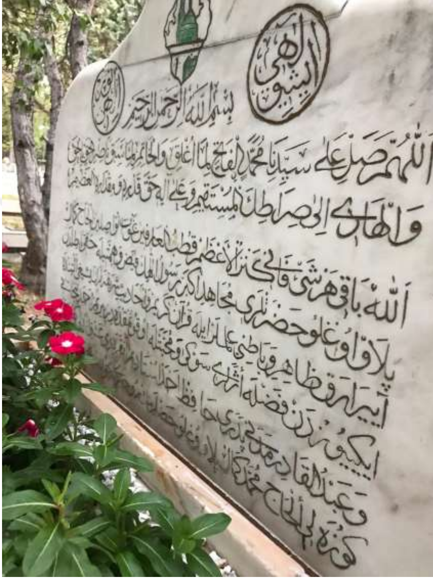
Resim 3: Pilavoğlu'nun mezar taşında, özellikle Ticâniyye tarikatında çok önem arz eden Salâtü'l Fâtih ve Cevheratü'l Kemâl yazısı bulunmaktadır.