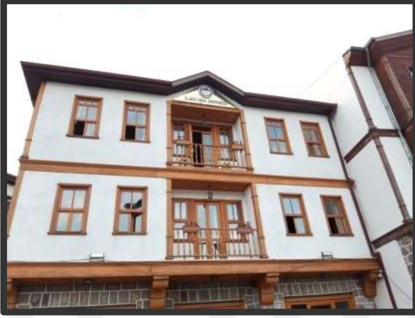
Resim 6 ve 7: Ankara'nın Altındağ ilçesine bağlı Ulusta bulunan İlâhi Işık derneği ve Pilavoğlu'nun kitaplarının satıldığı Pilavoğlu kitabevinin dükkânı. Bu dernekte Tîcâniler Cuma ve ikindi vazifelerini yaparlar, ramazan ayında mukabele okunur ve iftar verilir.