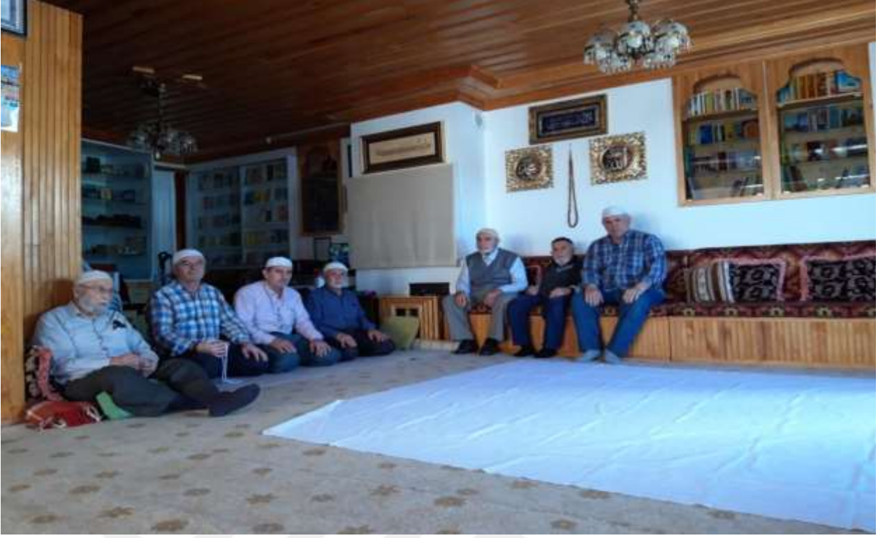
Resim 8: Ulusta bulunan İlâhi Işık derneğinde Tîcâniler ikindi vazifesinin zikrini çekerken çekilmiş fotoğraf. Ortada serilmiş olan beyaz sofranın ortaya serilmesinin nedeni, vazifede okunan “Cevheratu’l kemâl” yedinci kez okunmaya başlandığında Pilavoğlu, Peygamber Efendimiz ve dört halifesi, Ahmed et-Tîcâni gelir. Onlara hürmeten vazife yaparken beyaz sofraya serilir.