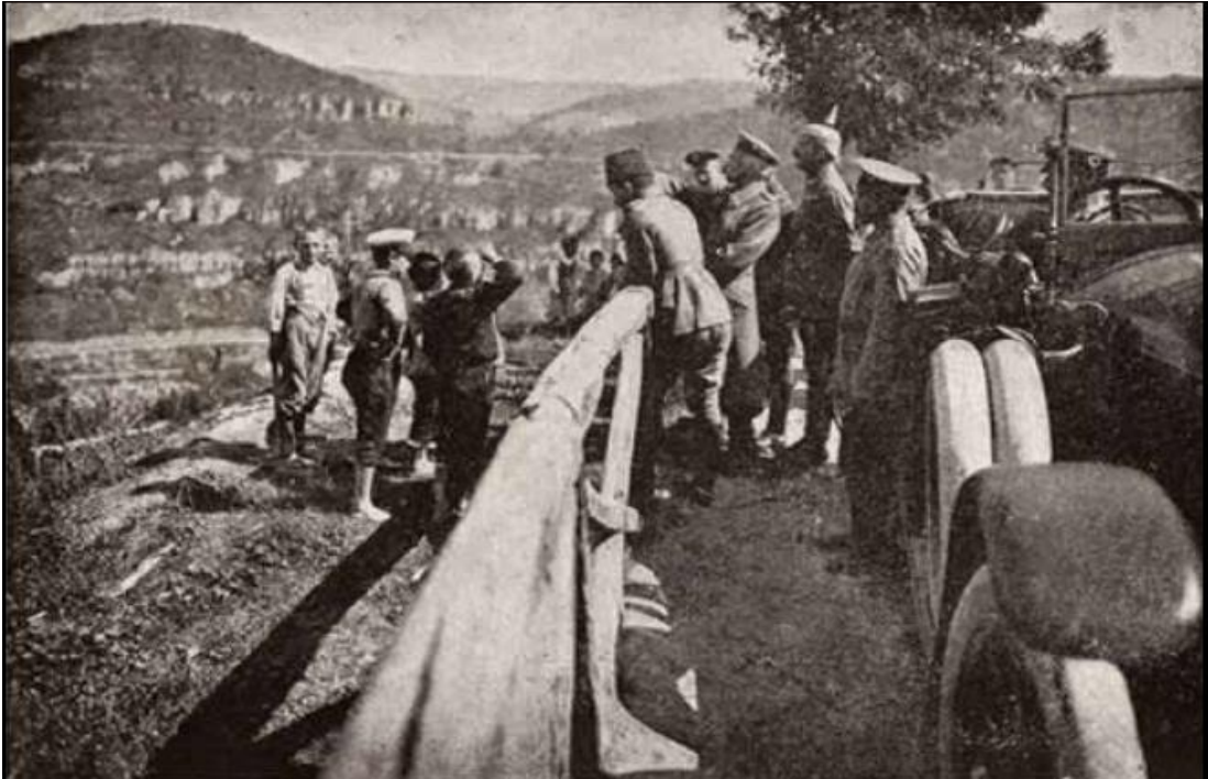
Enver Paşa, Mareşal Makenzin ve maiyeti Dobruca cephe-i harbinde ( Harp Mecmuası , Y.1, S. 12, s. 179.)