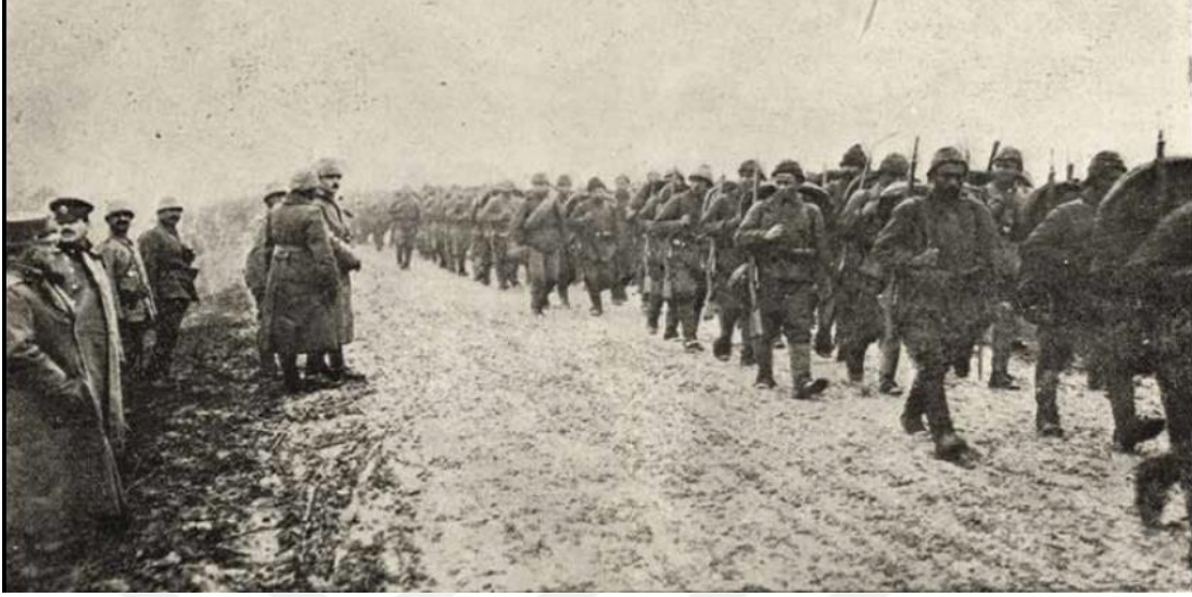
Romanya Cephesi'nde askerlerimiz Başkumandan Vekilimiz önünden Tuna'yı geçmeye giderlerken ( Harp Mecmuası , Y. 2, S. 15, s. 228.)