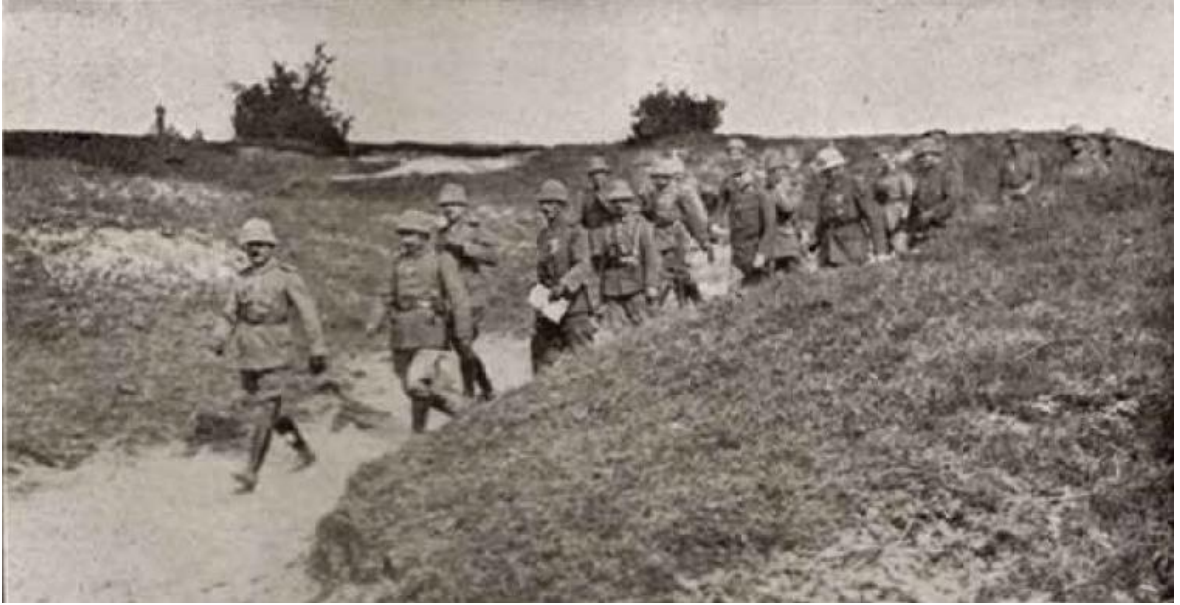
Enver Paşa, Galiya cephe-i harbinde müdafaa mevzilerini teftiş ederken ( Harp Mecmuası , Y.1, S.12, s. 180)