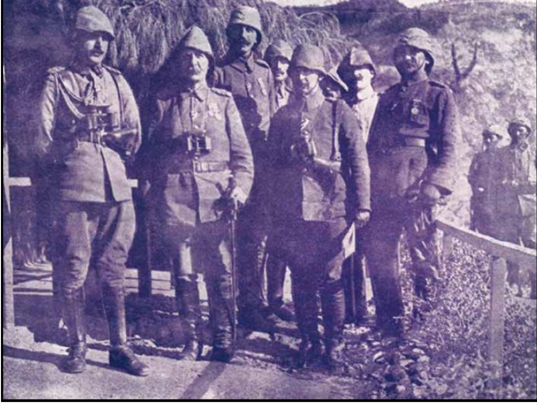
Başkumandan Vekili Enver Paşa Gelibolu harp cephesinde bir kolordu karargâhında, yanlarında kolordu kumandanı Esad Paşa ve erkânı. ( Harp Mecmuası , Y. 1, S. 1, s. 5).