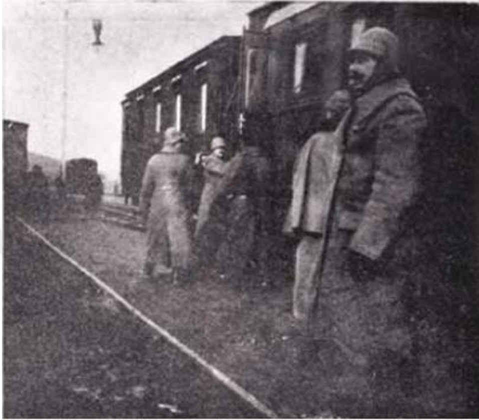
Çanakkale'den kaçırılan düşmanın son enkazını temaşadan avdet eden Başkumandan Vekili Enver Paşa, Uzunköprü İstasyonundan vagona binerken ( Harp Mecmuası , Y. 1, S. 4, s. 59)