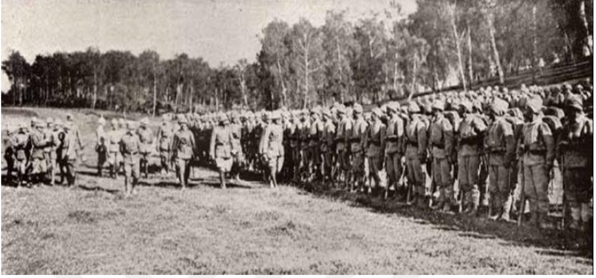
Galiya cephe-i umumi gerisinde ihtiyat kit'atımızdan birinin kumandan vekilimiz tarafından teftişi ( Harp Mecmuası , Y.1, S. 12, s. 180.)