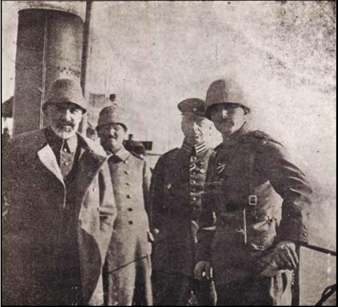
Başkumandan Vekili Enver Paşa ve fahri süvari mülazımı Adliye Nazırı İbrahim Bey Çanakkale harp cephesinde torpito ile Beşinci Ordu karargahına giderlerken