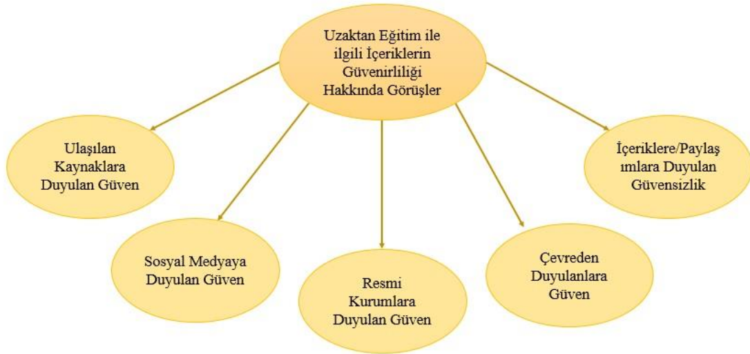
Şekil 1. Uzaktan Eğitim ile ilgili İçeriklerin Güvenirliliği Hakkında Görüşlerine ait Alt Temalar

Araştırmada yer alan görüşme formunda “Uzaktan eğitim ile ilgili içeriklere (haber siteleri, sosyal medya, çevrenizdeki insanlardan duyduklarınız vb.) hangi yolla ulaşıyorsunuz? Bu içeriklere neden güvendiğinizi açıklayınız.” sorusu bir tema olarak üstteki başlıktaki şekliyle ele alınmıştır. Bununla birlikte araştırma örnekleminde bulunan velilerin bu soruya verdikleri yanıtlar uygun alt temalara ayrılmıştır. Aşağıda bu alt temalara ait başlıkların altında velilerin görüşlerinden elde edilen bulgulara yer verilmiştir. Bu bölüme ait tema ve alt temalar şema şeklinde aşağıda gösterilmiştir (Şekil 1).