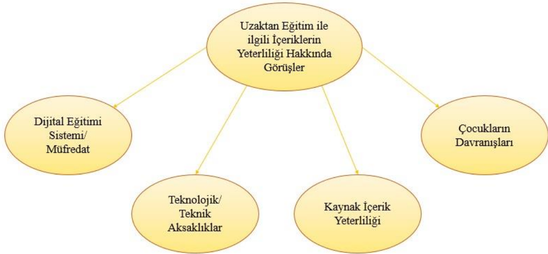
Şekil 5. Uzaktan Eğitim ile ilgili İçeriklerin Yeterliliği Hakkındaki Görüşlere Ait Alt Temalar

Araştırmada yer alan görüşme formunda “Uzaktan eğitim ile ilgili içerikler sizce yeterli midir? Yeterli ya da yetersiz bulma nedenleriniz nelerdir? Açıklayınız.” sorusu bir tema olarak üstteki başlıktaki şekliyle ele alınmıştır. Bununla birlikte araştırma örnekleminde bulunan velilerin bu soruya verdikleri yanıtlar uygun alt temalara ayrılmıştır. Aşağıda bu alt temalara ait başlıkların altında velilerin görüşlerinden elde edilen bulgulara yer verilmiştir. Bu bölüme ait tema ve alt temalar şema şeklinde aşağıda gösterilmiştir (Şekil 5).