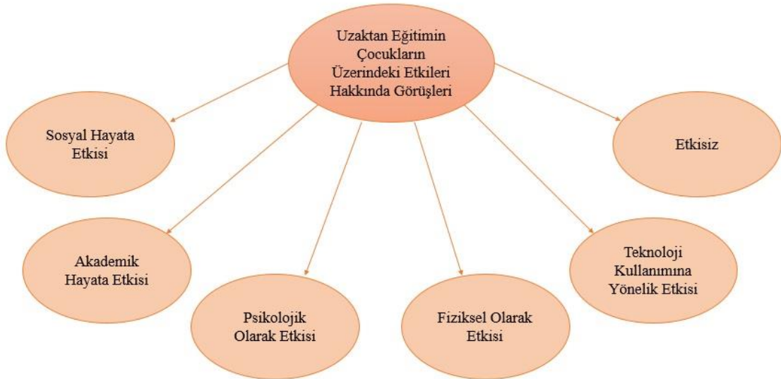
řekil 3. Uzaktan Eđitimin ocukların zerindeki Etkileri Hakkındaki Grřlere Ait Alt Temalar

Arařtırmada yer alan grřme formunda “Uzaktan eđitim ocuđunuzun okula ve evreye karřı olan davranıřlarını etkiledi mi? Etkilediyse nasıl etkilediđini dřnyorsunuz? Etkilemediyse neden etkilemediđini dřnyorsunuz? Aıklayınız.” sorusu bir tema olarak stteki bařlıktaki řekliyle ele alınmıřtır. Bununla birlikte arařtırma rnekleminde bulunan velilerin bu soruya verdikleri yanıtlar uygun alt temalara ayrılmıřtır. Ařađıda bu alt temalara ait bařlıkların altında velilerin grřlerinden elde edilen bulgulara yer verilmiřtir. Bu blme ait tema ve alt temalar sema řeklinde ařađıda gsterilmiřtir (řekil 3).