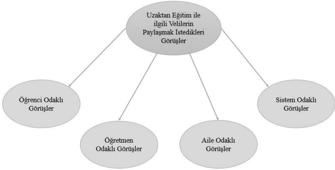
Şekil 7. Uzaktan Eğitim ile ilgili Velilerin Paylaşmak İstedikleri Görüşlere Ait Alt Temalar