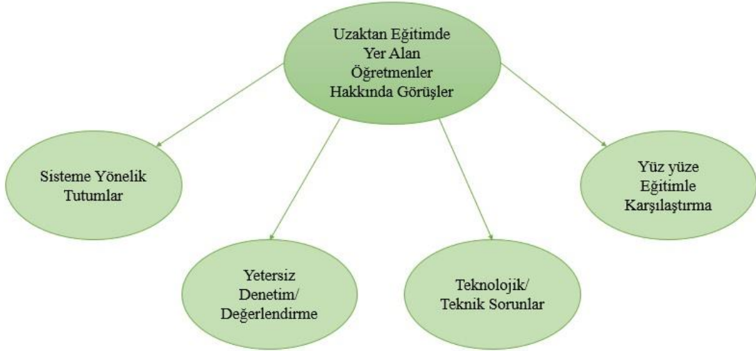
Şekil 4. Uzaktan Eğitimde Yer Alan Öğretmenler Hakkında Görüşlere Ait Alt Temalar