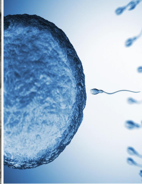
Resim 12 Fertilizasyon

Neolitik Dönem insanlarına daha önce de belirttiğimiz gibi üstenci bir bakış açısıyla bakmamamız gerekliliği onların ilkel olmadıklarının kabulünü doğurur. Önermemiz zigot halini almak üzere olan bir yumurta ve sperm burada özel alanlarla tasvir edilmiş olabileceği yönündedir. Ayrıca falluslu yapıda dudakları dışarıya doğru çıkık olan, yılan başlı adam olarak betimlenen , falluslara doğru bakan ve büyük ihtimalle erkek figür olduğu tahmin edilen adam heykeli İslamiyet'teki ve bazı dinlerdeki Tanrı'nın ruha üfürme metaforunu çağrıştırmaktadır.