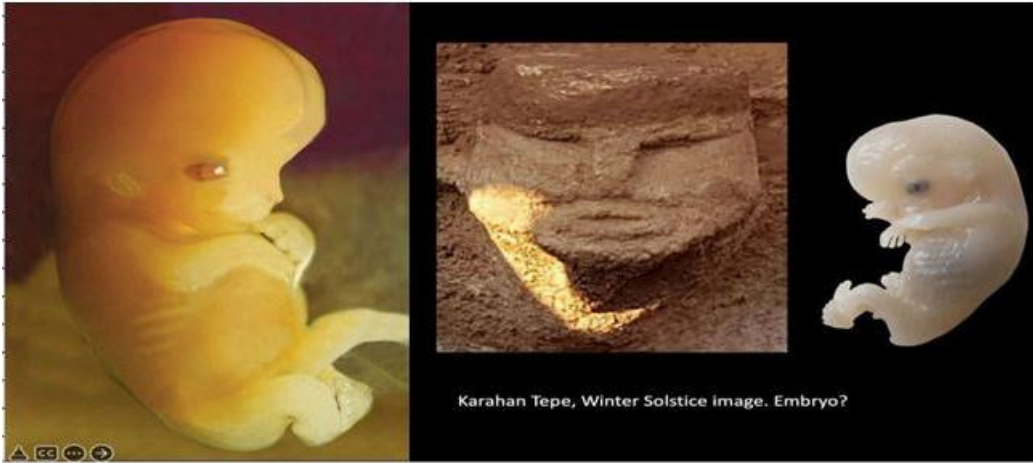
Resim 13 Kış Döngüsü Güneş Işıkları

Sonuç olarak, Karahantepe, yalnızca bir tapınım alanı değil; aynı zamanda kozmik döngüler, doğa ve insan yaşamı arasındaki sembolik ilişkilerin vücut bulduğu çok katmanlı bir ritüel ve inanç merkezi olarak değerlendirilmelidir.