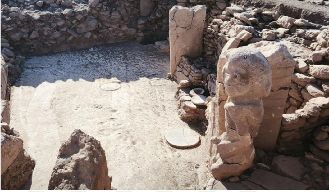
Resim 9 Karahantepe Erekte Erkek Heykeli

Orta Fırat Havzası'nda, özellikle Göbeklitepe başta olmak üzere Karahantepe ve Sayburç gibi yerleşimlerde ortaya çıkarılan arkeolojik veriler, fallus simgesinin Neolitik Dönem inanç yapısında önemli bir sembolik anlam taşıdığını göstermektedir. Göbeklitepe'deki hayvan kabartmaları arasında fallusu belirgin şekilde betimlenmiş figürlerin bulunması; Sayburç'taki özel yapıda yer alan, fallusu vurgulanan insan figürü ve Karahantepe'de açığa çıkarılan falluslu yapı ile birlikte değerlendirildiğinde, bu sembollerin yalnızca cinsellikle ilişkili birer betimlemeden öte, doğurganlık, üretkenlik, yaşam-ölüm döngüsü ve kozmik düzenle ilişkili kutsal göstergeler olduğu düşünülebilir. Söz konusu fallik imgelerin hem insan hem de hayvan figürleriyle temsil edilmesi, Neolitik Dönem'de doğa ile insan arasındaki ilişkilerin yalnızca işlevsel değil, aynı zamanda mitolojik ve ritüelistik bir çerçevede algılandığını göstermektedir. Bu bağlamda fallus, yalnızca biyolojik değil, aynı zamanda kozmik yaşamın sürekliliğini sağlayan bir unsur olarak kült alanlarında merkezi bir rol üstlenmiş olabilir. Özellikle Karahantepe'deki ritüel alanlarda fallus biçimli dikilitaşların düzenli bir plan içinde konumlandırılmış olması, bu yapının yalnızca bireysel ibadetlere değil, toplumsal ritüellere de sahne olduğunu göstermektedir. (Ekinbaş Can, 2025, s. 31)