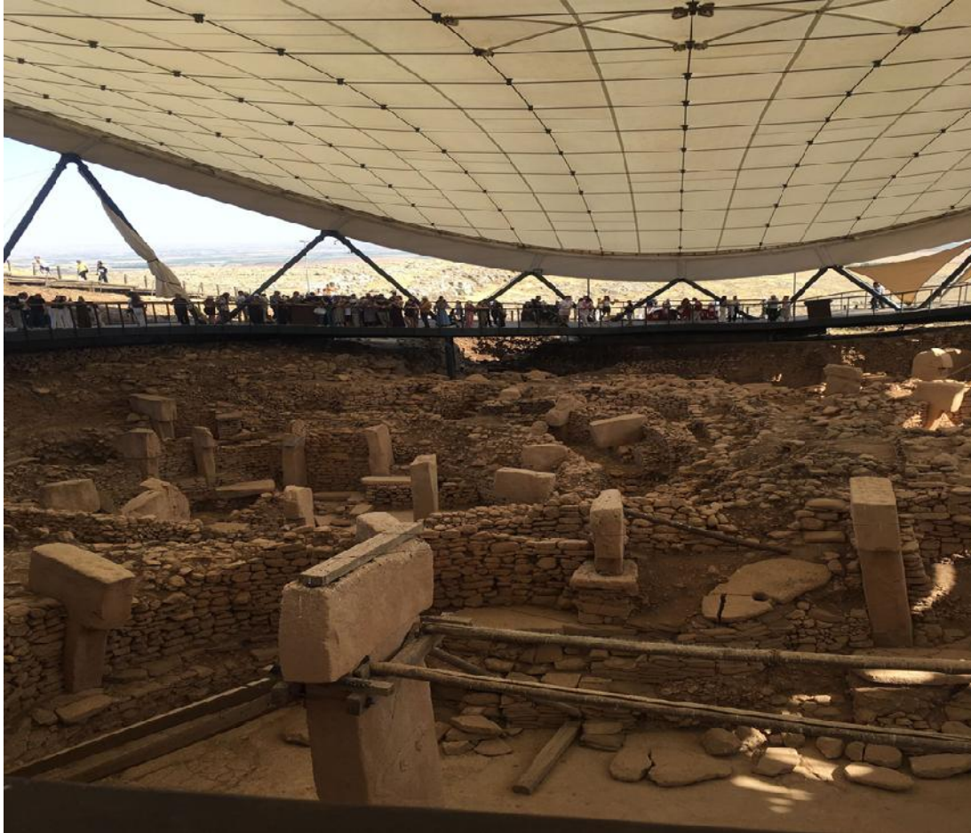
Resim 1 Göbeklitepe Genel Görünüm

Höyüğün yüzeyine yayılmış kayda değer miktarda çakmaktaşı buluntuları, buranın Neolitik Çağ'a ait önemli bir yerleşme olduğunu göstermiştir. Ancak kireçtaşıdan yapılmış görkemli T biçimli dikilitaşlar, Alman Arkeoloji Enstitüsü'nden Harald Hauptmann ve Klaus Schmidt'in Şanlıurfa Müzesi ile yakın işbirliği içinde yürüttüğü ilk kazılara kadar tespit edilememiştir. Bu kazılar 1995 yılında başlamış ve 2014 yılına kadar Schmidt yönetiminde devam etmiştir. Kazı projesi 2014 yılında Şanlıurfa Arkeoloji Müzesi, 2019 yılından itibaren ise İstanbul Üniversitesi Tarihöncesi Arkeolojisi Anabilim Dalından Prof. Dr. Necmi Karul yönetiminde devam etmektedir. Dr. Lee Clare, 2014 sonbaharından bu yana Alman Arkeoloji Enstitüsü'nün saha ve araştırma direktörlüğü görevini yürütmektedir. Göbeklitepe'deki iki kalıcı koruyucu çatının 2017 yılında tamamlanmasının ardından, alan 2018 yılında UNESCO tarafından Dünya mirası listesine alınmıştır. (Karul, 2023)