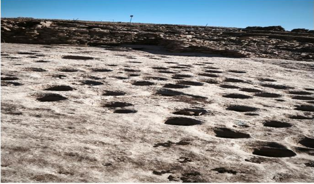
Resim 5 Karahantepe Su Mimarisi Örneği