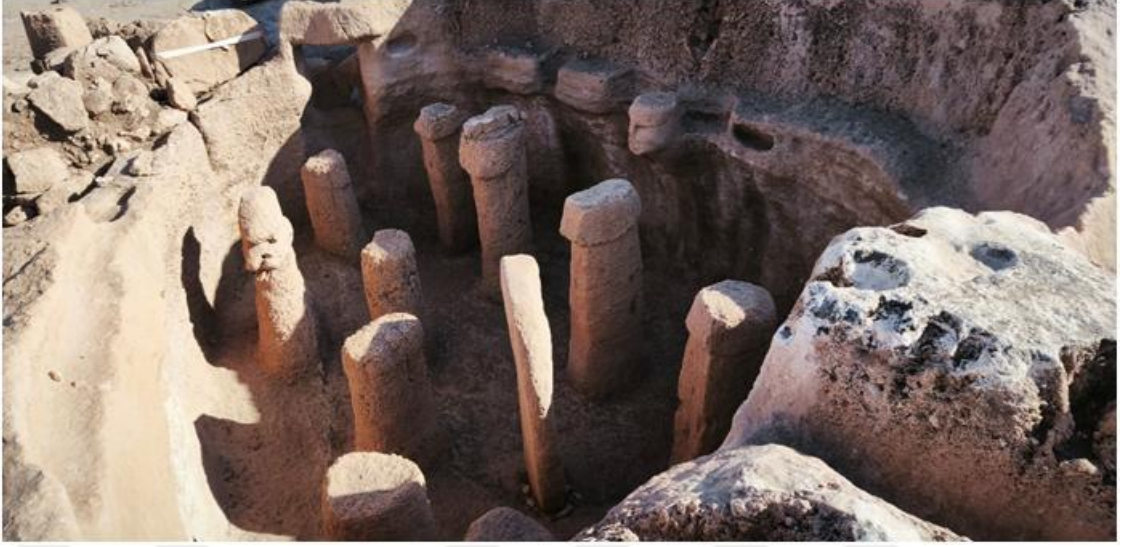
Resim 8 Boynu Yılan Şeklinde Oyulmuş Baş Heykeli/Erginlik Ritüel Alanı/AD Yapısını AB Yapısına Bağlayan Kapı

Söz konusu figürün karşısında, ön sırada dört, arka sırada altı adet olmak üzere toplam on adet fallus biçimli dikilitaş düzenlenmiştir. Bu yerleşim planı, hem figüratif anlatının merkezleştirildiği bir yönelimi, hem de toplu ritüel uygulamalara imkân veren bir düzenlemeyi düşündürmektedir. Yapının bir yanından basamaklarla inilirken diğer yanından yine basamaklarla çıkılması, törenlerin yönlendirilmiş bir mekânsal kurguyla tasarlandığını düşündürmektedir. Tüm bu bulgular bir arada değerlendirildiğinde, AB Yapısı'nın açık bir şekilde ritüelistik bir işlev taşıdığı sonucuna varmak mümkündür. (Karul, 2021, s. 28)