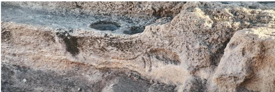
Resim 4 Anakayaya Oyulmuş Tilki ve Yılan Figürü

Günümüzde ise Tek Tek Dağları’nda bu fauna yapısının büyük ölçüde zayıfladığı görülmektedir. Ceylan, keklik, bıldırcın, akbaba, kartal, yılan, tilki ve tavşan gibi türler hâlâ gözlenebilmekle birlikte, sayılarında ciddi bir azalma söz konusudur. (Gür & Erduran Nemutlu, 2021, s. 181) Bu durum, Karahantepe’nin inşa edildiği dönemin fauna kompozisyonuyla günümüz arasında doğal sürekliliğin izlenebileceğini ancak insan etkisiyle bu zenginliğin zamanla kayba uğradığını ortaya koymaktadır. Türkiye’nin önemli Neolitik yerleşimlerinden Karahantepe’de gerçekleştirilen kazılarda, leopar, kurt, akbaba ve tilki gibi çeşitli hayvan kemikleri keşfedildi. Arkeologlar, aynı zamanda bu eski yapılarda çok sayıda ocak tespit ederek, toplumsal yaşam ve ritüeller hakkında yeni ipuçlarına ulaşmıştır. (Karul, 2024)