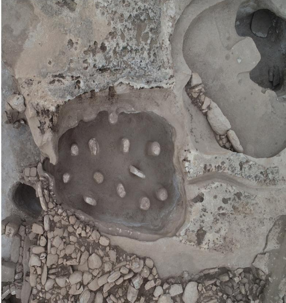
Resim 11 Sperm ve Yumurta Tasviri 2

AB yapısının oluşturduğu şekil ile sıvı kanalı kıvrımına bütüncül olarak bakıldığında sperm tekil halini (spermatozoon) andıran bir görüntü oluşmaktadır. AB yapısıyla bitişik olan AD yapısı da bir yumurtayı andırmaktadır. Hem AB yapısını hem AD yapısını bütüncül olarak gözlemlediğimizde ise ortaya döllenmek üzere olan bir yumurta (zigot öncesi-fertilizasyon) şekli çıkmaktadır. Ayrıca kazı ve Taş Tepeler Projesi başkanı Prof. Dr. Necmi Karul ve ekibi tarafından yapılan sıvı deneyinde; AB yapısının üzerindeki kıvrımlı su kanalına sıvı döküldüğünde, sıvı AB yapısına akmaktadır. AB yapısının içindeki sıvı, belirli bir seviyeye ulaştığında, sıvının AD yapısının içindeki taş havuza döküldüğü gözlemlenmiştir. Bu durum yapının bütüncül olarak tasarlandığına işaret etmektedir. (Yenen, 2022)