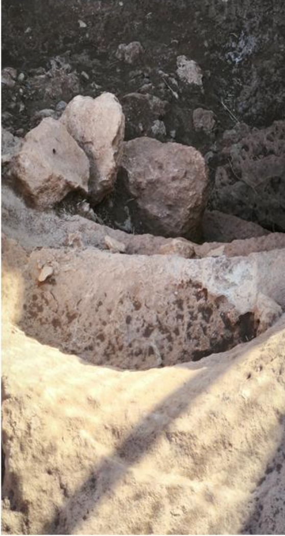
Resim 6 Karahantepe Merdiven Mimarisi Perspektif A