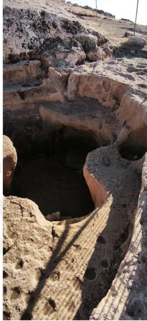
Resim 7 Karahantepe Merdiven Mimarisi Perspektif B