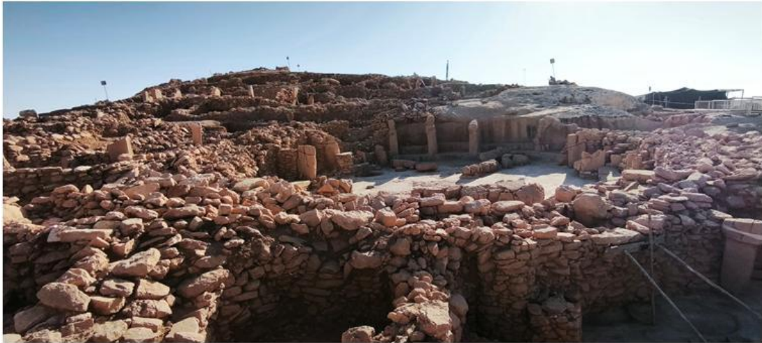
Resim 2 Karahantepe Genel Görünüm

T.C. Kültür ve Turizm Bakanlığı tarafından 2021 yılında başlatılan Karahantepe'nin de içinde yer aldığı "Taş Tepeler Projesi" ile Şanlıurfa'da yer alan Neolitik merkezler farklı üniversitelerin işbirliğiyle ortaya çıkarılmaya başlandı. Burada yürütülen koordineli çalışmanın arkeolojik buluntuları ile heyecan yaratan Göbeklitepe'yi daha iyi ve bütüncül olarak anlamamıza olanak sağlaması beklenmektedir. Bu Neolitik merkezlerin tarihsel olarak Göbeklitepe'ye en yakın olanı Karahantepe olarak karşımıza çıkmaktadır. Göbeklitepe'nin kardeşi kabul edilebilecek bir tarihsel aralığa sahip olması, benzer arkeolojik buluntulara ve sembolizme sahip fakat farklı ritüel emareleri de barındırması açısından Göbeklitepe'ye bir ayna olabilecek potansiyeli ile Karahantepe birçok Neolitik merkezden ayrı bir öneme sahiptir. (Karul, Taş Tepeler, 2025)