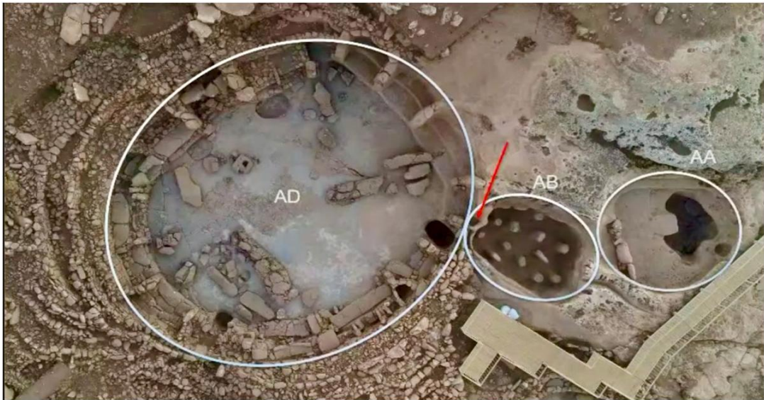
Resim 10 Karahantepe'de Sperm Ve Yumurtayı Andıran Yüzey Şekli

Erginlik ayını yapıldığına dair kuvvetli bir ihtimali barındıran Karahantepe'de falluslu insan heykeli ve falluslardan oluşan AB yapısı dikkat çekmektedir. Yapılar arasında bulunan merdivenler ve geçiş kapısı bu özel alanların bütüncül olarak tasarlandığını göstermektedir. Bölgede yaptığımız incelemelerde falluslu yapı olarak tabir edilen AB yapısında, arkeologların ve araştırmacıların sıvı kanalı olarak işlevini belirttiği oyuğu yukarıdan incelediğimizde sıvı kanalının oluşturduğu kıvrımın AB yapısına bitişik olduğunu görüyoruz. AB yapısı bir insanın geçebileceği büyüklükte yuvarlak bir delik ile AD yapısına bitişik inşa edilmiştir.