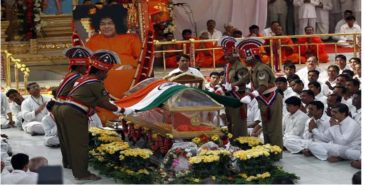
Resim 8: Sai Baba'nın üç gün boyunca halkın gösterimine açık, cam fanusta bekletilen cenazesi