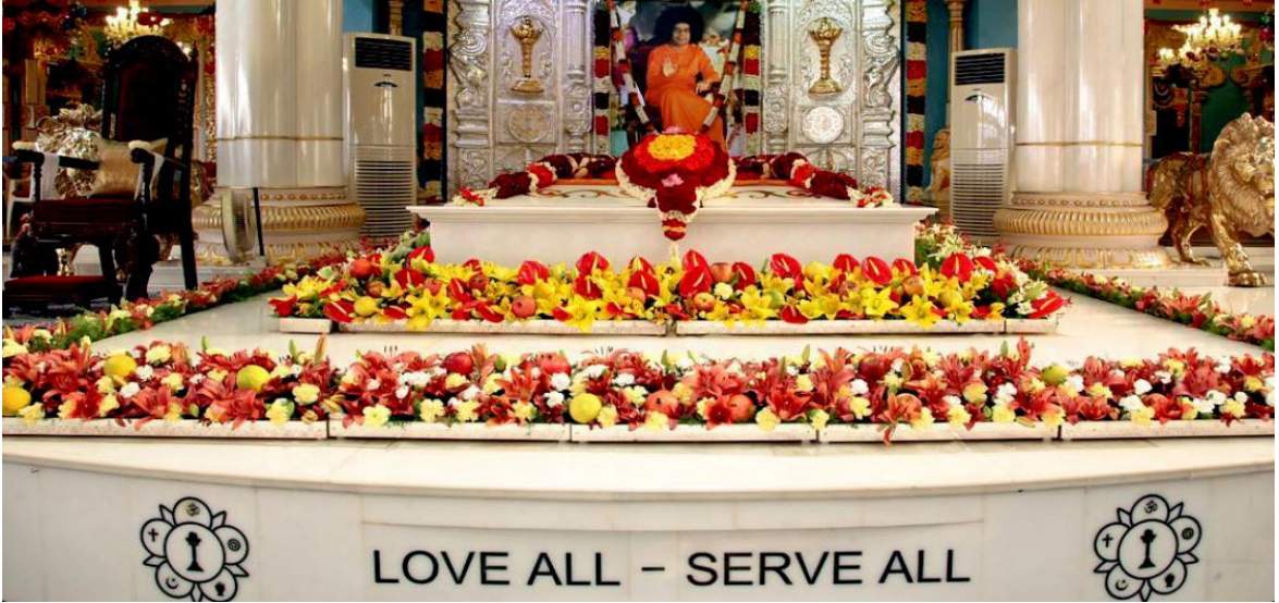
Resim 2: Sunak ve hareketin logosu