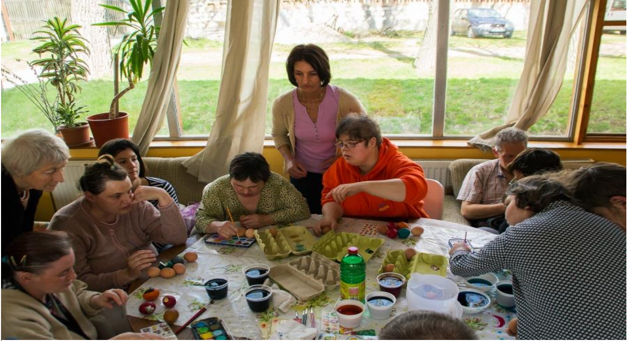
Resim 4: Özel ihtiyaçları bireylerle birlikte Paskalya Bayramı, SSIO Macaristan, 2017