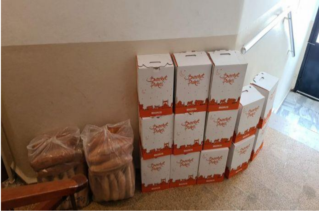
Resim 6: İstanbul Sai Merkezi 2019 yılı Ramazan paketi dağıtımı