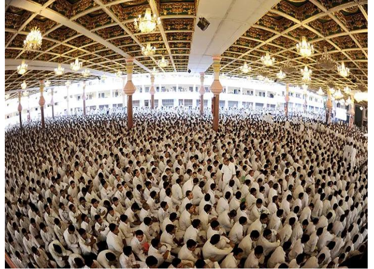
Resim 9/10: Yüzbinlerce kişinin katılımıyla Sai Baba'nın cenaze töreni