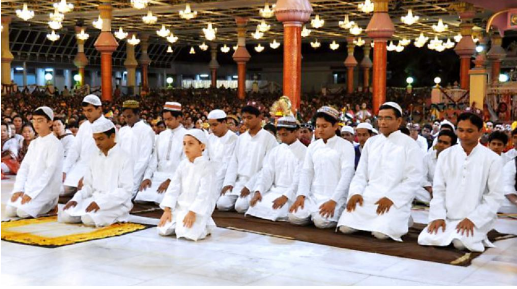
Resim 3: Ramazan Bayramı'nda Prasanthi Nilayam'da bayram namazı