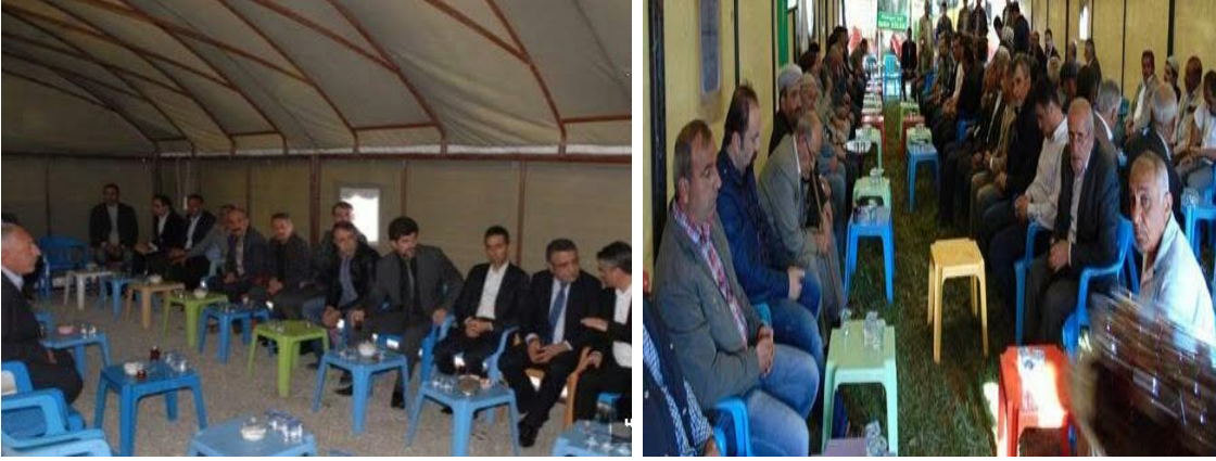
Sekil 3: Taziye Çadırı.