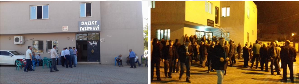
Sekil 4: Taziye Evlerinden Örnekler.