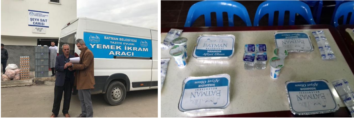
Şekil 7: Belediyenin Yemek Hizmeti.