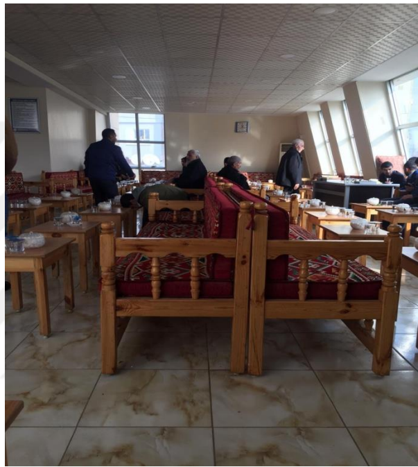
Sekil 5: Belediyenin Denetiminde Olan Taziye Ewleri.