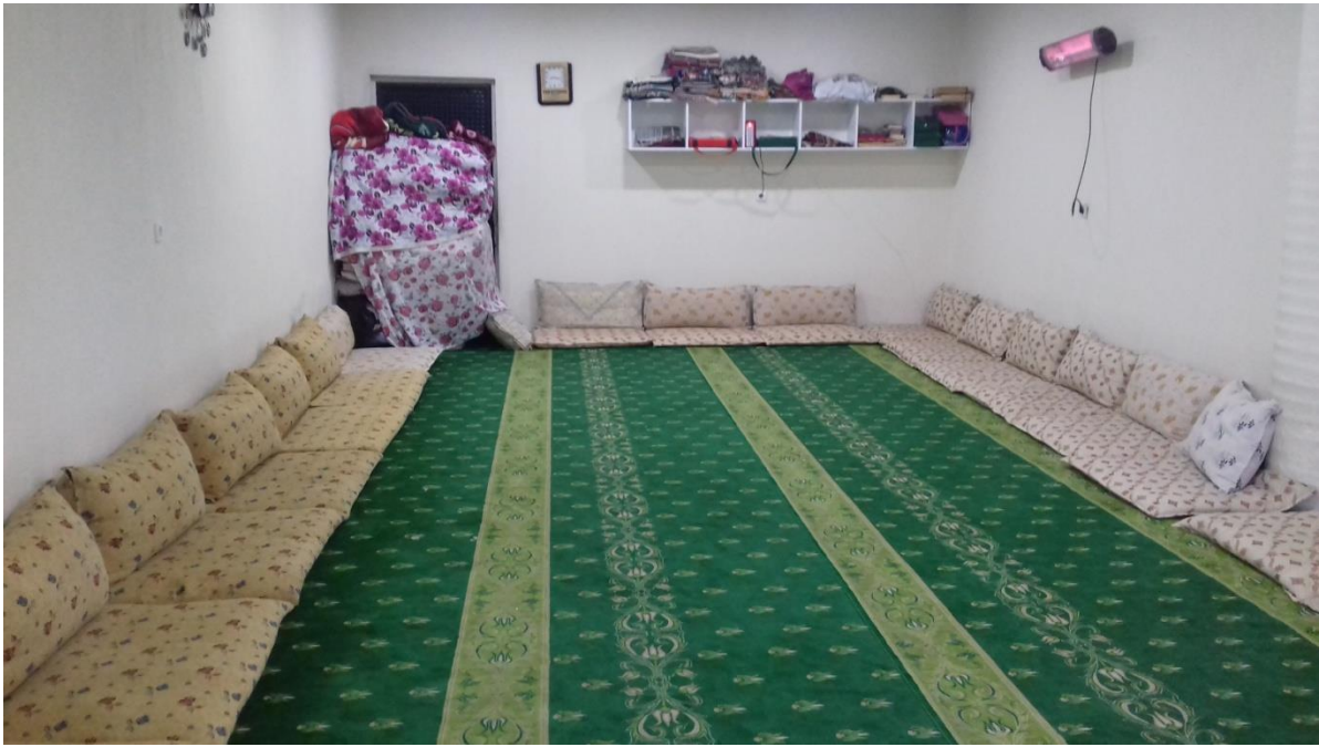
Şekil 8: Kadınlar İçin Ayrılan Bölüm.