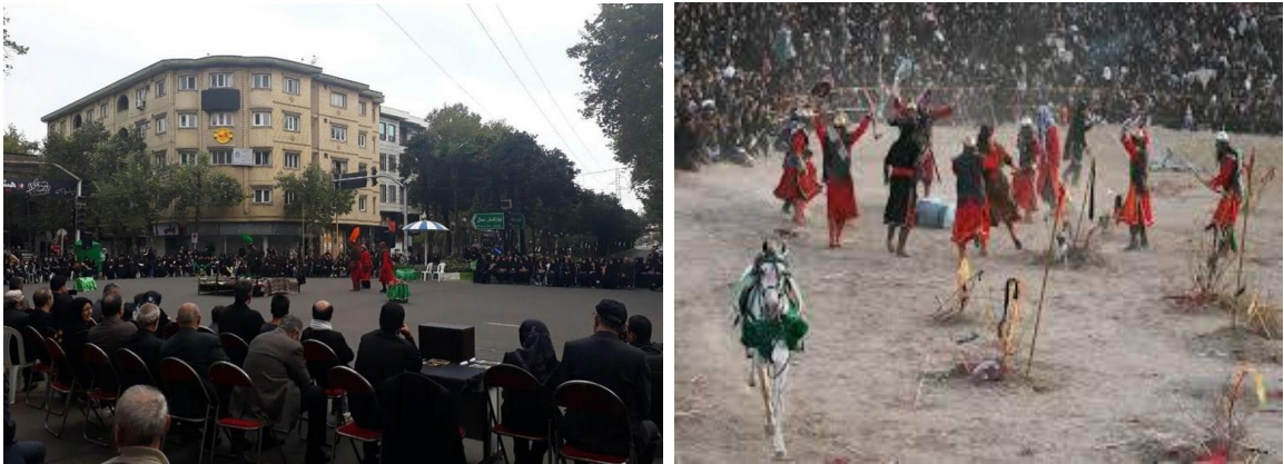
Şekil 2: Sokakta Kerbela Anmaları.