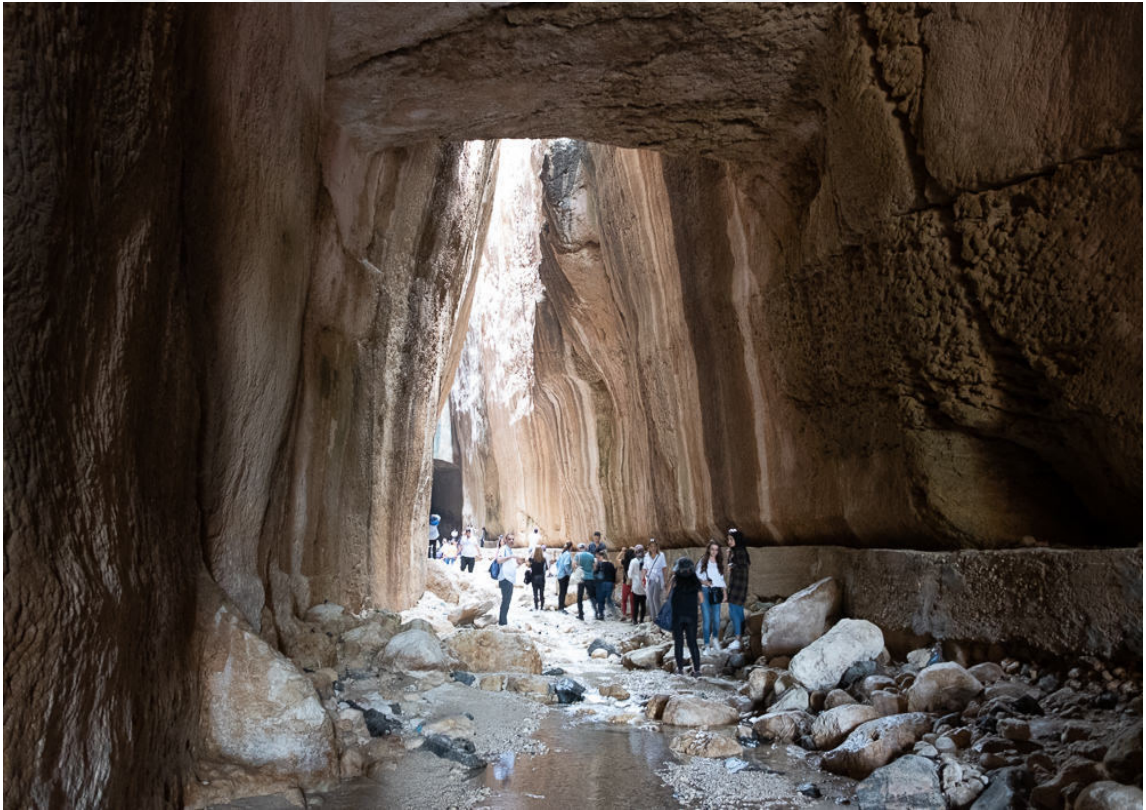
Titus Tüneli (Hatay/Samandağ)

Coğrafi özellikler ve yeryüzü şekilleri insanların yaşam şekillerini, yaşadıkları evlerin mimari özelliklerini, yeme-içme kültürünü ve geleneklerini etkilemiş ve insanlar çağlar boyunca coğrafi şartlara, suyun yakınlığına, hava şartlarının uygunluğuna bağlı olarak yerleşim yerlerini oluşturmuşlardır. Fakat zamanla insanlar, yerleştikleri yerlerin coğrafi özelliklerinden bağımsız olarak kendi kültürleri ve yaşayış şekilleri, ilgi ve ihtiyaçları doğrultusunda doğaya müdahale etmeye başlamış; beşeri faktörlerin etkisiyle coğrafya üzerinde değişiklikler yapmıştır. Yaşadıkları yerlerde barajlar, su kanalları, tüneller yaparak doğaya müdahale etmiş ve yaşadıkları yerleri kendi ihtiyaçları doğrultusunda değiştirmiş ve çevre üzerinde etkili olmuşlardır. İnsanlar geçmişten günümüze tarım alanları ve maden yataklarından istifade ederek bu alanlarda kendi yaşam şekilleri ve kültürleriyle var olmayı sürdürmüştür. İnsanoğlu, kendi oluşturduğu düzen sayesinde doğaya hükmetmeye ve bazen de doğayla işbirliğine girerek, kültürel coğrafyanın oluşumuna katkı sağlamıştır.