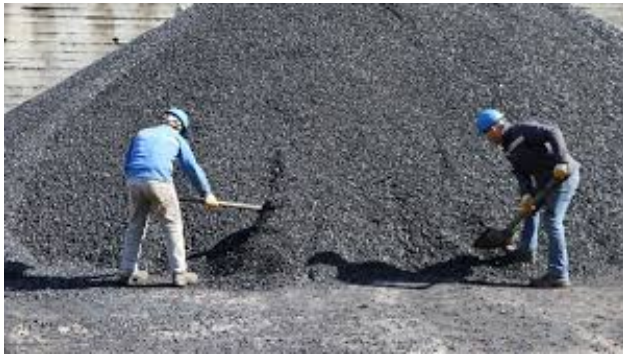
Zonguldak taş kömürü madenleri

Zonguldak'taki taş kömürü varlığı, bu bölgenin gelişmesine neden olmuştur. Özellikle insanlar