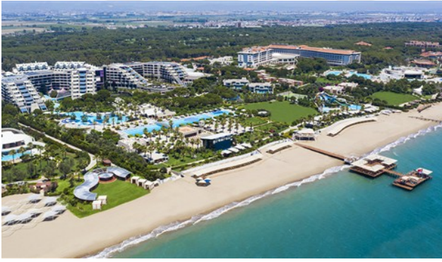
Antalya Belek Oteller

İrlanda gibi yerlerdeki evlerin yapısı birbirinden farklılaşmaktadır. Aynı şekilde bazı yörelerde turizm faaliyetleri önem kazandığı için otel merkezleri öne çıkarken, bazı yerlerde tarım faaliyetleri nedeniyle tarımsal yerleşim yerleri ve seralar önem kazanmaktadır. İnsanların ihtiyaçları, gereksinimleri doğayı farklı şekillerde değiştirmelerine neden olmuştur. Kültürel coğrafya, bir kültüre ait insanların çevreyi anlama şekillerini inceler. İnsanlar karşılaştığı coğrafi unsurların kültürlerine göre anlamlandırılmasıyla, coğrafyada çeşitli değişiklikler ve yenilikler yapılabilir. İnsanların kültürünü oluşturan temel etkenlerden biri olan coğrafi konumunun yanı sıra; din, dil, ekonomi, tarih, sosyal unsurlar da kültürlerin oluşmasında ve farklılaşmasında etkili olmuştur.