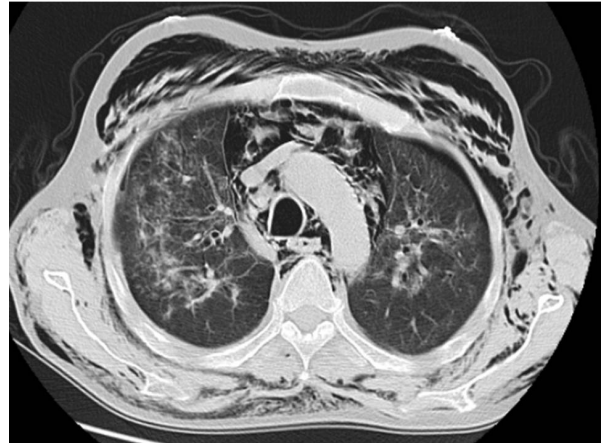
Resim 3: Toraks BT, Bilateral pnömotoraks, pnömomediastinum, yaygın ciltaltı amfizemi