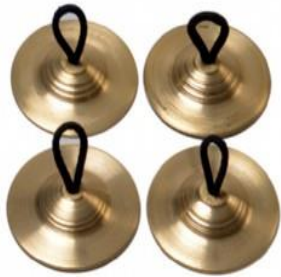
- Parmak zili