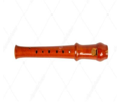
- Blok flüt