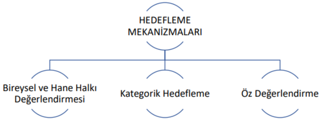
Şekil 2. Hedefleme Mekanizmaları (Karagöl ve Koca, 2019).