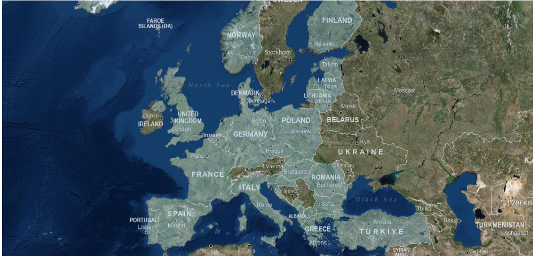
Harita 3.1. NATO Üyesi Ülkeler