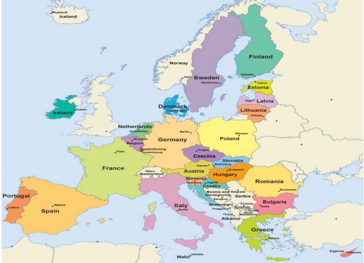
Harita 3.2. AB Üyesi Ülkeler