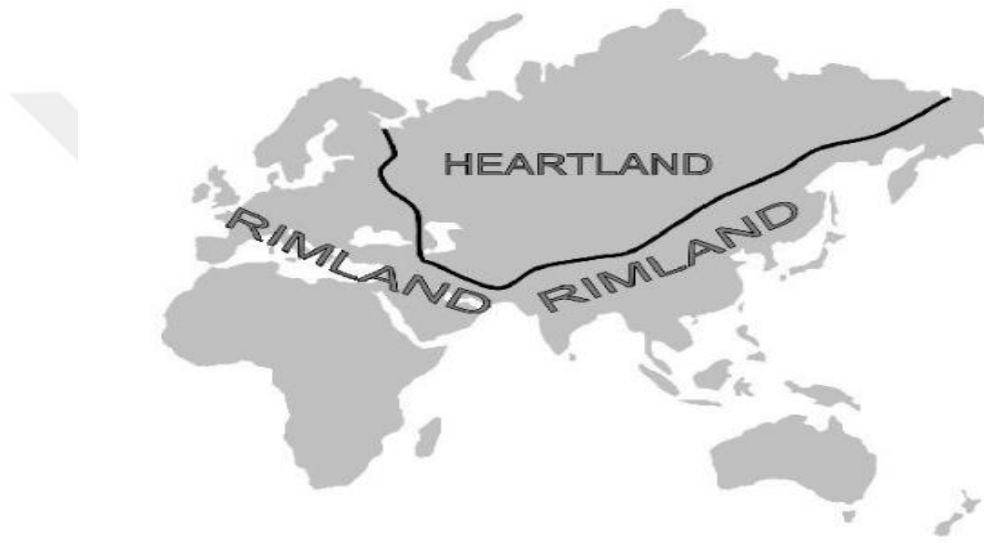
Harita 1.2. Spykman'a Göre Kenar Kuşak Bölgesi