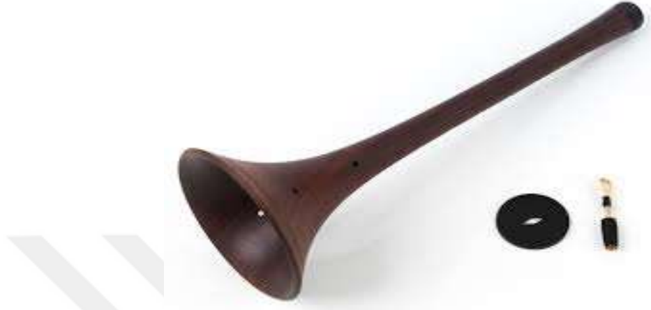
Resim 3- Zurna ve Kısımları

Üfleme bir Türk Halk çalgısıdır. Sesinin gürlüğü nedeniyle daha çok açık alanlarda; köy düğünlerinde, asker uğurlamada, spor faaliyetlerinde, halk oyunlarında ve benzeri törenlerde çalınmıştır. Osmanlı döneminde mehter takımının birincil melodi çalgısı olmuştur. Orta oyununda da kullanıldığı bilinmektedir. Daha çok davul eşlikli çalınmaktadır. Entenasyonun sağlanmasındaki güçlük ve ses hacminin çokluğu nedeniyle çalgı topluluklarında kullanılmaktadır. Ancak son yıllarda bazı halk müziği çalgı topluluklarında kullanıldığı görülmektedir. (Erarslan,2019:18).