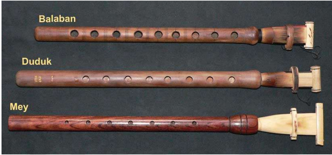
Resim 2- Mey, Duduk ve Balaban

Üfleme bir Türk Halk çalgısıdır. Ana gövde, Kamış ve Kısaç olmak üzere üç parçadan oluşmaktadır. Kısaç kamışın uç kısmına takılmaktadır. Kısaç kamış üzerinde aşağı veya yukarı doğru itilir ve yaklaşık bir perdelik ses değişimi sağlanarak akort edilebilir. Gürgen, ceviz, erik vb. ağaçlarından yapılan mey yaklaşık bir oktavlık ses mesafesine sahiptir. Yedi üstte, bir altta olmak üzere toplam sekiz tane melodi perdesi vardır. Cura mey , orta mey , ana mey olmak üzere üç çeşit mey vardır. Ayrıca Azerbaycan’da meye balaban adı verilmektedir (Kastelli, 2014: 27).