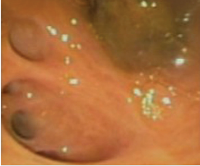
Resim 1. Intrahepatik safra yolu bifurkasyonu ve kanal içerisindeki taş.