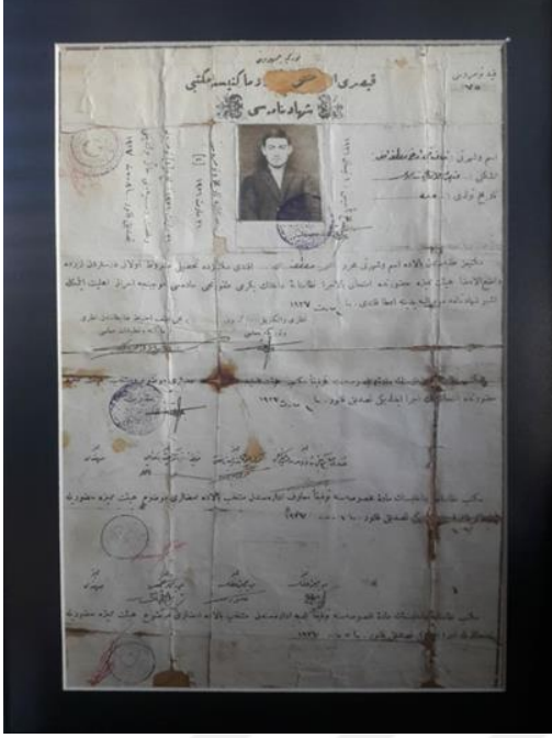
Fotoğraf 3.1. -Katılımcı 3'ün babasının Meslek Lisesi diploması.. (Katılımcının ofisinde sergilemiş olduğu bu diploma sosyal hareketlilik sürecinin veciz bir ifadesi olmuştur.)

Tabiri caizse kuru söğütten düdüğü öttürdük biz. (Katılımcı 3, Erkek, Küçük Ölçekli İşletme Yöneticisi, 64).