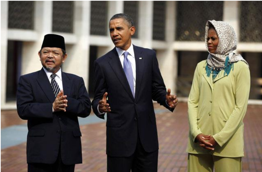
Resim 2: Barack Obama (ortada) ve Michelle Obama (sağda), İstiklal Camii Büyük İmamı KH. Ali Mustafa Yakup (solda), 10 Kasım 2010.