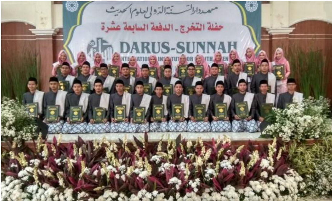
Resim 2: Dâru's-sünne ve'l-hadisın Mezuniyet Töreni.