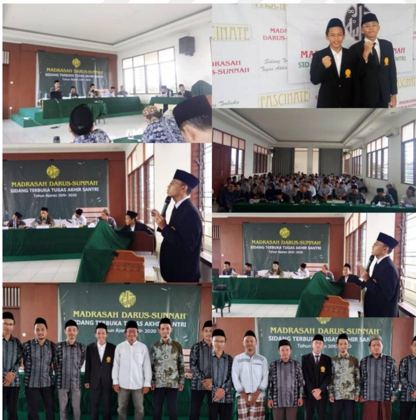
Resim 4: Lisans Tezin Savunması.