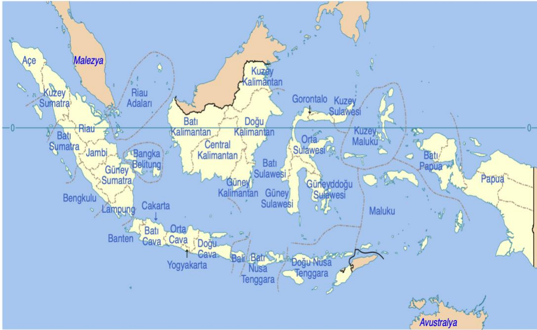
Harita 2: Endonezya İdarî Bölgeler ve Başkentler Haritası.