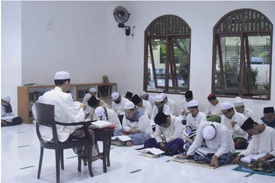
Resim 3: Dâru's-sünne'deki Talebeler. ( https://darussunnah.sch.id/album , 2020).