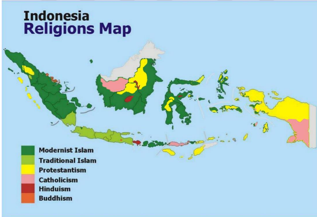
Harita 3: Endonezya'dan dini inançların dağılımı.