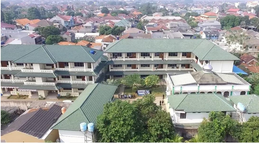
Resim 1: Dâru's-sünne ve'l-hadisın Fotoğrafi ( https://darussunnah.sch.id/ , 2023)