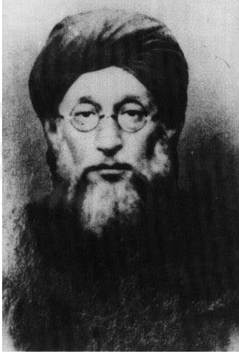
Ek 8. İmam Ahmed Reza Han Barelvi (öl.1921)