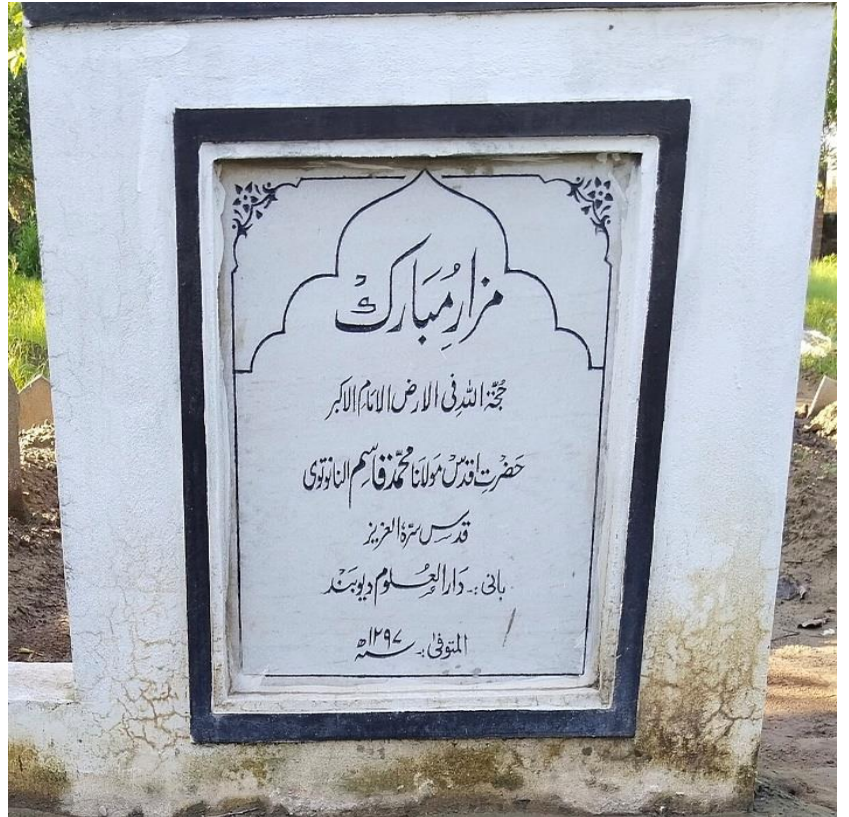
Mv. Muhammed Kâsim Nânotovi'nin Mezarı