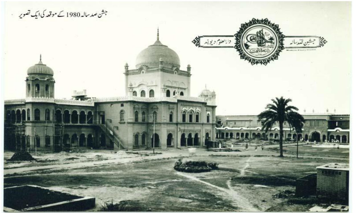
Dâru'l-Ulûm Diyobend (Uttar Pradeş Hint eyaleti) 1980