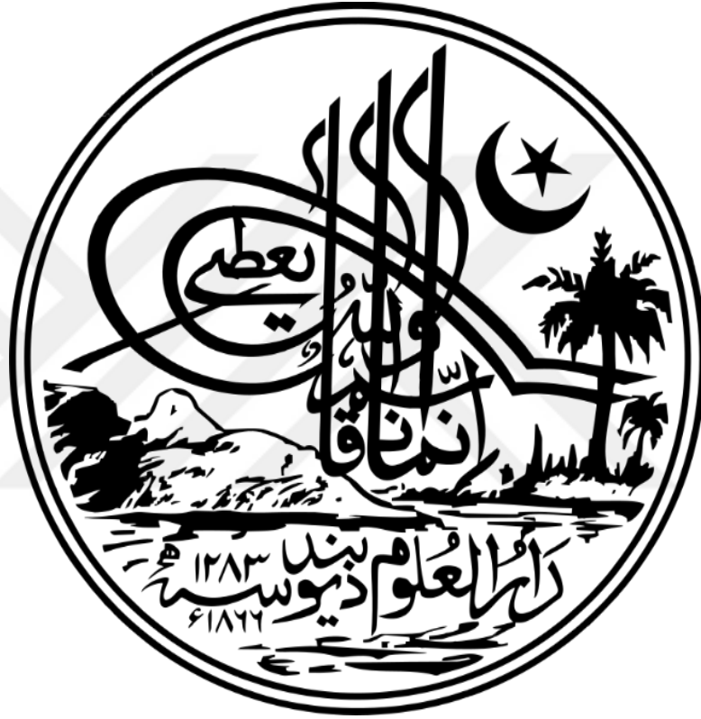
Ek 6. Dâru'l-Ulûm Diyobend'in Mührü.