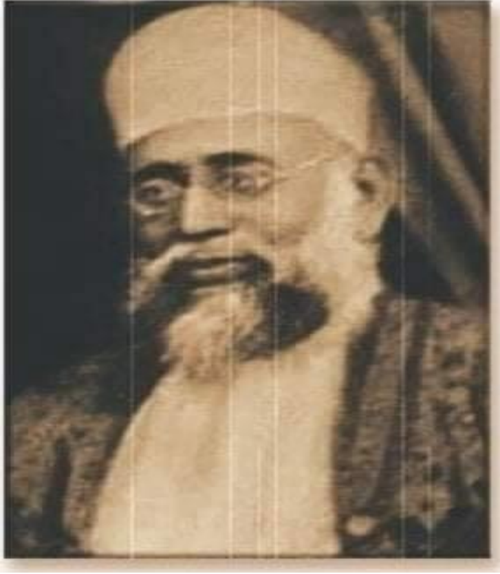
Ek 3. Mv. Muhammed Kâsim Nânotovi (öl.1880)