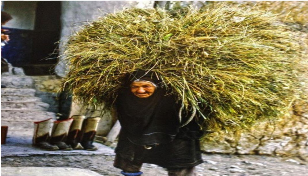
Dağıstan'da Avar Kadını İmaji.