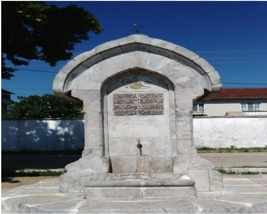
Yalova, Güneyköy, Sultan Reşat Çeşmesi