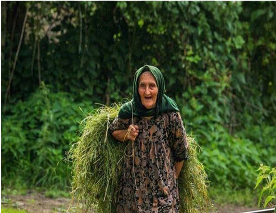
Dağıstan köylerinde Avar kadını imajı.

Avar ailesinde önemli rolü kadın oynamaktadır. Ev içerisinde ve tarlada yapılan tüm işler kadının üzerindedir. Erkek, bir Avar ailesinde evin sahibi, aile reisidir ve sadece ilkbaharda ekim işlerini yapar, diğer mevsimlerde ise çalışmamaktadır. Eşeklerle beraber kadınlar da sırtlarında ot ve odun taşımaktadırlar. Avar adetlerine göre, erkeğin sırtında ağırlık taşınması hoş karşılanmamaktadır ve ayıplanmaktadır (Hapizov ve Galbatsev, 2017: 208-260).