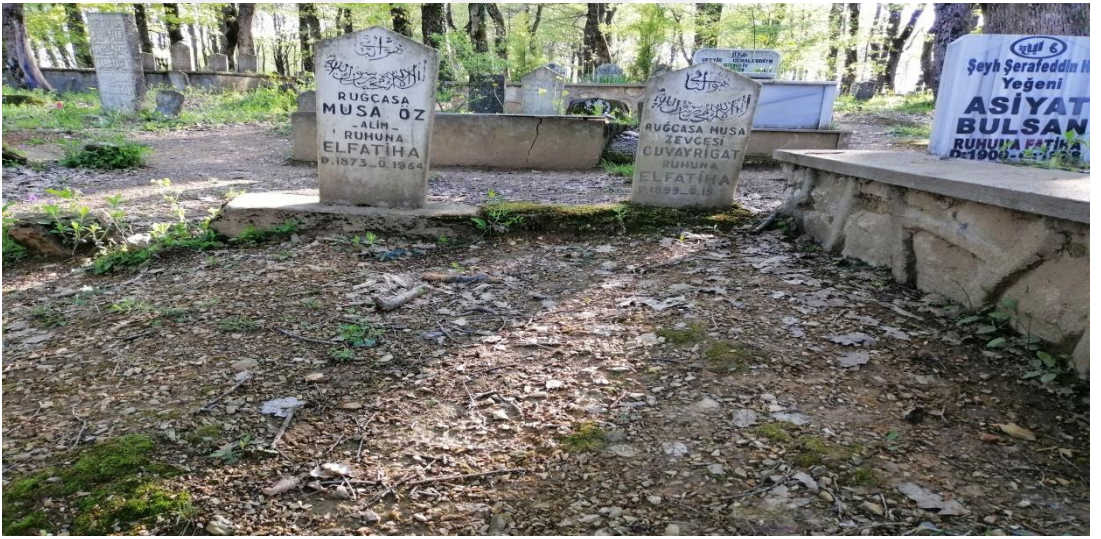
Ruğçasa Musa Öz ve Ruğçasa Cuvayrigat'ın mezarı