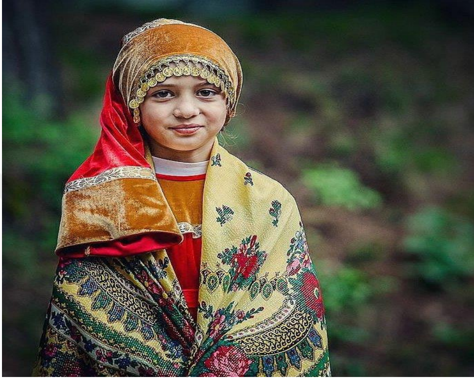
Genç Avar kızı kıyafeti.

renge ve başörtü örtme şekli, kadının yaşının ona verdiği bilgeliğini ve ruhsal huzuru, genç kızın renkli ve daha komforlu giysileri ise özgürlüğü ve gençliği sembolize etmektedir.