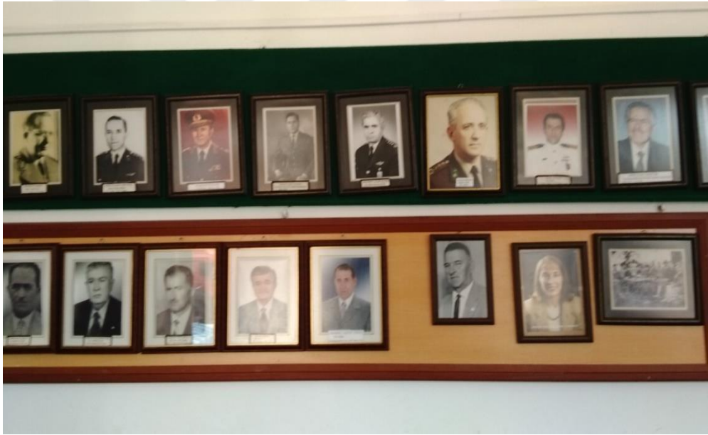
Güneyköy Muhtarlığının Şeref Levhası (Güneyköylü Profesörler, Albaylar, Generaller)