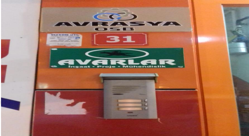
Yalova, Merkez. Avar Bayrağının Amblemini Taşıyan Avarlar İnşaat firması

nedeni ise kültürel faktörler olan örf adetlerin bir kısmının halen bu toplum içerisinde yaşatılıyor olmakla, dilin tam olarak unutulmamasıyla alakalandırılmaktadır.