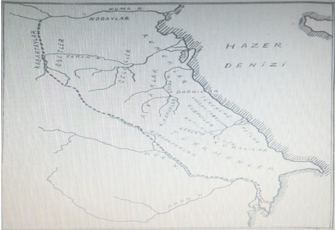
Harita 2: Ş. Erel'in Dağıstan ve Dağıstanlılar kitabından Dağıstan'da yaşayan etnik grupların haritası.

Avarların demografik durumu ile ilgili bilgilerden sonra Dağıstan Avarlarının kökeni üzerine kaynaklar ışığında açıklamalar yapmanın yararlı olacağı kanaatindeyim. Kuzey Kafkasya Avarlar'ının kökenleri halen bir çok tarihçinin tartışma konusudur. Bazı tarihçiler, Kuzey Kafkasya Avarlar'ının Ortaçağda Avar Kağanlığını kuran Avarlar'ın torunları oldukları fikrini ileri sürdürmektedirler. Nitekim Avarlar, Karadeniz kıyısında ve Kafkasya'daki Sabarlar, Onogurları ve bir Slav kabilesi olan Andları mağlup ederek, sınırlarını Aşağı Tuna'ya kadar genişlettiler (Taşağıl, 2013:64). Bu esnada da Avar Kağanı'nın kendi etnisiteden olan insanları Kuzey Kafkasya topraklarına yerleştirmiş olma ihtimali görülmektedir. Kuzey Kafkasya Avarlar'ının Rusya İmparatorluğu'nun tahakkümü altına geçmeden önce Avar dilinden ziyade Türk dilinde konuştukları da dikkatten kaçırılmamalıdır. Bütün bunlardan ziyade, Şeyh Şamil'in Kuzey Kafkasya'da İmamat Devleti'nin kuruluşundan sonra Türk dilini milletler arasında konuşulan ortak dil olarak ilan etmek istemesi de tesadüfi değildir. Bunun gibi bir çok kanıt Dağıstan Avarları'nın Türk oldukları düşüncesini daha da pekiştirmektedir.