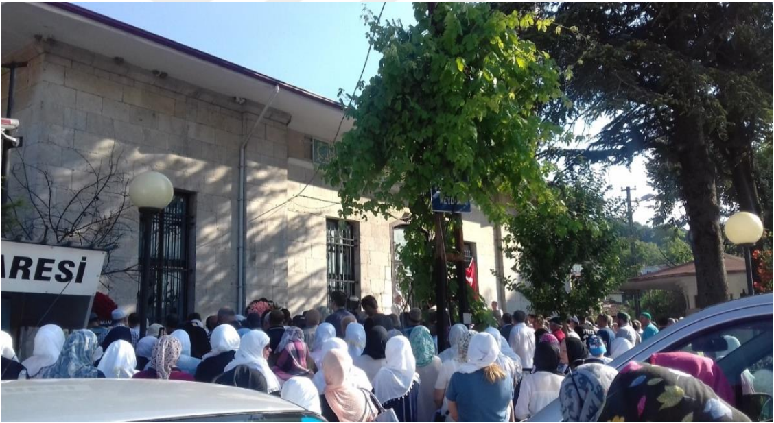
Yalova, Güneyköy 'de Katılmış Olduğumuz Cenaze Töreni