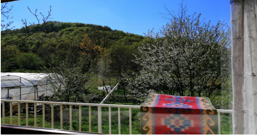
Yalova, Güneyköy. Bir Güneyköy evinin bahçesi