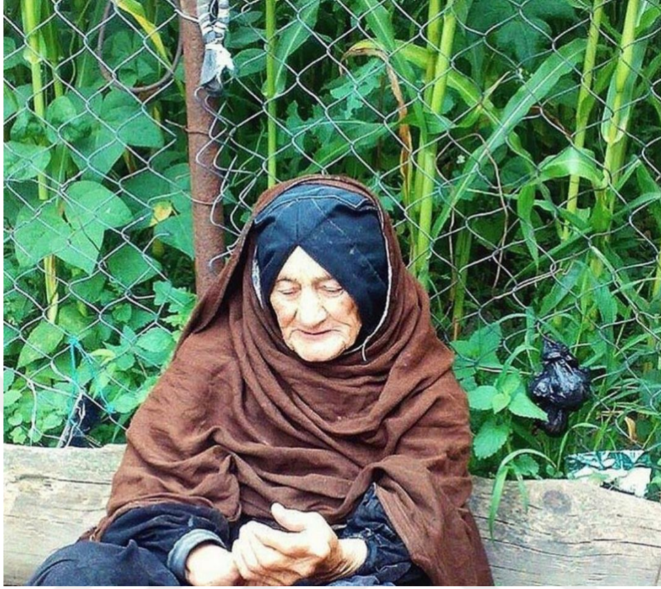
Yaşlı Avar kadını kıyafeti.

Avarlar'ın geleneksel toplum yapısı şeriat kanunlarına, karşılıklı yardımlaşmaya, misafirperverlik ve kan davası üzerine kuruludur. Davranış biçimlerinde en önemli faktörler; yaşlılara saygı, adetleri ve geleneksel etik kuralları sıkı bir şekilde uymadır (İslammagomedov ve Sergeeva, 2000: 21-22).