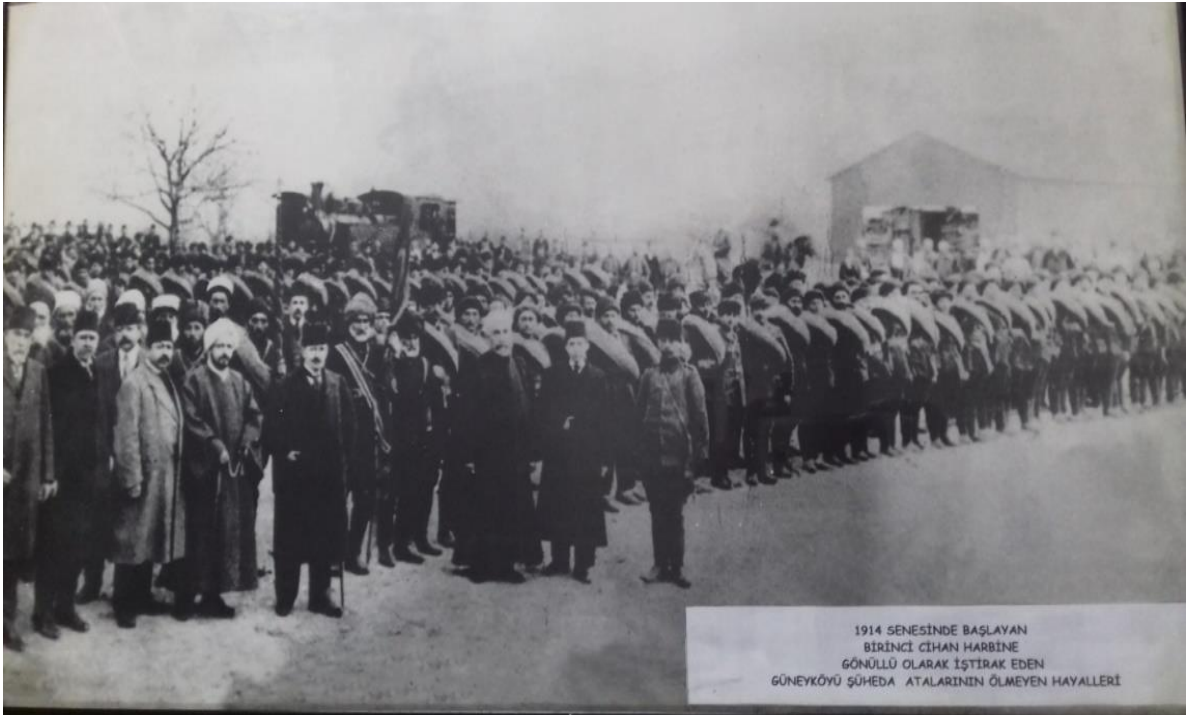
1914 Senesi, I. Dünya Savaşında Osmanlı Ordusunda Güneyköylü Dağistanlılar.