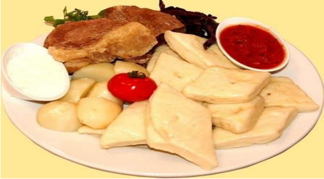
Hinkal'ın Bir Türü