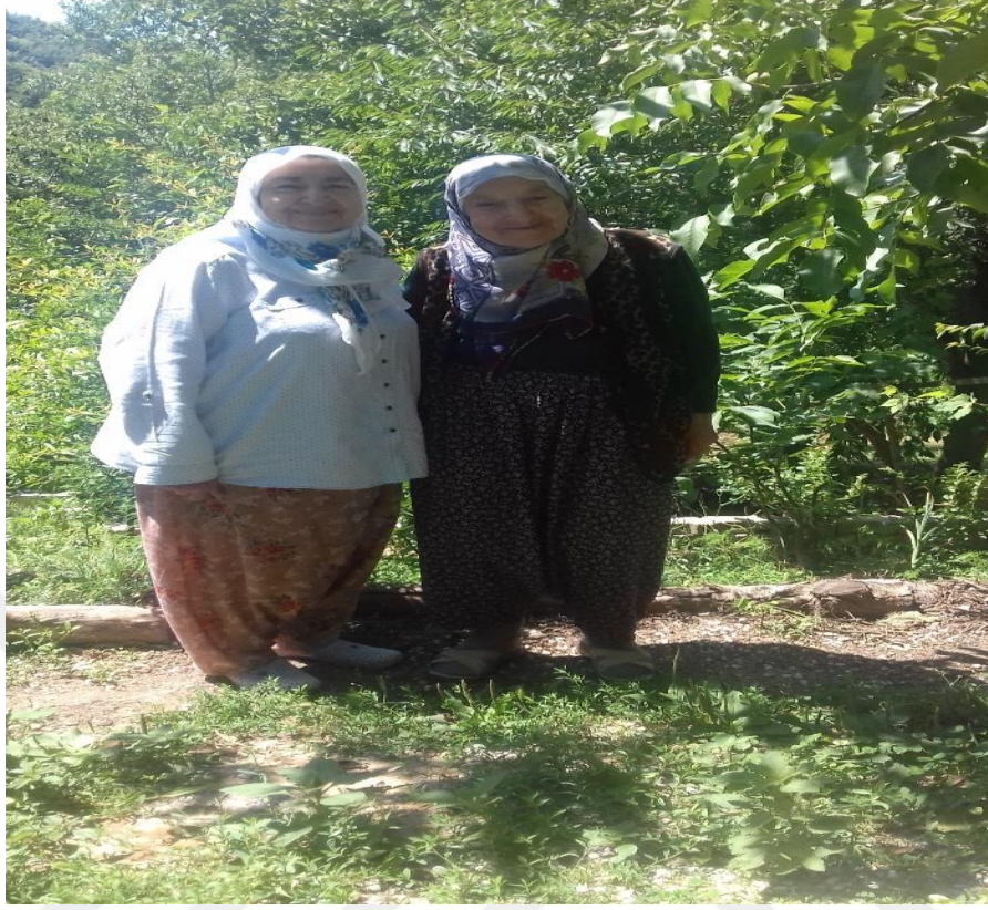
Şalvarlı Güneyköy Avar Kadınları

Güneyköy’de gözlemlenen önemli hususlardan bir tanesi, köy kadınlarının kıyafette günümüz modasına uygun bluz ve diğer üst giysileri tercih ettikleri taktirde, bu giysilerle birlikte Türk kültürüne ait olan şalvarın giyilmesidir. Köyün neredeyse tüm kadınları istinasız şalvar giymeyi tercih etmektedirler. Bu tercihin sebebi, şalvarın daha pratik ve rahat bir giysi olmasından kaynaklanmaktadır. Şalvar giyme geleneği, Güneyköy’e 1952 yılında gelmiştir. Şalvar giyme geleneğinin Güneyköy’e gelme sebebi tüm köy halkı tarafından, bir hikaye olarak anlatılmaktadır. O yıllarda köyde çekilen “Yurda dönüş” filminde başrolde oynayan oyuncunun üzerindeki şalvar Güneyköy kadınları tarafından beğenilerek benimsenmiştir. Güneyköy Avarlar’ı Türk kültürü içerisinde olan daha kolay gördükleri gelenekleri hayatlarını kolaylaştırmak amacıyla uygulamaya başlamışlardır ve gelenek haline getirmişlerdir.