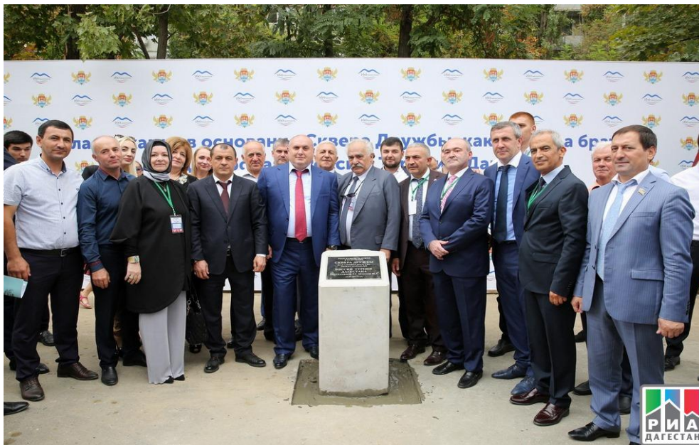
Dağıstan, Başkent Mahaçkala, Türkiye ve Dağıstan Halklararası Dostluk Parkı.