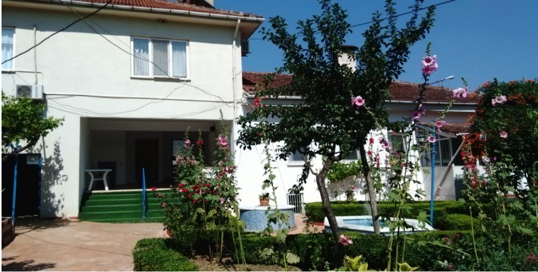
Yalova, Güneyköy, Nakşibendi Dergâhı