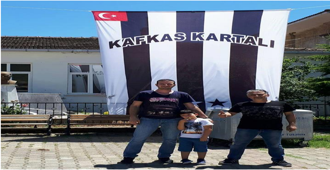
Yalova, Güneyköy Meydanı. Türkiye Bayrağı, Beşiktaş Bayrağı ve 'Kafkas Kartalı' Yazısı