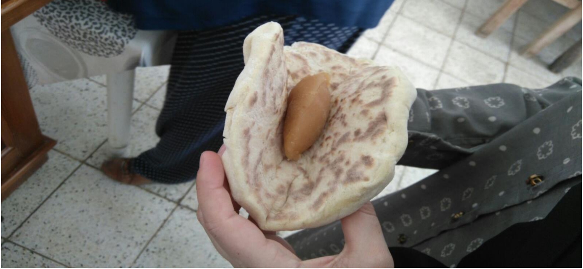
Güneyköy 'de Cenazede Dağıtılan Un Helvası ve Karbonatlı Ekmek (Pank)