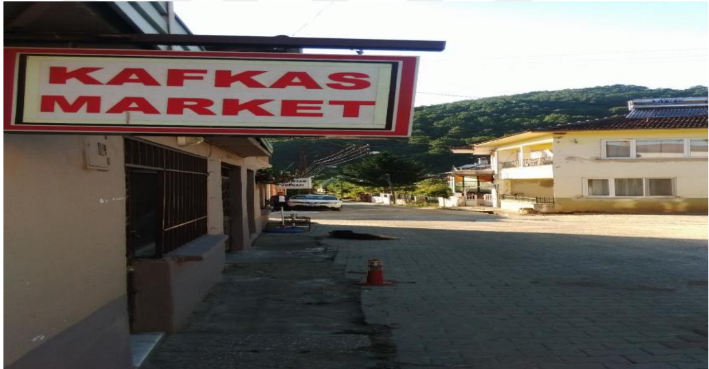
Güneyköy, 'Kafkas Market' Bakkalı