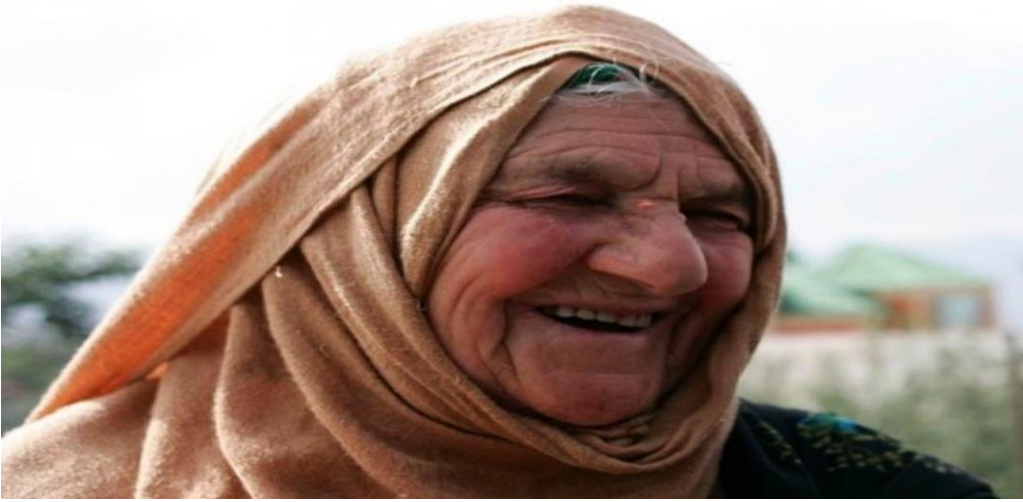
Dağıstan'da Avar Kadını.