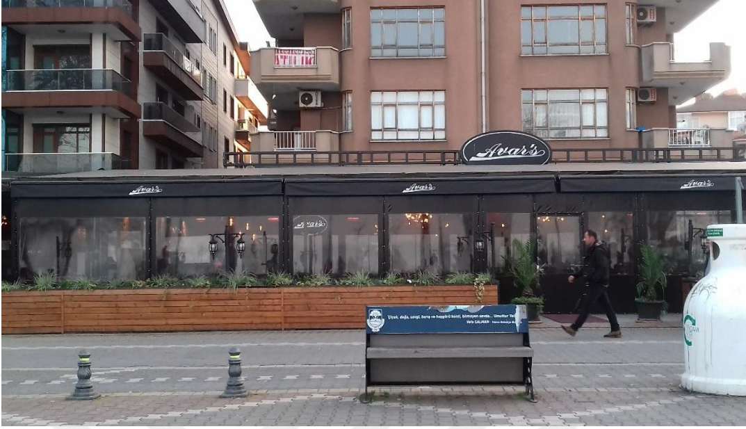
Yalova, Merkez Sahil, Kafe Avar's