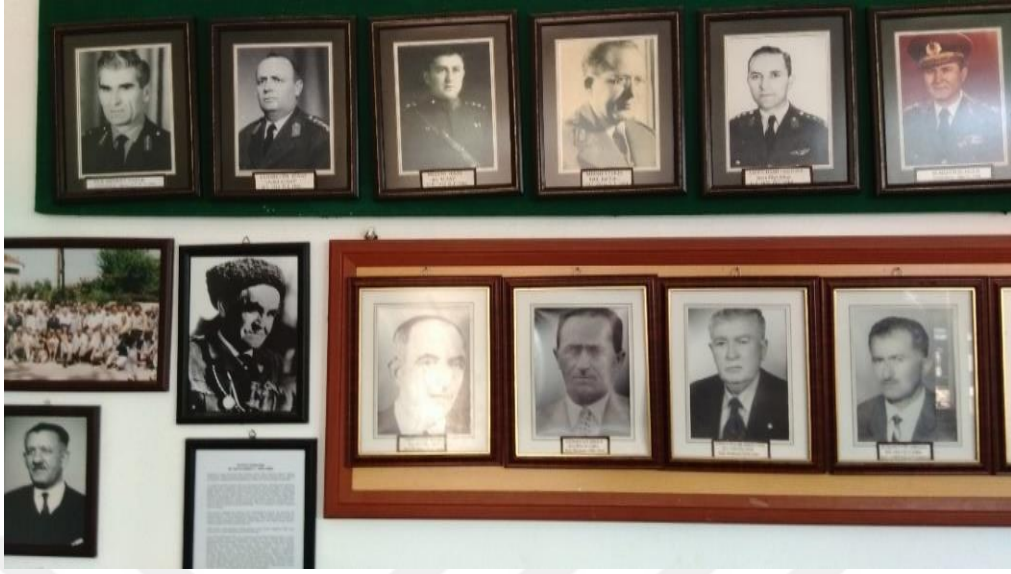
Yalova, Güneyköy, Muhtarlık Binasının 'Şeref Duvarı'