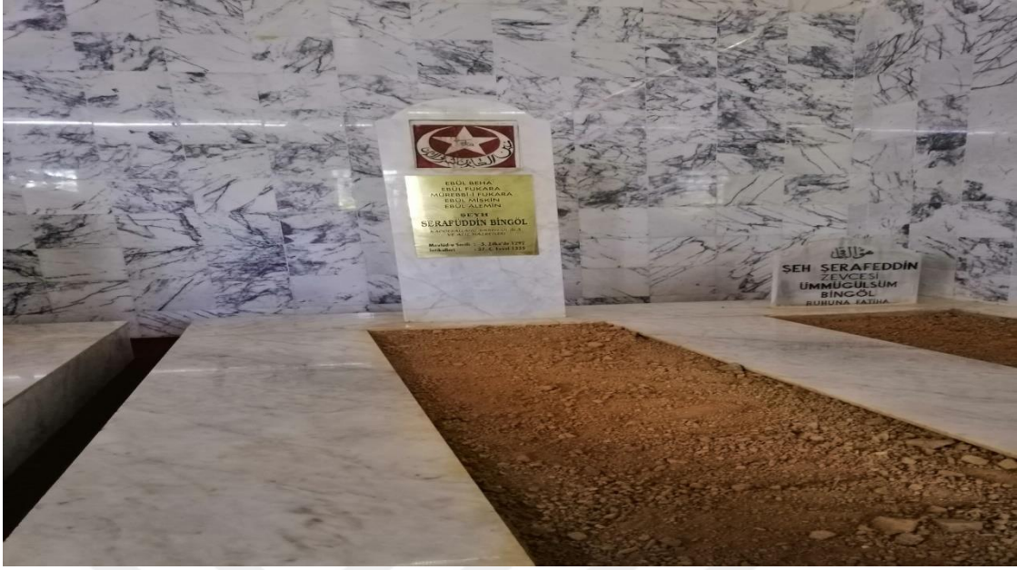
Güneyköy, Türbe içerisinde Dağıstan Şeyhi Şerafettin Dağıstani'nin mezarı