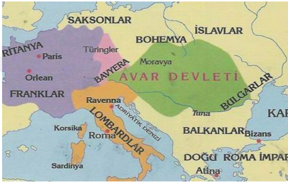
Harita 1: Avrupa’da Avar Devletinin haritası.

olmuştur. Avarlar, bu altınların mühim bir kısmını kuyumculukta kullanıyorlardı. Erdel’de yapılan bir kazıda Avarlar’a ait kuyumcu aletleri ile 3.000 Bizans altını bulunmuştur. Tisa boylarındaki surlardan çıkan gayet kıymetli ve zengin Avar hazineleri de Frankların eline geçerek batıya nakledilmiştir. Avar hakimiyeti Avrupa’da VIII. yüzyılda yavaş yavaş ortadan kalkmaya başlamıştır. Bu yıkılışın başlıca sebepleri, Avrupa milletlerin Avarlara karşı birleşmeleridir (Erel, 1961: 32).