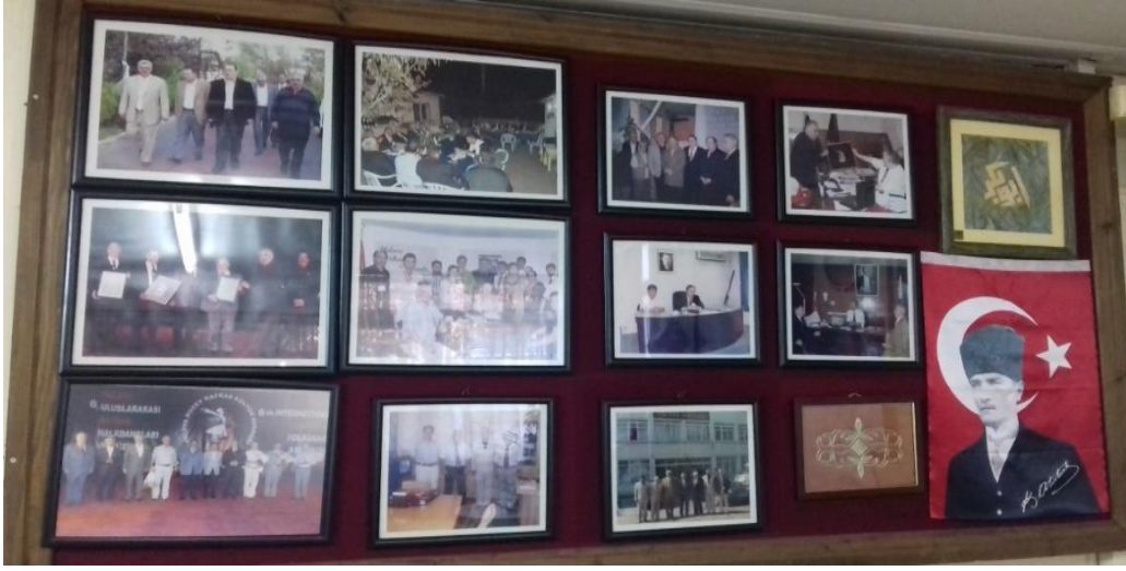
Kuzey Kafkasya Derneğinin Faaliyet Levhası