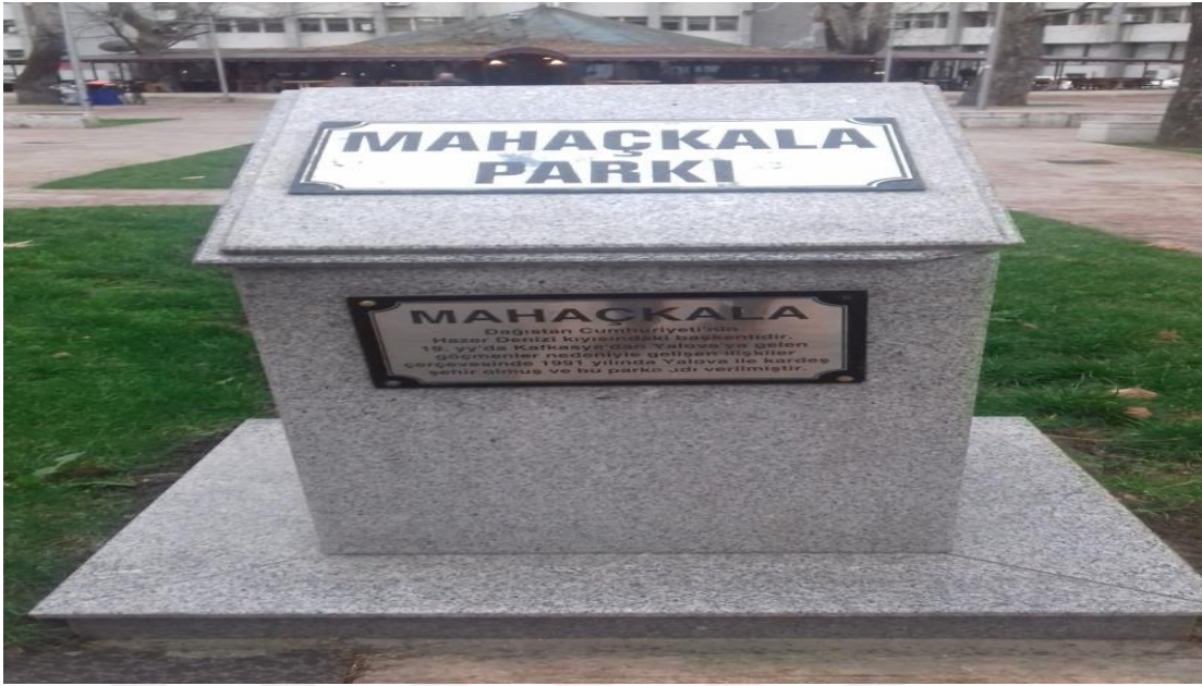
Yalova Merez, Mahaçkala(Dağıstan'ın Başkenti) Parkı

Yoldan Geçen bir insanın Avar olduğunu anlar mısınız? Bunu nasıl tespit edersiniz?