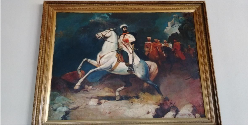
Yalova, Güneyköy Dağistan Sofrası Lokantasında Şeyh Şamil Portresi