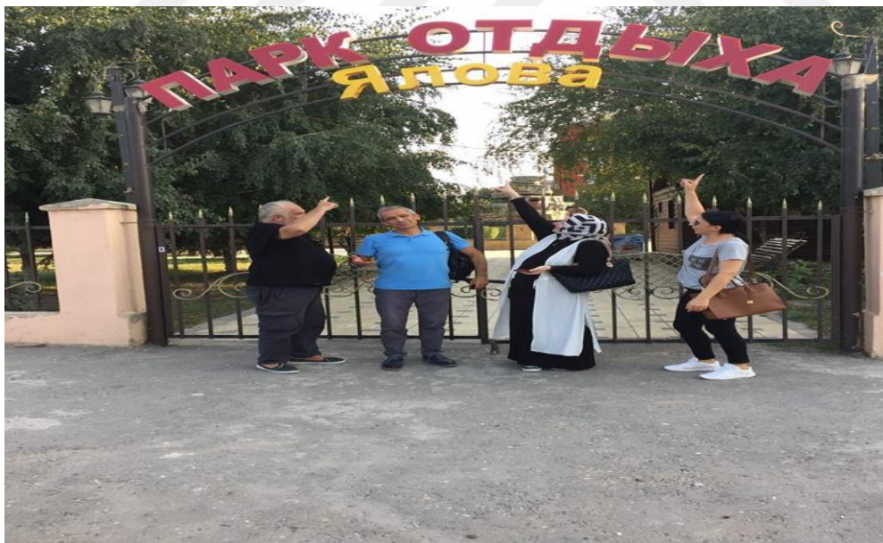
Dağıstan, Hasavyurt ili, Yalova Parkı