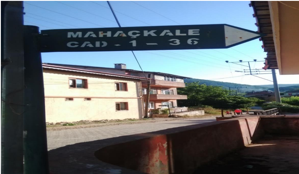
Yalova, Güneyköy, Mahaçkale Caddesi (Mahaçkale Dağıstan'ın Başkentidir)

Güneyköy'de sokakların ve mekânların isimleri bu köyün Dağıstanlıların yaşadığı bir köy olduğunu hatırlatmaktadır. Örneğin köydeki caddeler Mahaçkale, İmam Şamil, Medeni caddesi olarak isimlendirilmektedir.