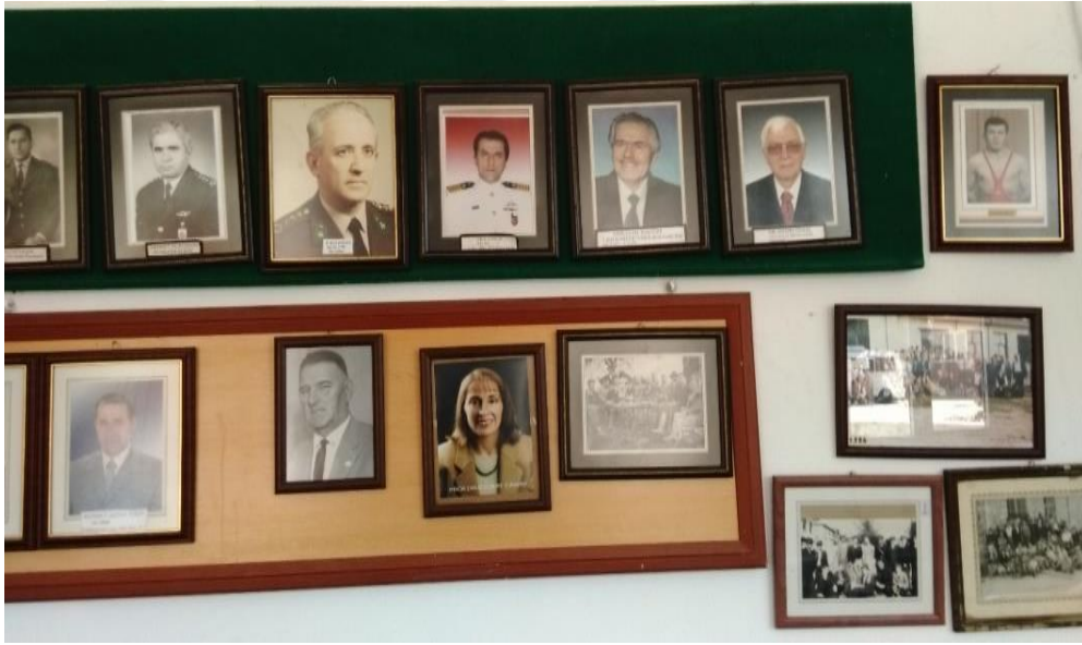
Yalova, Güneyköy, Muhtarlık Binasının 'Şeref Duvarı'

Hali hazırda, Güneyköy'de öğrenci sayısının az olması sebebiyle, köyde bulunan ilkokul faal durumda değildir. Köyde ilkokul yaşlarında on çocuk bulunmaktadır. Bu öğrenciler, taşınmalı sistemle komşu köylerdeki okullarda eğitimlerini devam ettirmektedirler.