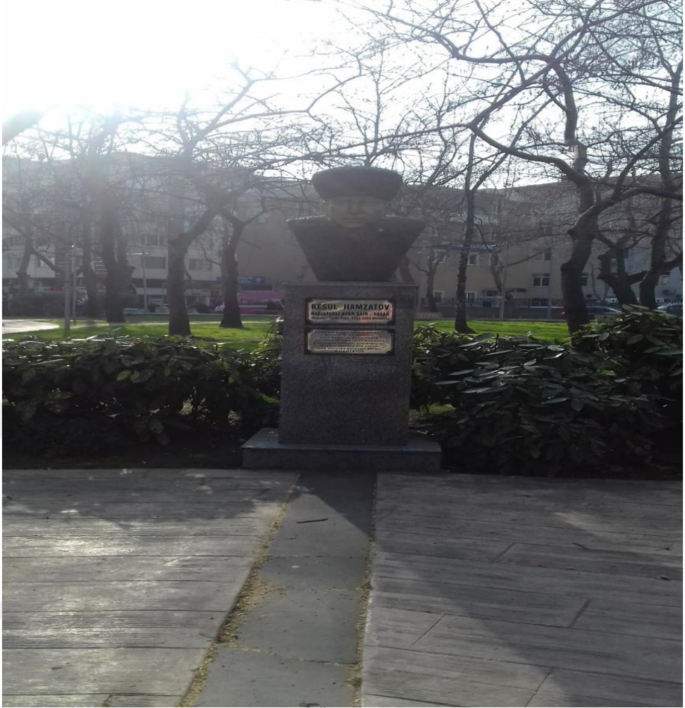
Dağıstan'ın ve Sovyetler Birliği'nin Ünlü Şairi Rasul Hamzatov'un Heykeli