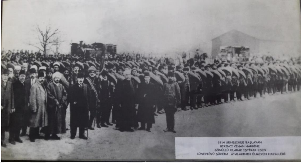
Birinci Dünya Savaşına gönüllü olarak katılan 300 Güneyköylü