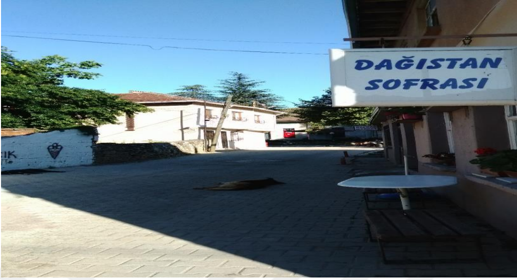
Güneyköy, 'Dağistan Sofrası' Lokantası