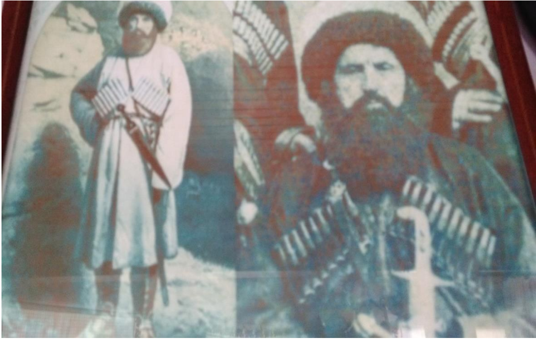
Yalova, Güneyköy Evinde Dağıstan’ın Şeyhi Şeyh Şamil Portresi

Köyde girdiğimiz her mekânda burada yaşayan Avarlar’ın Türkiye’ye aidiyetlerinin bir simgesi olarak Türk Bayrağı ve Dağıstan’a aidiyetlerini gösteren Şeyh Şamil’in portrelerine rastlanılmaktadır.