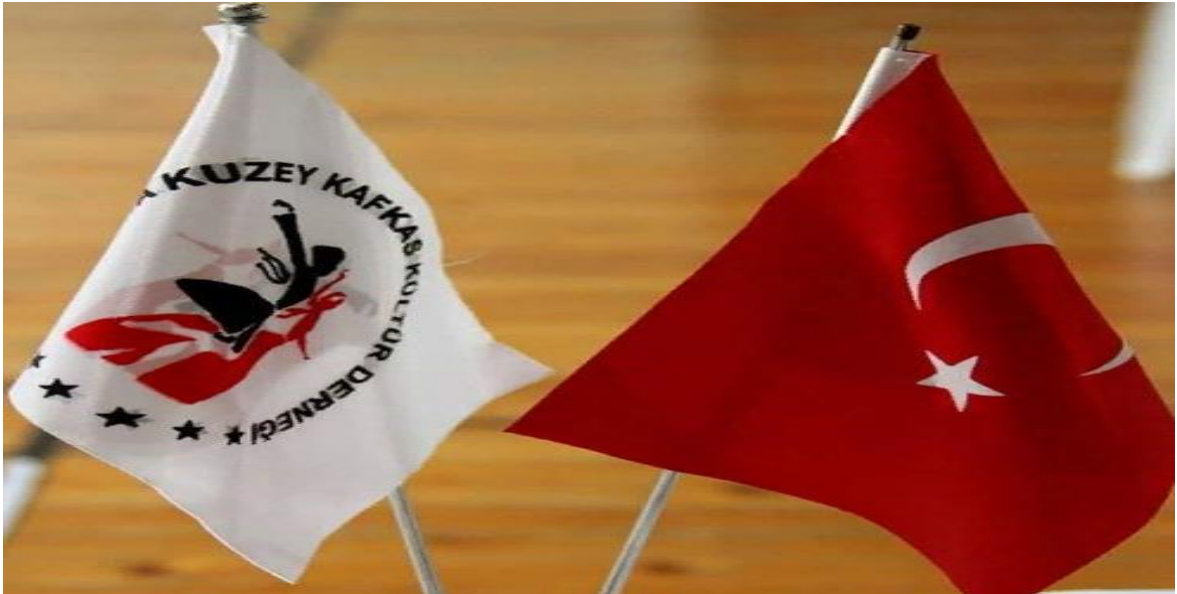
Kuzey Kafkasya Kültür Derneđi ve Türk Bayrađı

Bu derneklerin faaliyetleri Kafkas kùltürlerine ait dansları öğretmek, Kuzey kafkasya'ya geziler düzenlemek, tüm Kafkas ÷lkelerarası festivaller düzenlemek, derneklerin yönetim kurulunun Avar ve Güneyköylü olmaları nedeniyle her yıl Güneyköy'ünde Kafkas halkları şenliklerini düzenlemek, Kafkas halklarının ortak dili olan Rusçayı öğretmek üzerine kuruludur. Bu dernekler arasında en aktif şekilde faaliyet gösterenlerden bir tanesi bizimde ziyaret ettiđimiz “Kuzey Kafkasya Derneđi”dir. Dikkat çeken unsurlardan bir tanesi Kuzey Kafkasya derneđinin bayrađının Türkiye'nin büyük spor kulüplerinden olan Beşiktaş Spor Kulübü bayrađıyla renk benzerliđidir. Araştırmamız neticesinde, Güneyköy Avarları'nın ađırlıklı olarak Beşiktaş Spor Kulübünün taraftarı oldukları tespit edilmiştir. Köyün meydanında Türk bayrađının yanında Beşiktaş bayrađı da dalgalanmaktadır. Kuzey Kafkasya Derneđi bayrađının Beşiktaş bayrađına benzerliđi tesadüfi deđildir. Bu meselenin çözüm noktası, Dađıstan Avarları'nın uzun yıllardır kendilerini “Kafkas Kartalı” olarak nitelendirmelerinin altında yatmaktadır. Dolayısıyla, kendilerini “Kafkas Kartalı” olarak tanımlayan Güneyköy Avarları, ambleminde Kartal resmi olan Beşiktaş spor kulübüyle benzerlik duymaktadır ve yakın görmektedir.