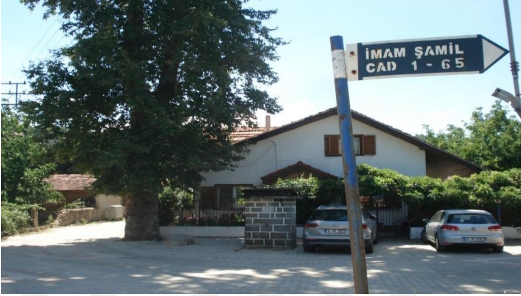
Yalova, Güneyköy, İmam Şamil Caddesi (İmam Şamil Dağistan ve Çeçenistan Şeyhi idi)