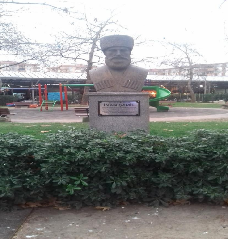
Yalova, Mahaçkala Parkı, Şeyh (İmam) Şamil heykeli